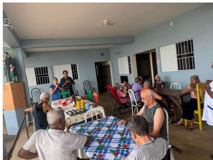
Diretores da ilpi