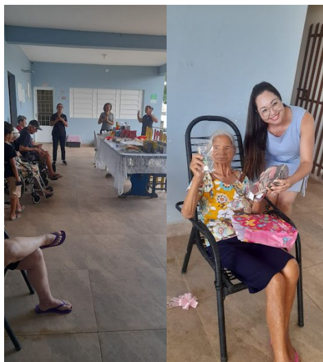
M.M.V. – FESTA DE NATAL