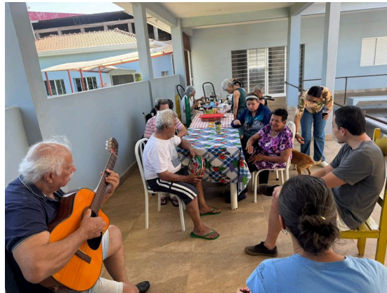
Grupo de amigos – Pres. Prudente