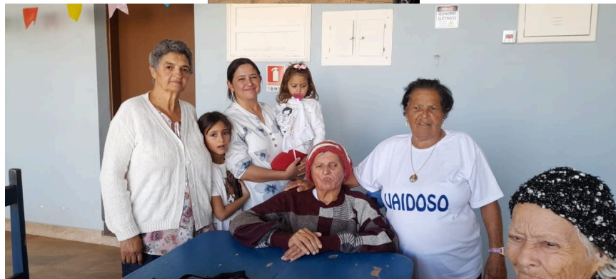
Familiares do Miguel