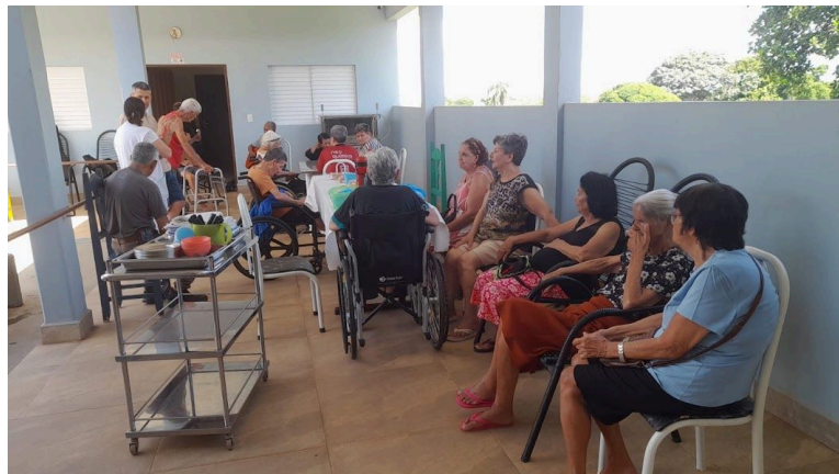
Pastoral Legião de Maria – FESTA DE NATAL