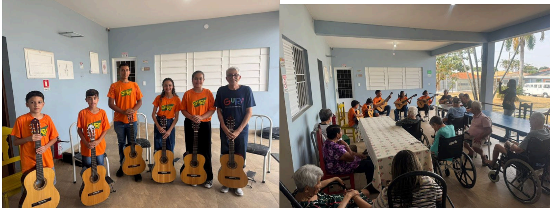
Realizada em 09/10/2025