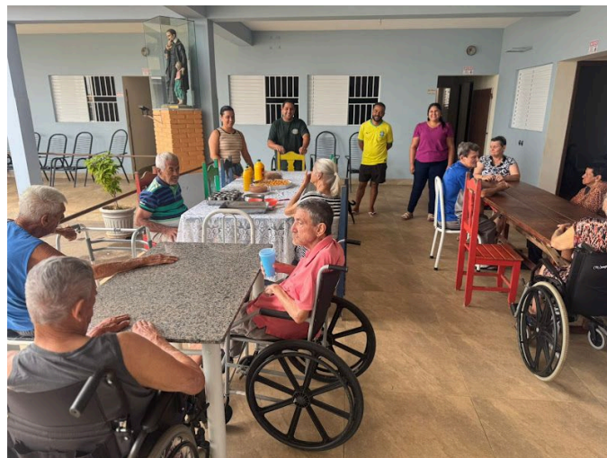
Setor São Sebastião