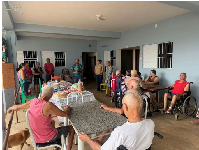
Setor Santa Bárbara