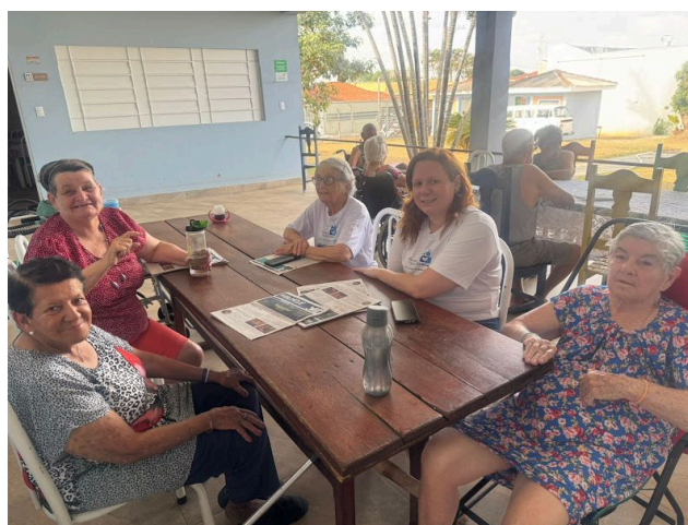
Pastoral da Pessoa Idosa