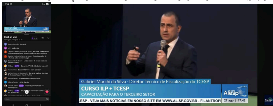
Assistente Social da entidade participou, on-line