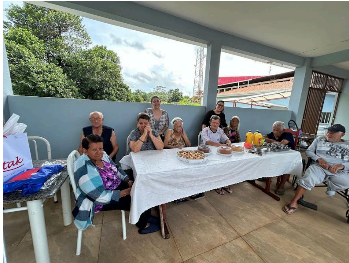
Centro Espírita André Luiz – FESTA DE NATAL

ASSOCIAÇÃO LAR DOS IDOSOS DE ALVARES MACHADO Rua Campos Salles, nº 10 – CEP 19.160-011 - Fone (18) 99731-5197 Alvares Machado – SP CNPJ 51.400.000/0001-10 E-mail: lardosidososdam@yahoo.com.br