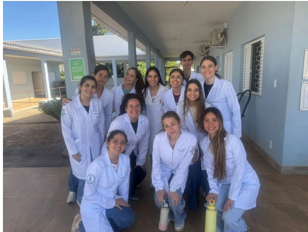
Acadêmicos de Medicina – UNOESTE