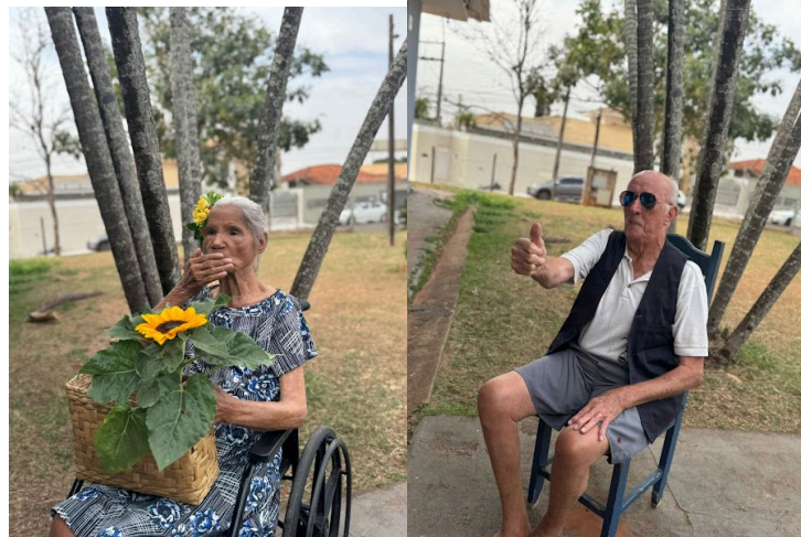
Realizada em 02/10/2025