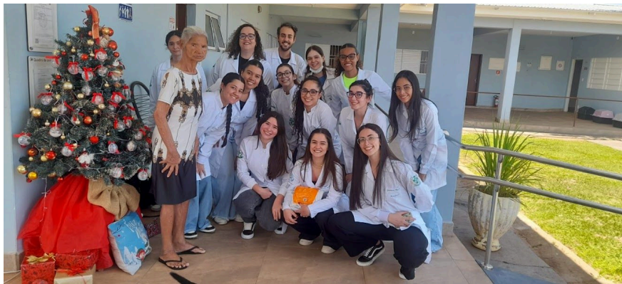
Alunos do curso de Estética/Unoeste