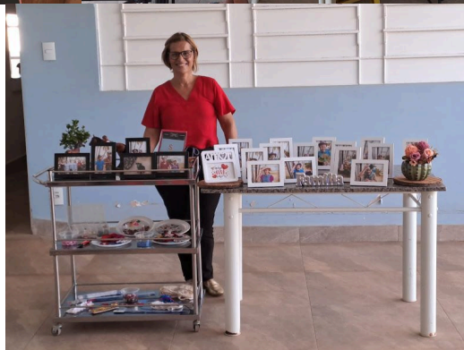
Realizada em 16/10/2025