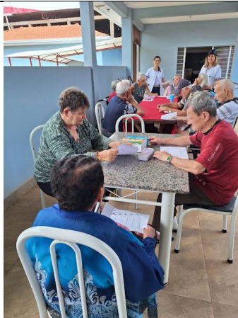
15/12/2025 – acompanhamento psico