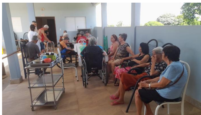
Pastoral Legião de Maria – FESTA DE NATAL – 20/12/2025