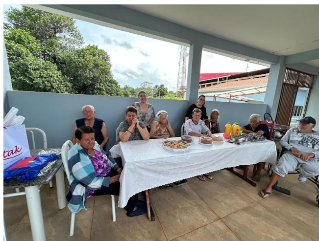
Centro Espírita André Luiz – FESTA DE NATAL – 13/12/2025