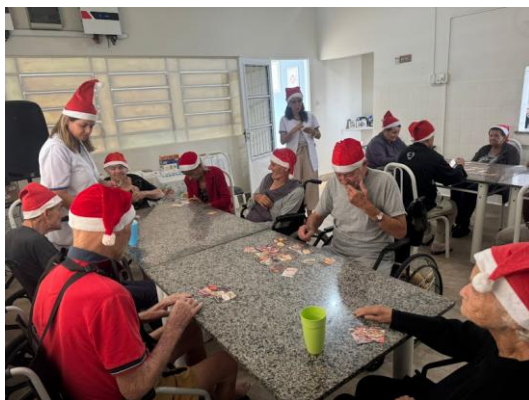
16/12/2025 – acompanhamento psico