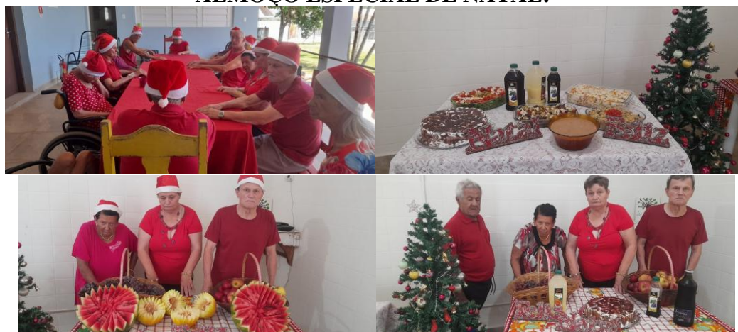
Realizado em 25/12/2025