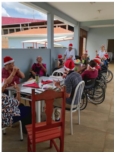
03/12/2025 – acompanhamento psico