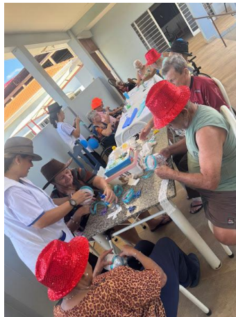
24/12/2025– acompanhamento psico