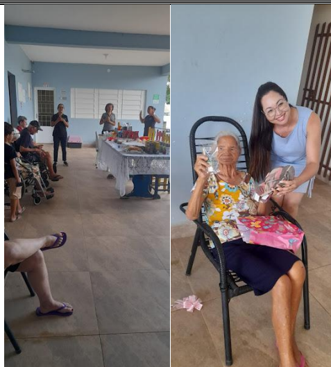
M.M.V. – FESTA DE NATAL - 27/12/2025