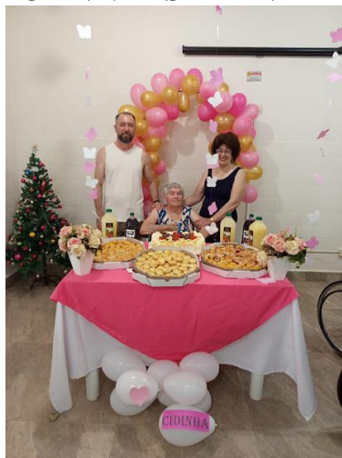
Realizado em 10/12/2025