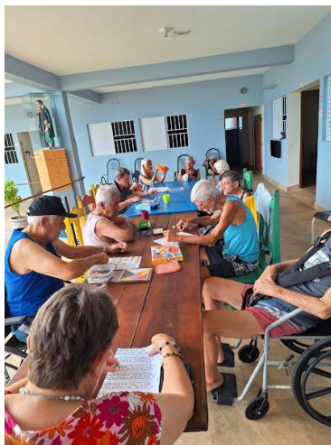
29/12/2025 – feito apenas pela psico