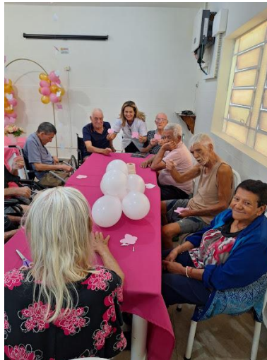
10/12/2025 – acompanhamento psico