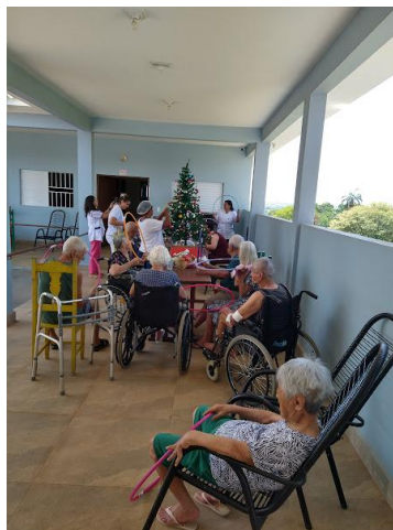
02/12/2025 – acompanhamento psico