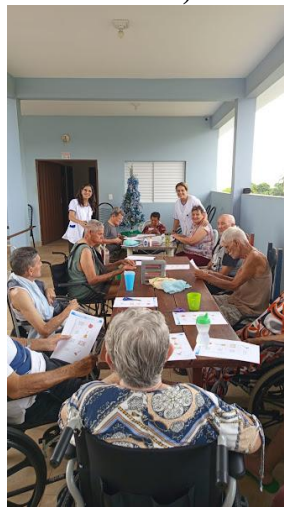
01/12/2025 – acompanhamento psico