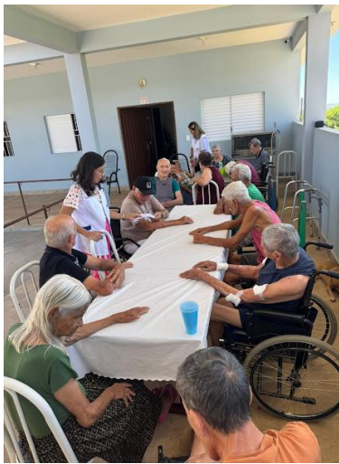
26/12/2025– acompanhamento psico