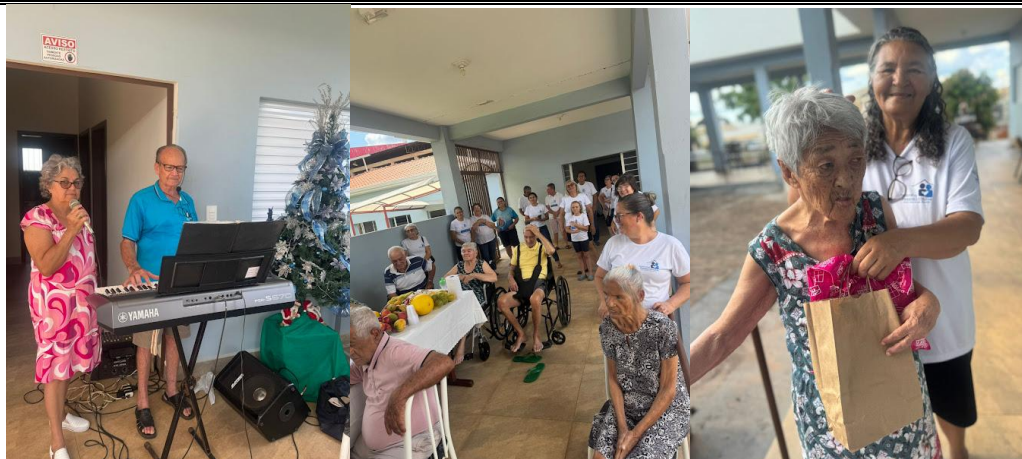
Pastoral da Pessoa Idosa – FESTA DE NATAL – 06/12/2025

ASSOCIAÇÃO LAR DOS IDOSOS DE ALVARES MACHADO Rua Campos Salles, nº 10 – CEP 19.160-011 - Fone (018) 99731-5127 e 99628-1094 Álvares Machado – SPCNPJ 51.400.000/0001-10 E-mail: lardosidososdam@yahoo.com.br