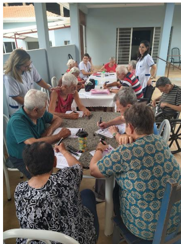
08/12/2025 – acompanhamento psico