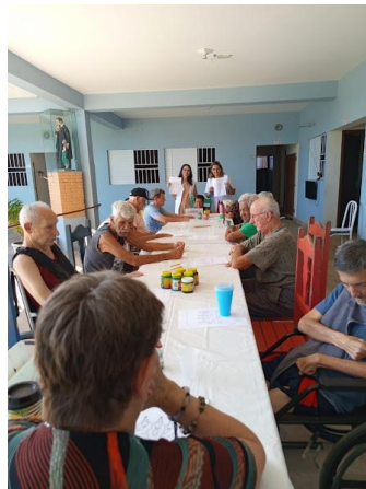
31/12/2025 – acompanhamento psico