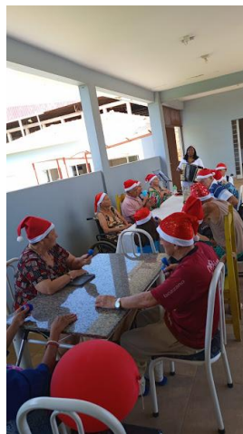
06/12/2025 – acompanhamento psico