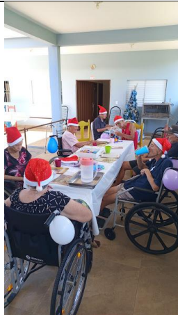
04/12/2025– acompanhamento psico