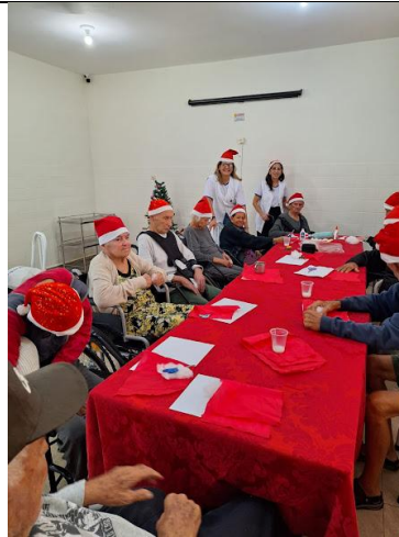
09/12/2025 – acompanhamento psico