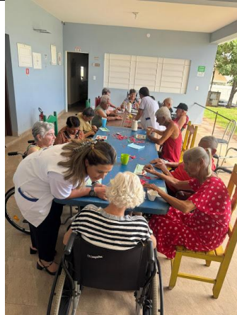
30/12/2025 – acompanhamento psico