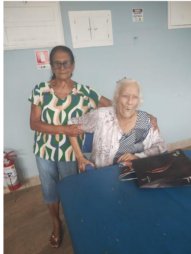
Familiares da Linda