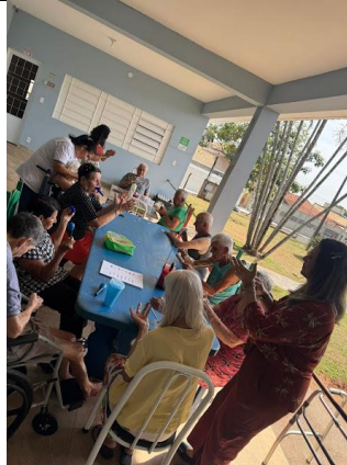
30/09/2025 – acompanhamento da Psico.