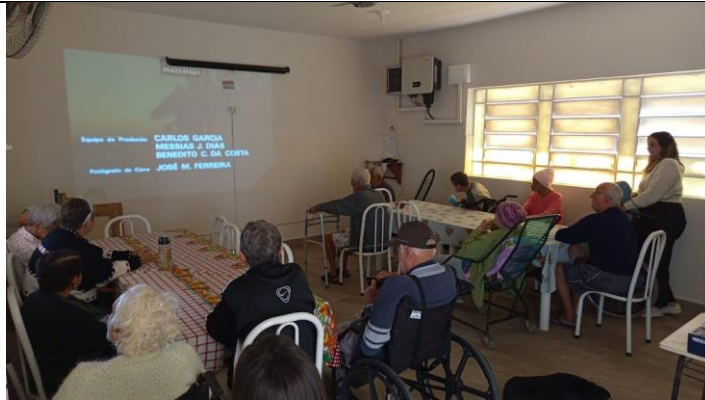
20/10/2025 – acompanhamento psico