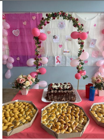
29/10/2025 – idosos auxiliaram na elaboração e decoração para a festa do aniversariante.