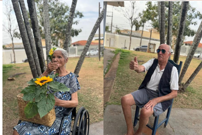
Realizada em 02/10/2025