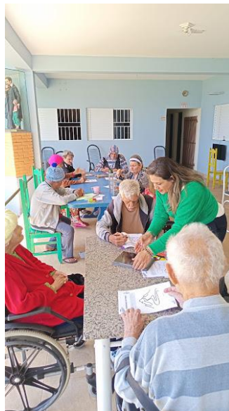
21/10/2025 – acompanhamento psico