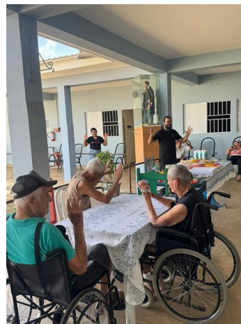
M.M.V. - realizada em 25/10/2025