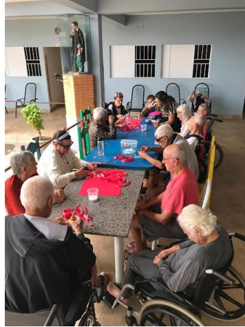
14/10/2025 – acompanhamento psico