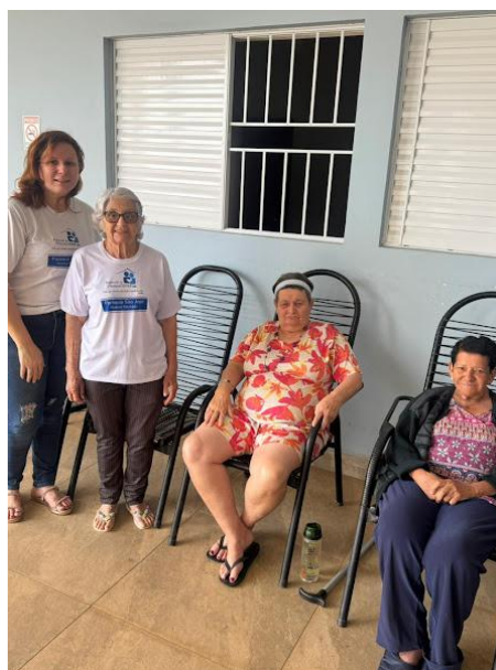
Pastoral da Pessoa Idosa – 25/10/2025