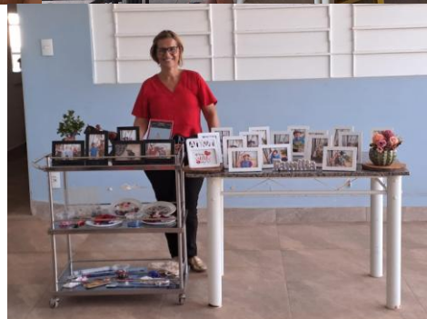
Realizada em 16/10/2025