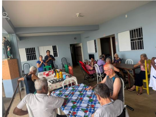
Diretores da ilpi – 05/10/2025