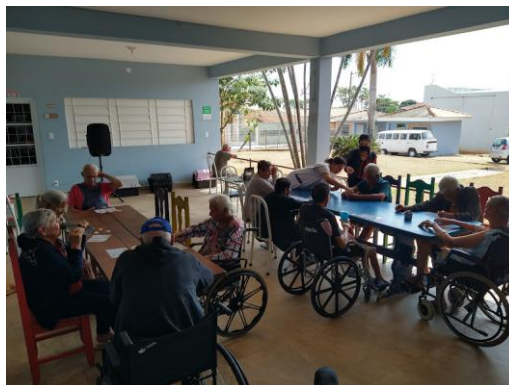
Bingo adaptado - 10/10/2025