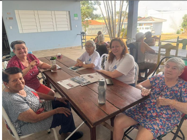
Pastoral da Pessoa Idosa – 20/09/2025