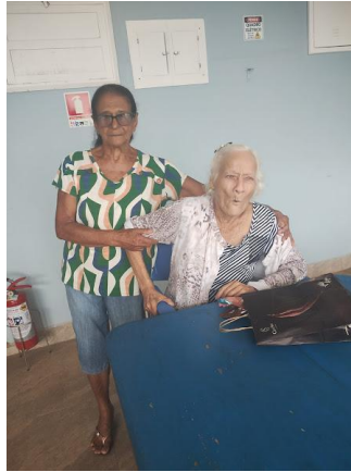
Familiares da Linda