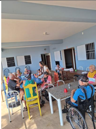
08/09/2025 – acompanhamento da Psico.