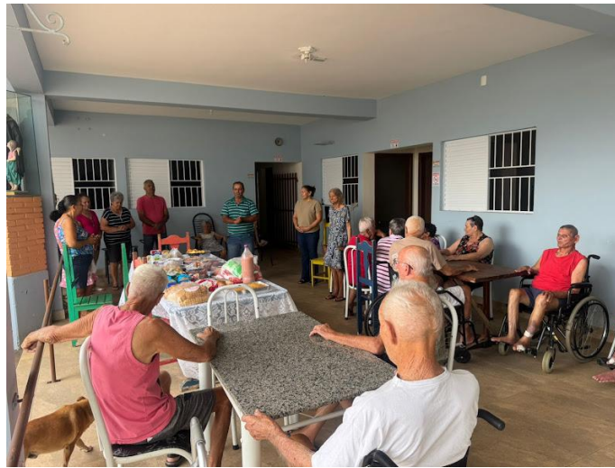
Setor Santa Bárbara – 21/09/2025