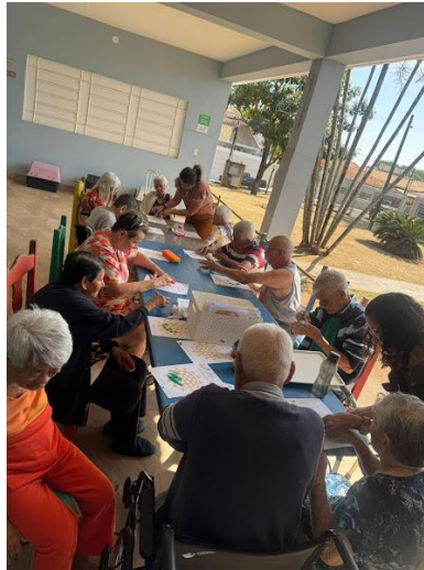
15/09/2025 – acompanhamento da Psico