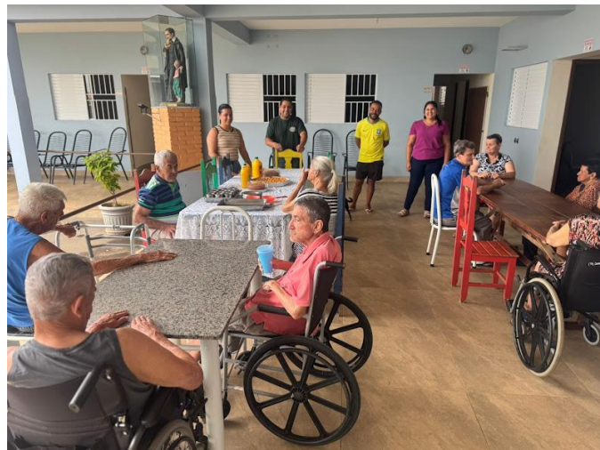
Setor São Sebastião – 28/09/2025