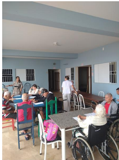
09/09/2025 – acompanhamento da Psico.