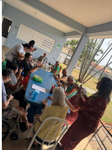
30/09/2025 – acompanhamento da Psico.