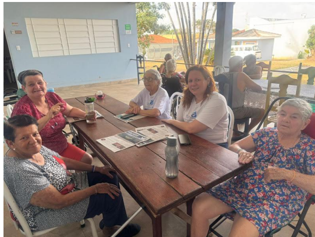
Pastoral da Pessoa Idosa – 20/09/2025