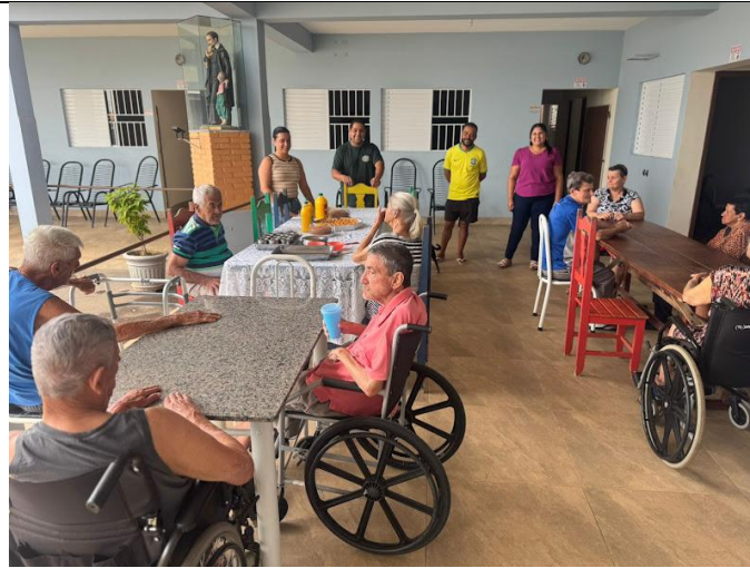
Setor São Sebastião – 28/09/2025