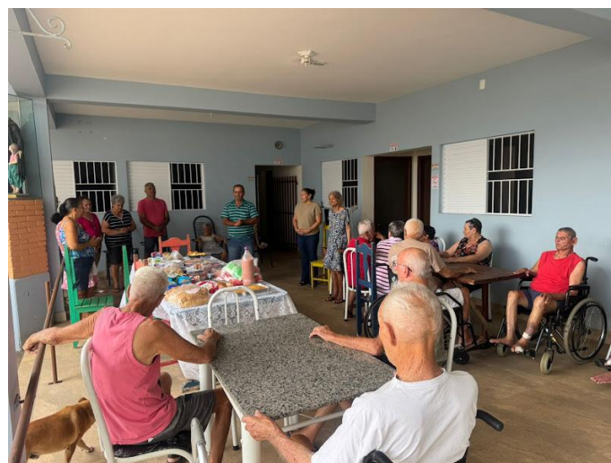
Setor Santa Bárbara – 21/09/2025