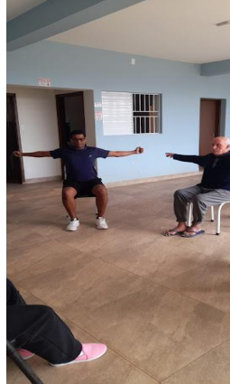
Retomada das atividades em 02/09/2025