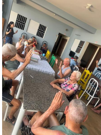
M.M.V. - realizada em 20/09/2025