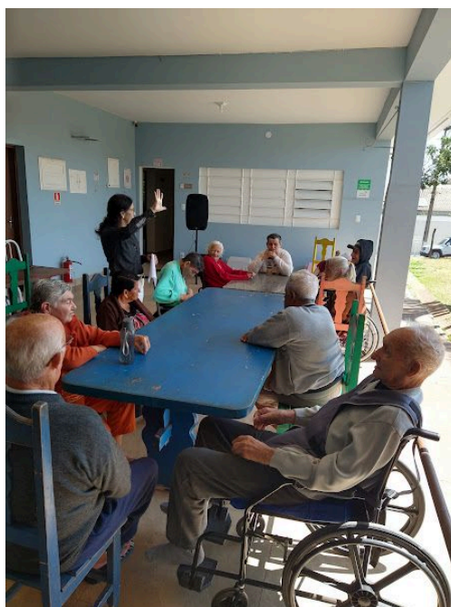
Equipamentos de áudio – utilizado durante mais um grupo de convivência com os idosos – 26/09/2025