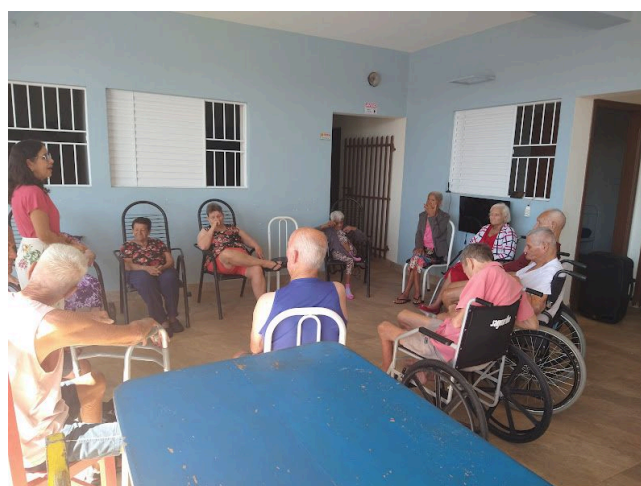
Equipamento de áudio usado durante o grupo de convivência com os idosos – 11/09/2025