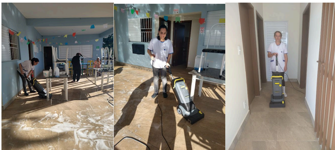
Utilização diária dos equipamentos na lavagem e secagem do piso nas instalações da ilpi.