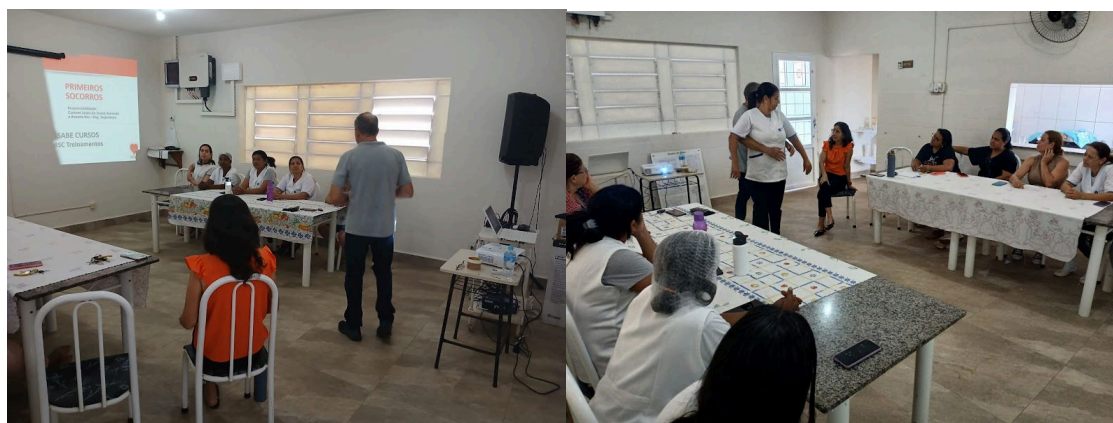
Equipamentos de áudio visual – utilizados durante curso de treinamento – 03/09/2025