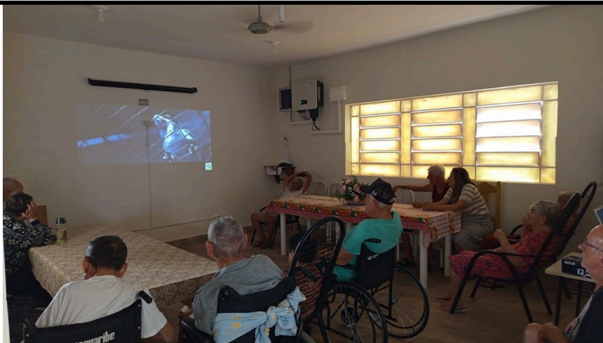
Equipamentos de áudio visual – utilizado durante uma sessão de cinema com os idosos na ilpi – Filme RIO – 08/10/2025