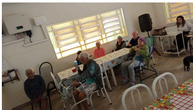
Equipamentos de áudio visual – utilizado durante uma sessão de cinema com os idosos na ilpi – Filme O JECA MACUMBEIRO (MAZZAROPI) – 20/10/2025

E propiciaram a execução, de acordo com o previsto no Plano de Trabalho, de tais atividades: