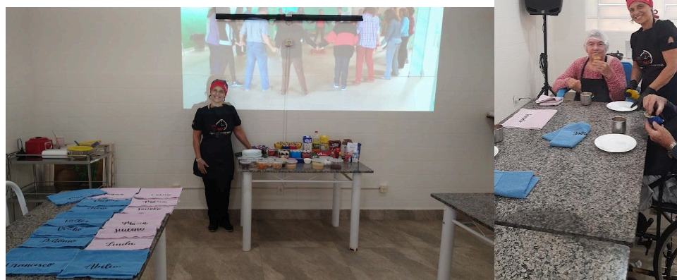
Utilização dos equipamentos de áudio visual durante a oficina de culinária – 19/08/2025