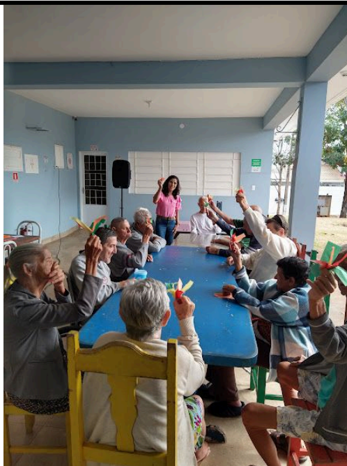
Equipamentos de áudio – utilizado durante mais um grupo de convivência com os idosos – 19/09/2025