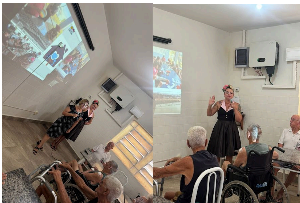
Equipamentos de áudio visual – utilizado durante a oficina retrô – 02/10/2025