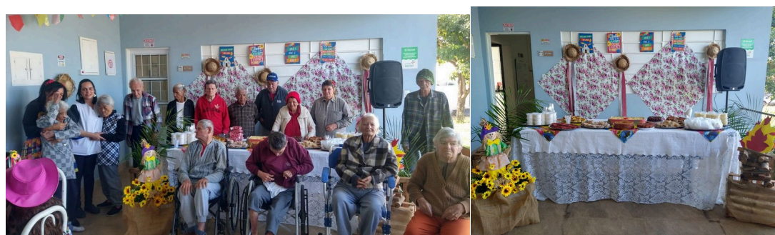
Equipamento de áudio - utilizado durante a Festa Junina