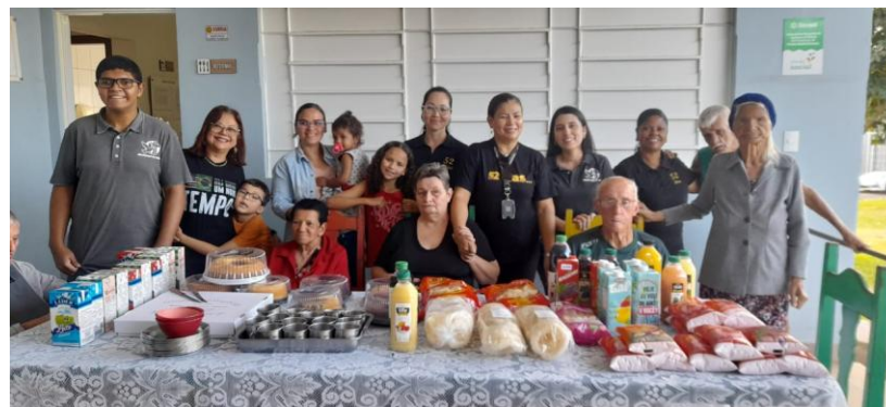
M.M.V. - realizada em 26/07/2025