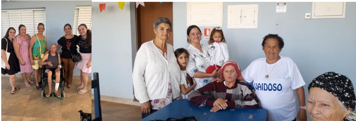
Familiares do Miguel