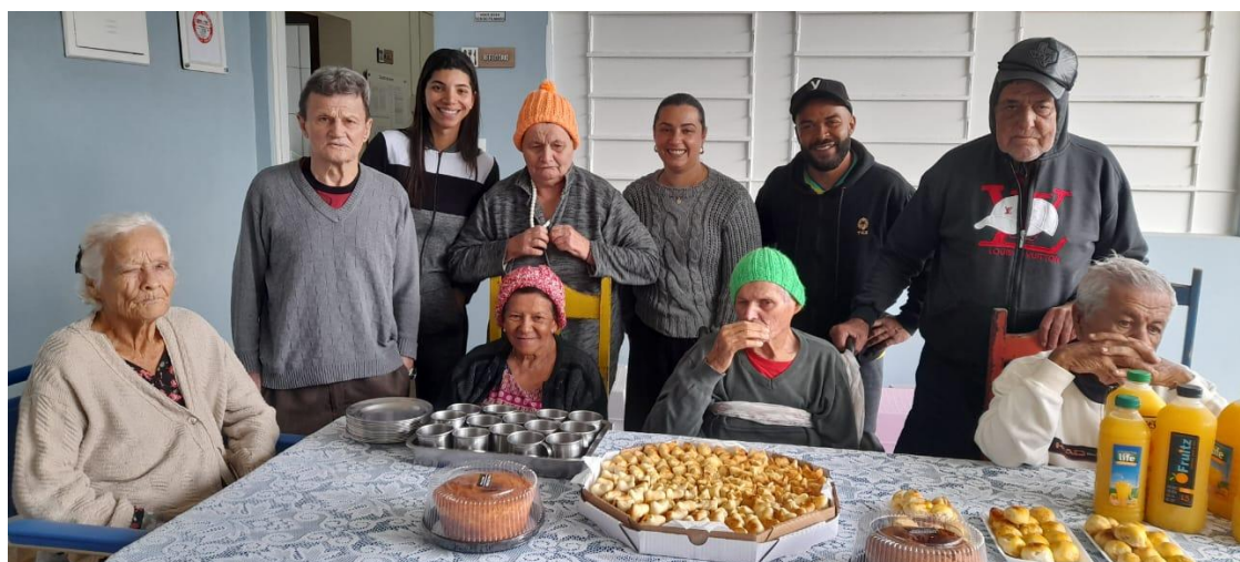
Visita do pessoal do Setor São Sebastião