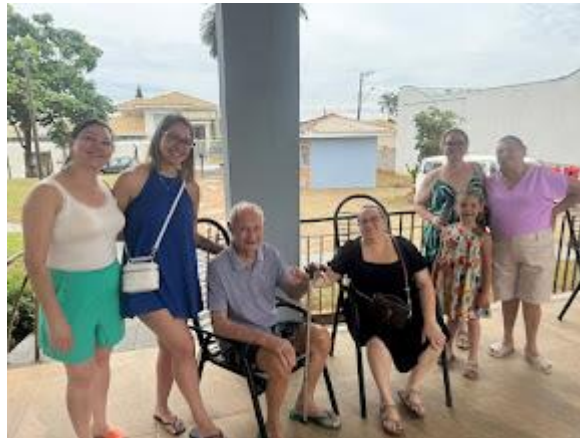
Família do Ovídio