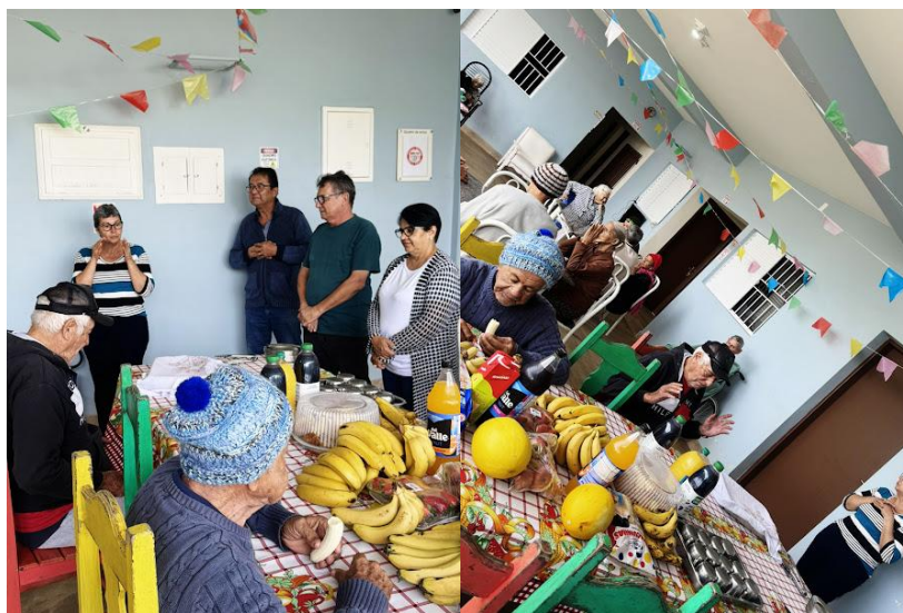
Visita das esposas dos diretores da ilpi