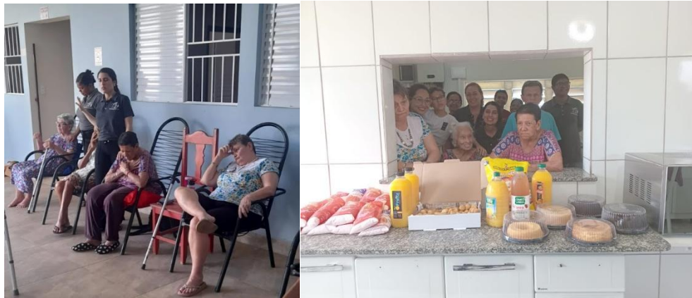
Ministério Mudança de Vida de Pres. Prudente – M.M.V (mensalmente)