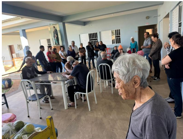
Setor Santa Bárbara