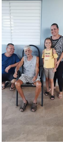
Família do Aécio