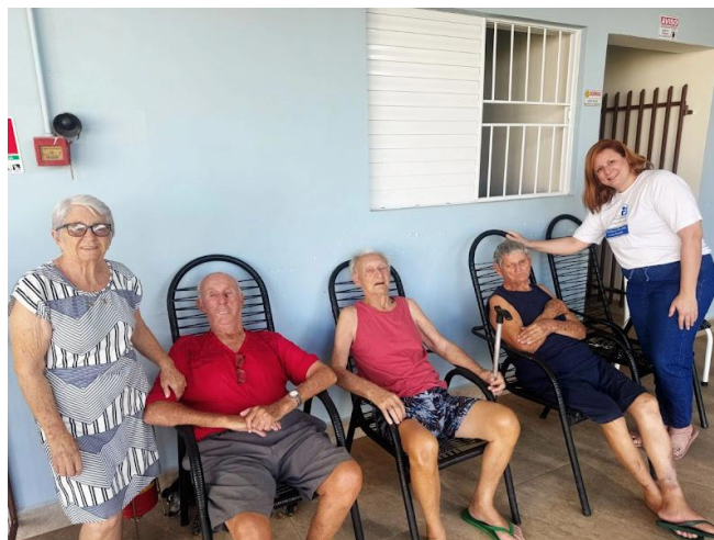
Visita Pastoral da Pessoa Idosa de Alv. Machado (mensalmente)