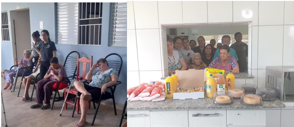
Realizada em 25/01/2025