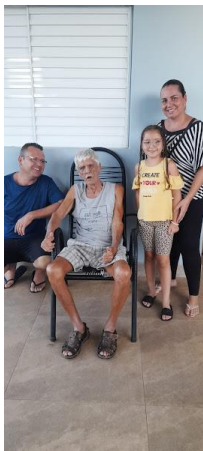
Família do Aécio – 05/01/2025