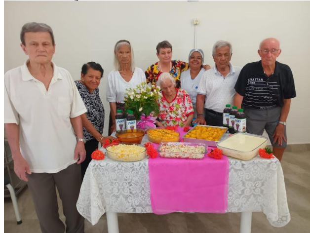
Realizado em 01/01/2025