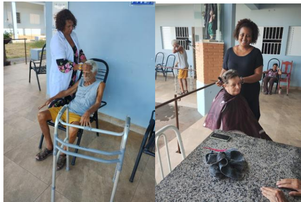
Realizado em 21/01/2025