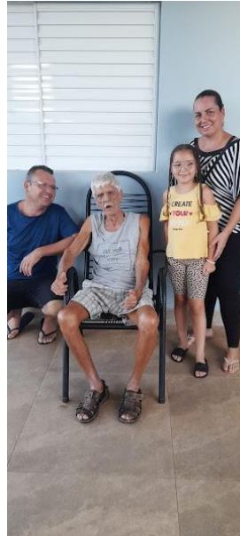
Família do Aécio – 05/01/2025