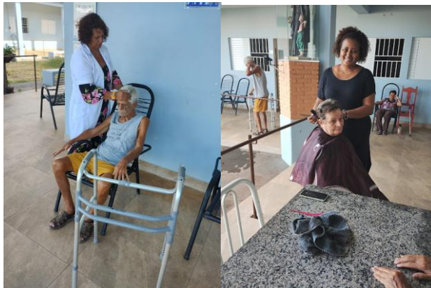
Realizado em 21/01/2025