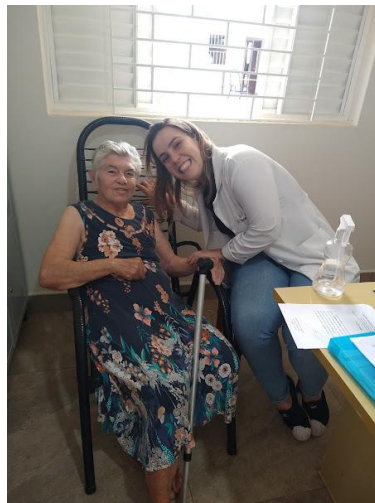
Realizado em 03/12/2024