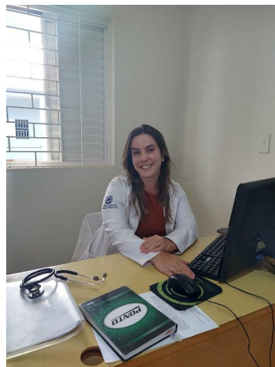
Realizado em 10/12/2024