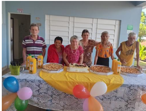
Realizada em 18/12/2024