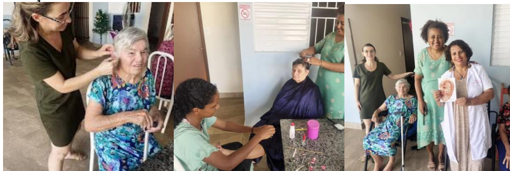
Realizada em 01/12/2024