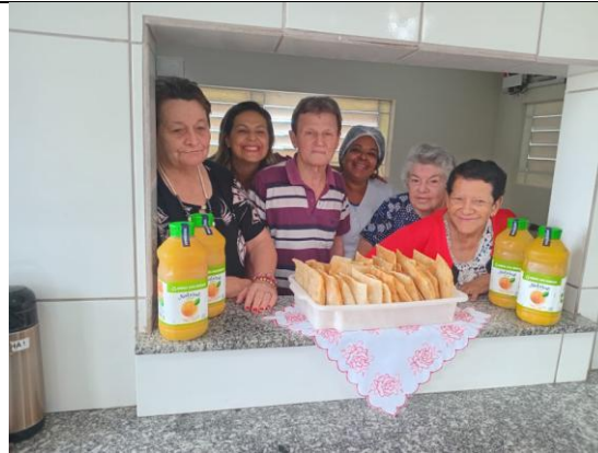
Realizada em 20/12/2024