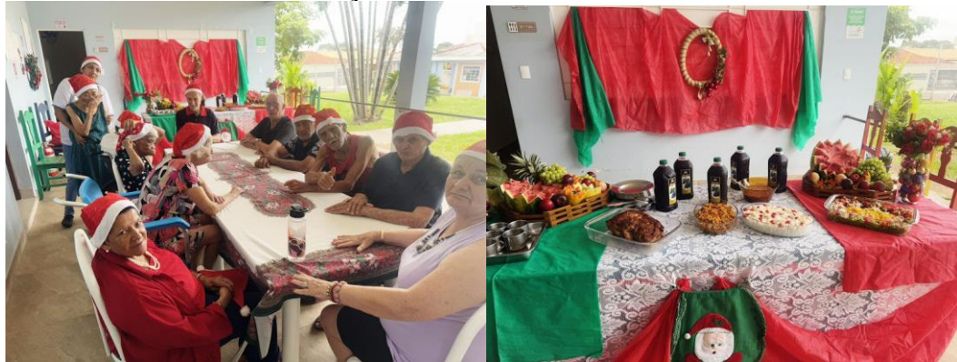
Realizado em 25/12/2024

Alvares Machado, 31 de Dezembro de 2024.