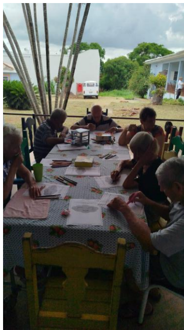
Realizada em 02/12/2024