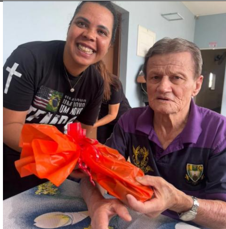
Realizado em 21/12/2024