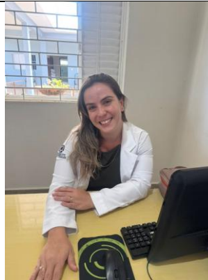
Realizado em 17/12/2024