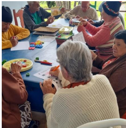
Realizada em 12/08/2024