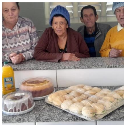
Trazido pelas damas do Rotary Clube de Alvares Machado – 10/08/2024