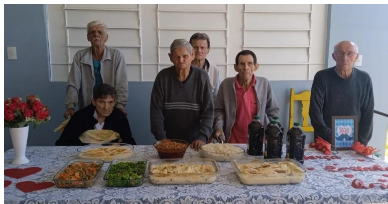
Realizado em 11/08/2024