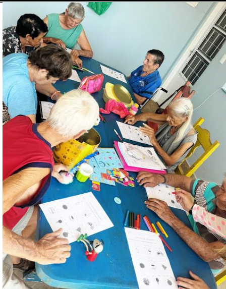
Realizado em 19/08/2024