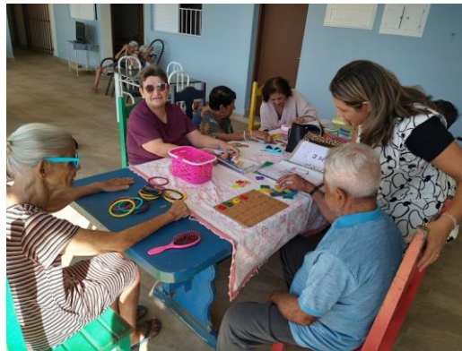
Realizado em 24/06/2024