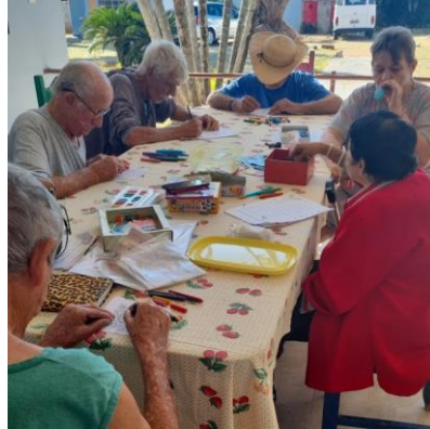
Realizada em 10/06/2024