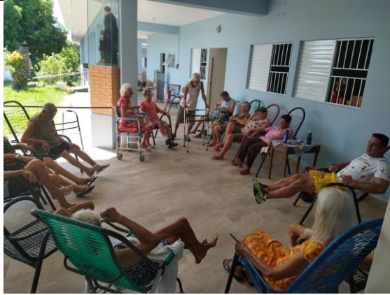
Realizado em 21/03/2024