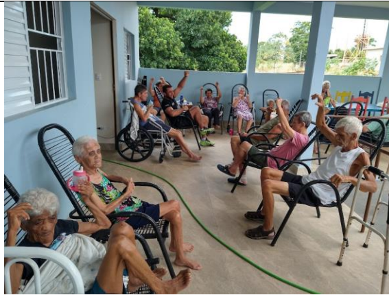
Realizado em 07/03/2024