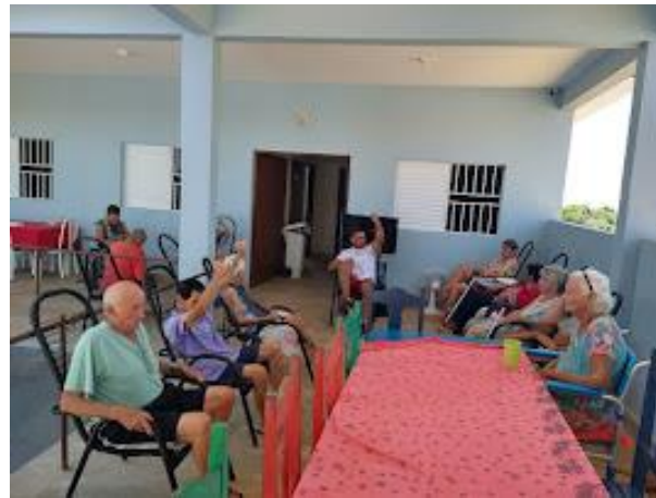
Realizado em 12/03/2024