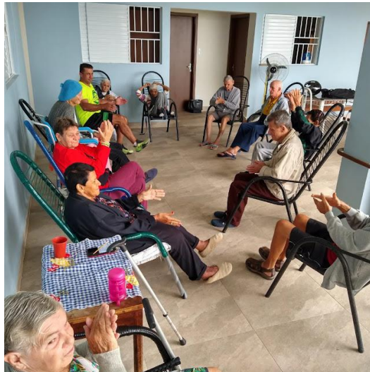
Realizado em 26/03/2024