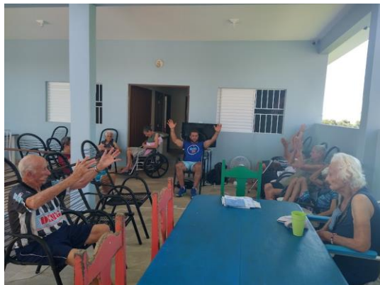
Realizada em 05/03/2024