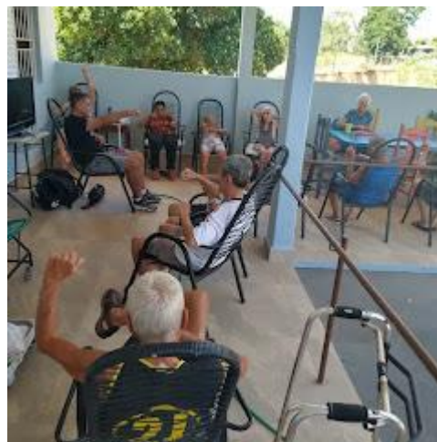
Realizado em 14/03/2024