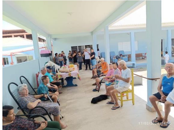
Ministério Mudança de Vida – 17/02/2024