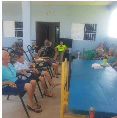
Realizado em 29/02/2024