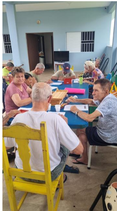
Realizado em 19/02/2024