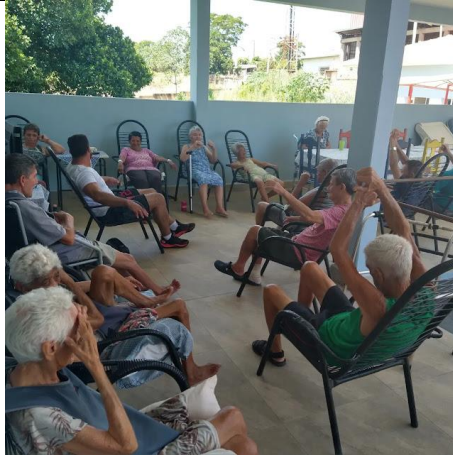
Realizado em 27/02/2024