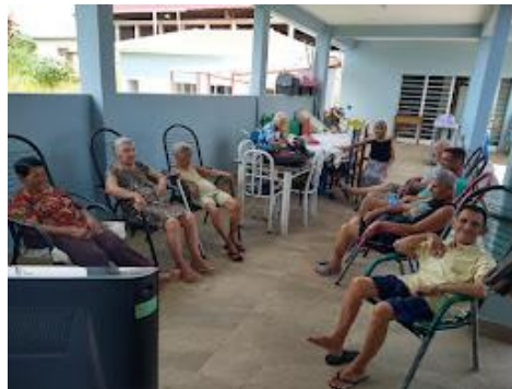
Realizado em 06/02/2024