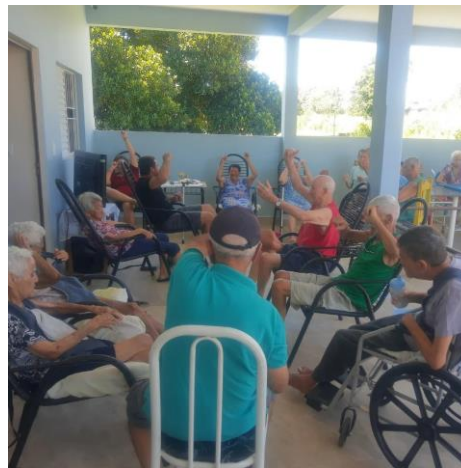
Realizada em 01/02/2024