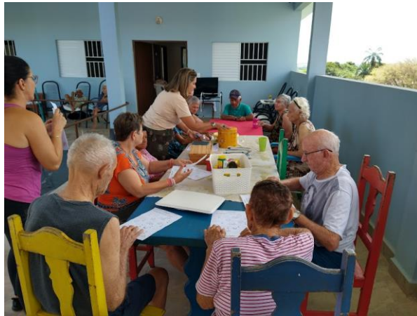
Realizada em 12/02/2024