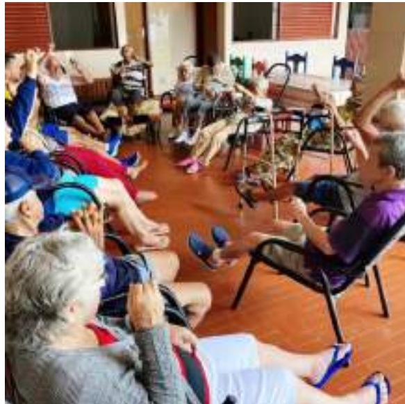
Atividade física com o educador – NASF