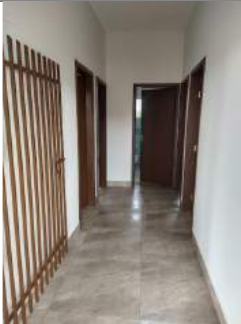
Adequações nas alas da entidade – troca de pisos, janelas e portas