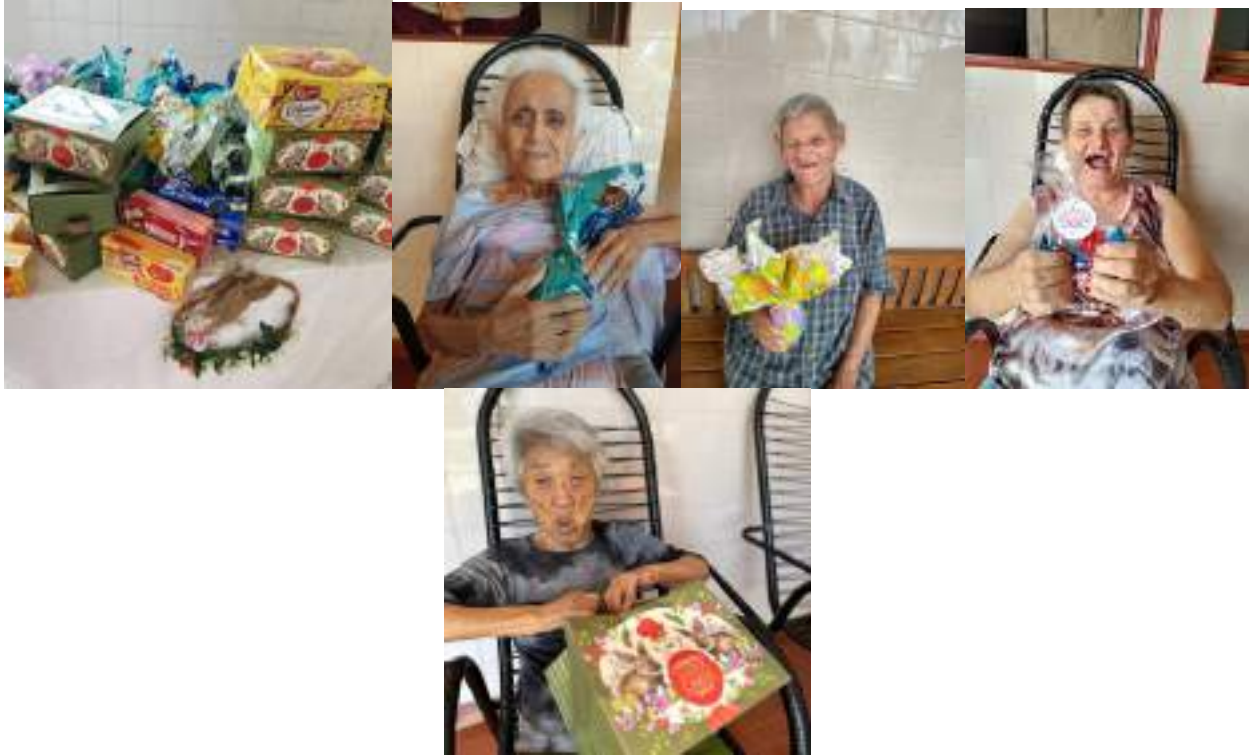
Campanha Adoce um idoso nesta Pascoa – abril/2023