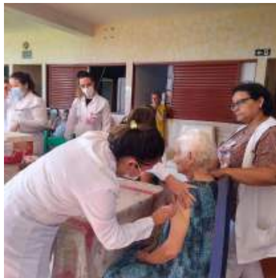
Vacinação – idosos