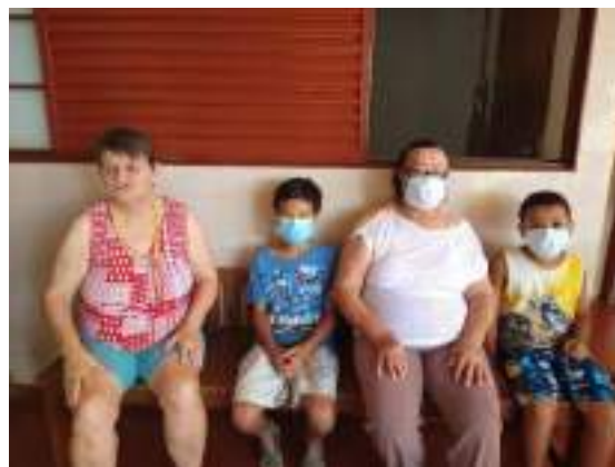
Visita de familiares a seu idoso na entidade