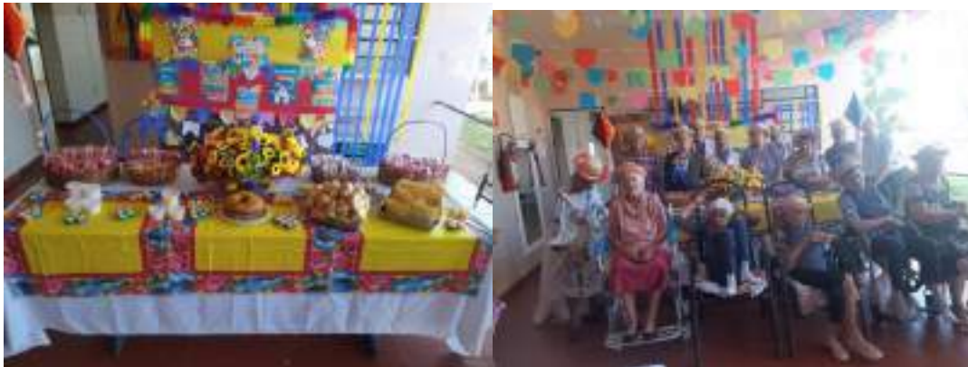
Festa Julina – realizada em 27/07/2023