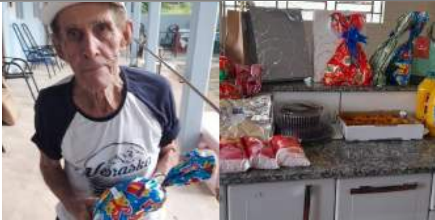
Festa de Natal – Ministério Mudança de Vida (P. Prudente) - realizada em 16/12/2023