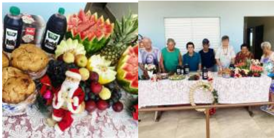
Almoço de Natal - realizado em 25/12/2023