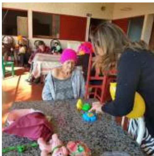
Atividades lúdicas com a pedagoga voluntária