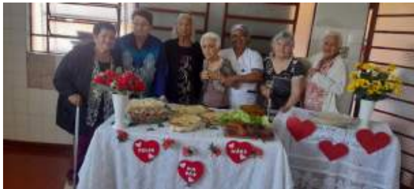
Almoço especial – DIA DAS MÃES 2023 – maio/2023