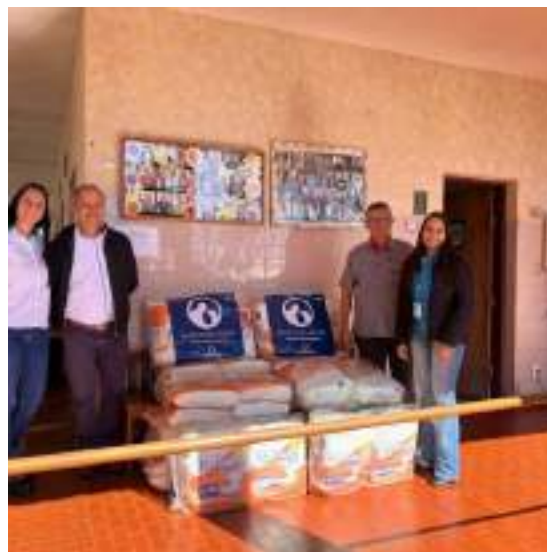
Recebimento de doação de fraldas – Projeto Nutrindo Amor – Adimax – 14/07/2023