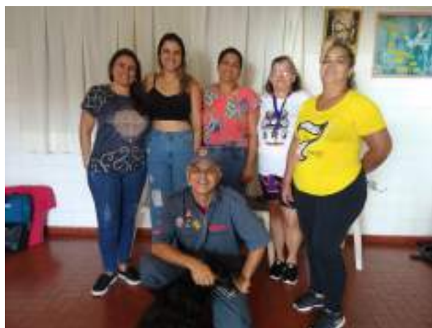
Capacitação/treinamento 1º Socorros – Turma II – fevereiro/2023