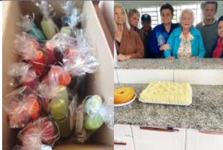
Café DIA DAS MÃES – Rotary clube de Alvares Machado – maio/2023

ASSOCIAÇÃO LAR DOS IDOSOS DE ALVARES MACHADO Rua Campos Salles, nº 10 – CEP 19.160-000 - Fone (018) 3273 - 1542 Álvares Machado – SPCNPJ 51.400.000/0001-10 E-mail: lardosidososdam@yahoo.com.br