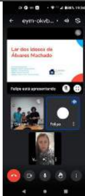
Apresentação on-line (google meet), 12/06/2023, do trabalho dos alunos do curso de marketing - Toledo sobre a entidade (PROJETO IDEIA LAB).