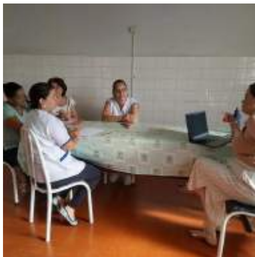
Curso de capacitação para funcionários – Programa Transforme 2 – Turma I – 14/11/2023