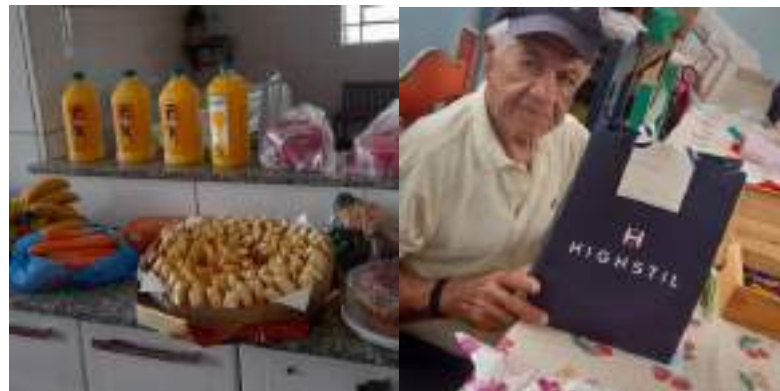
Festa de Natal – Pastoral da Pessoa Idosa - realizada em 02/12/2023