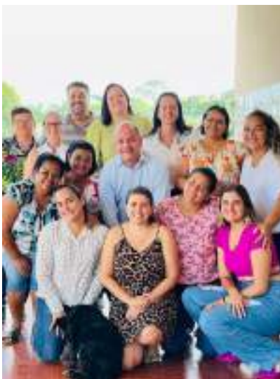
Finalização do curso – Gestão de Equipes – Turma I e II – março/2023