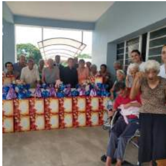
Doações de kits de cestas básicas e itens de higiene – AMATRA XV – realizada em 23/12/2023

ASSOCIAÇÃO LAR DOS IDOSOS DE ALVARES MACHADO Rua Campos Salles, nº 10 – CEP 19.160-000 - Fone (018) 3273 - 1542 Álvares Machado – SPCNPJ 51.400.000/0001-10 E-mail: lardosidososdam@yahoo.com.br