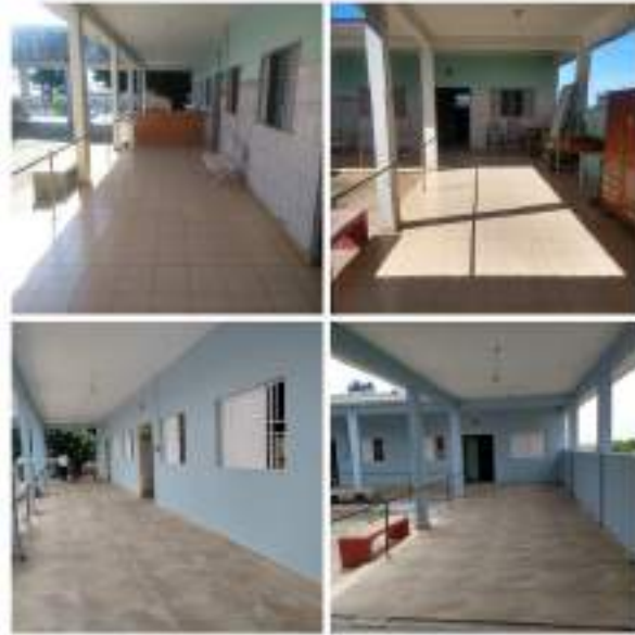
Adequações nas alas da entidade – troca de pisos, janelas e portas