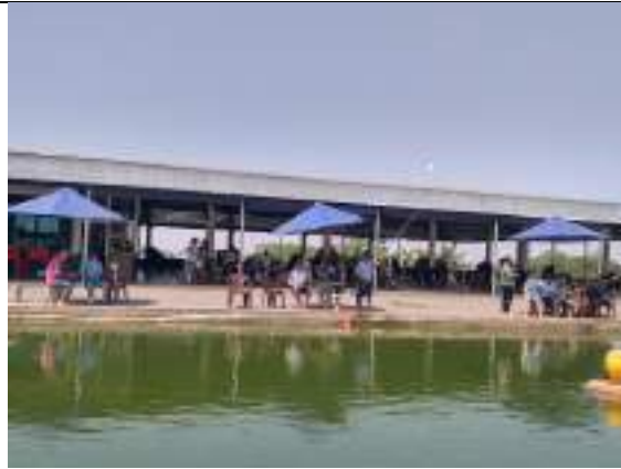
Passeio no pesqueiro Sugui moto – DIA DO IDOSO – setembro/2023