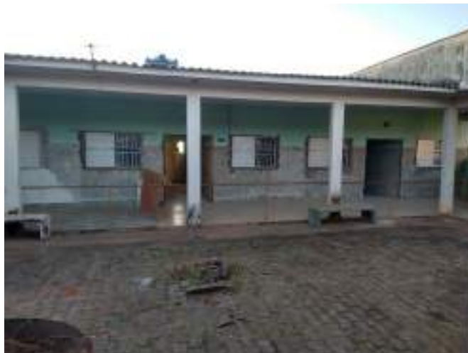
Adequações nas alas da entidade – troca de pisos, janelas e portas