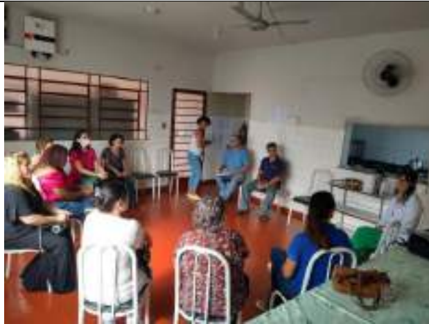
Reunião com familiares e médica voluntária da ilpi – abril/2023