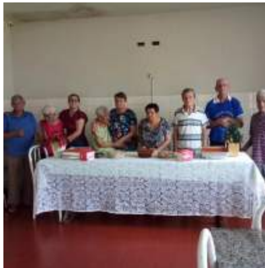
Almoço de Ano Novo 2023