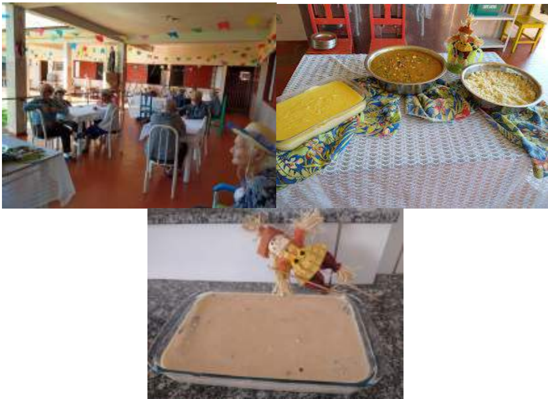
Comemoração Junina – junho/2023