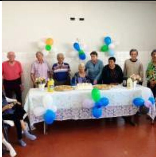
Comemoração do aniversariante do mês