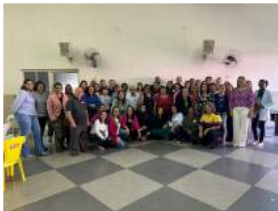
Participação da 13ª Conferência Municipal de Assistência Social - realizada em 24/05/2023