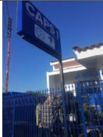
Presença na inauguração do CAPS-I de Alv. Machado realizado em 20/07/2023

ASSOCIAÇÃO LAR DOS IDOSOS DE ALVARES MACHADO Rua Campos Salles, nº 10 – CEP 19.160-000 - Fone (018) 3273 - 1542 Álvares Machado – SPCNPJ 51.400.000/0001-10 E-mail: lardosidososdam@yahoo.com.br