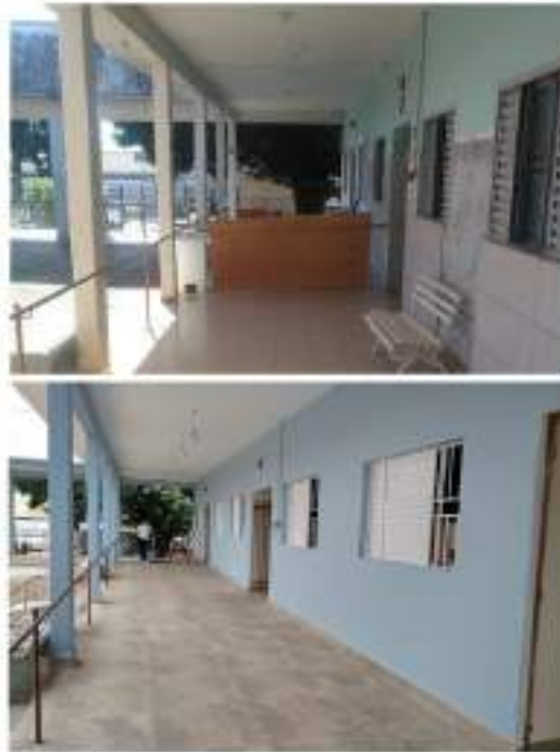
Adequações nas alas da entidade – troca de pisos, janelas e portas