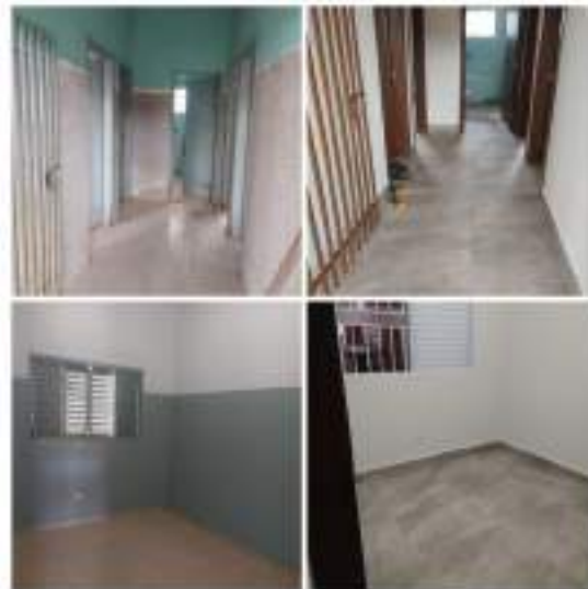
Adequações nas alas da entidade – troca de pisos, janelas e portas