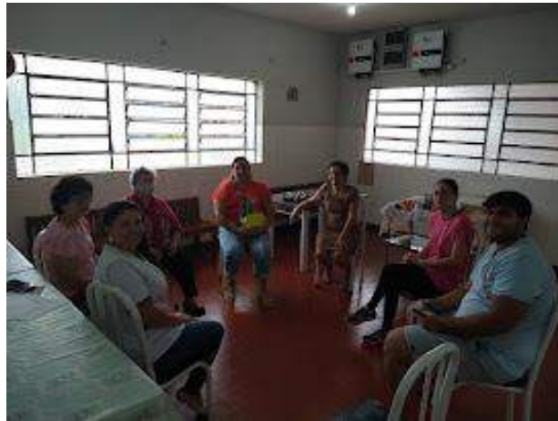
Reunião das famílias – 2ª de 2023 – novembro/2023