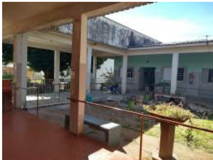
Adequações nas alas da entidade – troca de pisos, janelas e portas