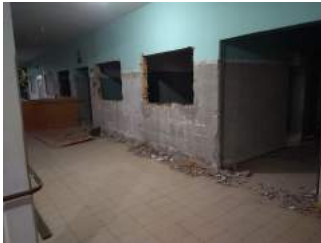
Adequações nas alas da entidade – troca de pisos, janelas e portas