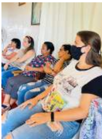
Capacitação – Gestão de equipe – Turma I – fevereiro/2023