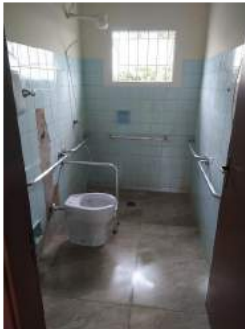
Adequações nas alas da entidade – troca de pisos, janelas e portas