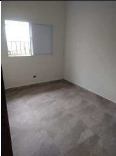
Adequações nas alas da entidade – troca de pisos, janelas e portas

ASSOCIAÇÃO LAR DOS IDOSOS DE ALVARES MACHADO Rua Campos Salles, nº 10 – CEP 19.160-000 - Fone (018) 3273 - 1542 Álvares Machado – SPCNPJ 51.400.000/0001-10 E-mail: lardosidososdam@yahoo.com.br