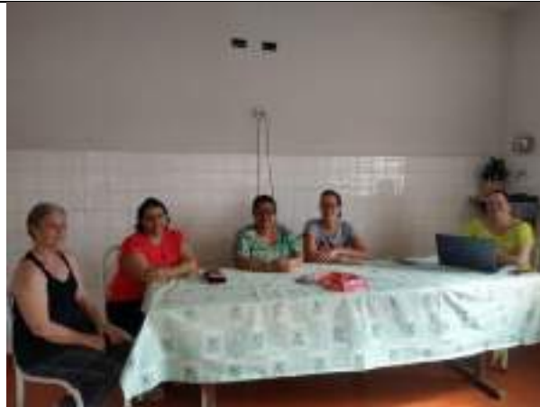
Curso de capacitação para funcionários – Programa Transforme 2 – Turma II – 21/11/2023