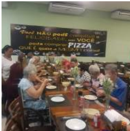
Passeio na Pizzaria Dom Marino – DIA DO IDOSO – outubro/2023