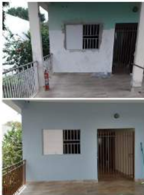
Adequações nas alas da entidade – troca de pisos, janelas e portas