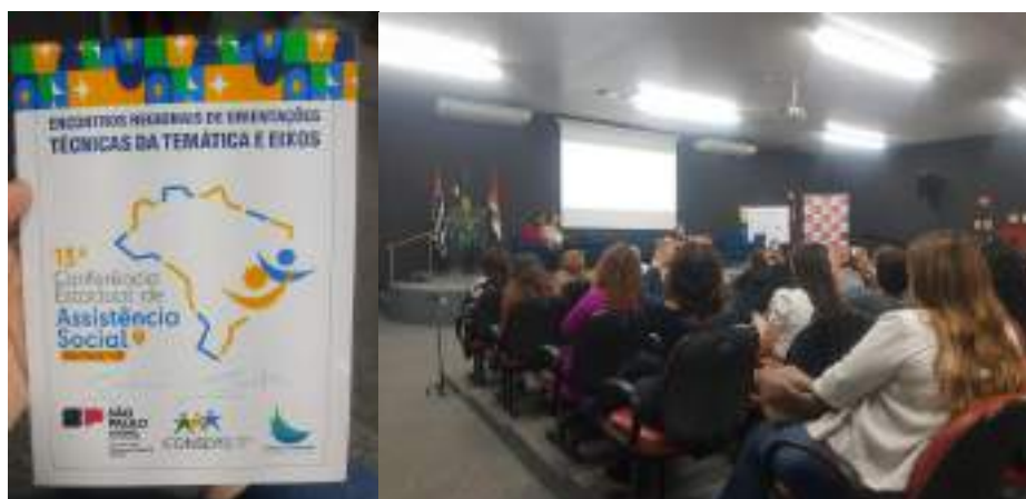
Participação no Encontro Regional de orientação Técnica da Conferência de Assistência Social – CONSEAS - realizada em 02/06/2023