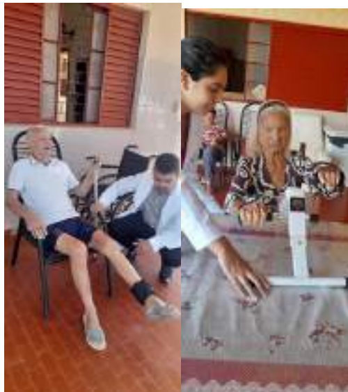
Sessões de fisioterapia (particular)