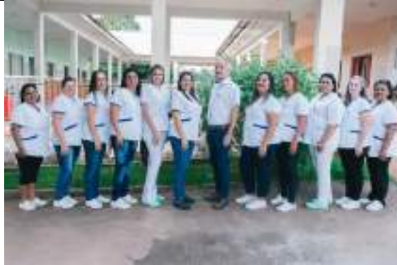
Aquisição de uniformes e sapatos de segurança – parceria SICREDI ALV. MACHADO – maio/2023

ASSOCIAÇÃO LAR DOS IDOSOS DE ALVARES MACHADO Rua Campos Salles, nº 10 – CEP 19.160-000 - Fone (018) 3273 - 1542 Álvares Machado – SPCNPJ 51.400.000/0001-10 E-mail: lardosidososdam@yahoo.com.br