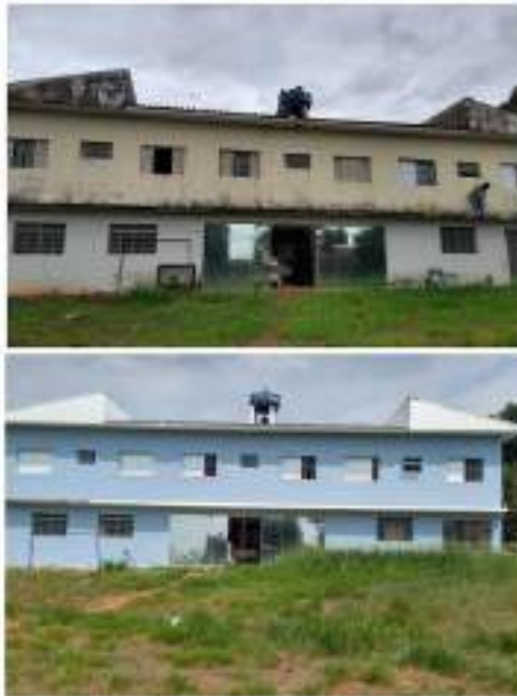
Adequações nas alas da entidade – troca de pisos, janelas e portas