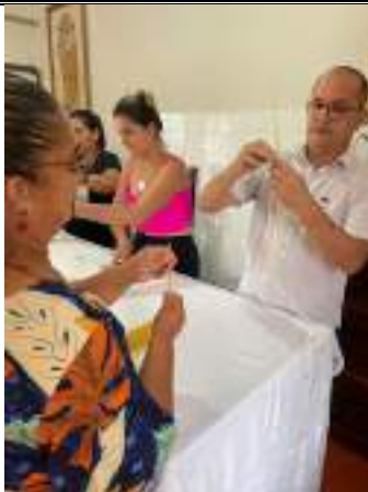
Capacitação – Gestão de equipe – Turma II – fevereiro/2023