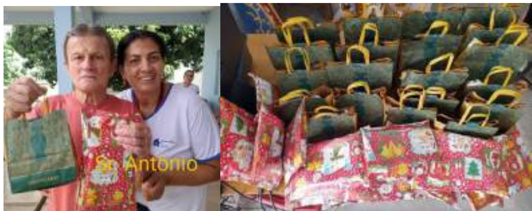
Doação – presentes natalinos – LOJA MAÇONICA 175 (P. PRUDENTE) – realizada em 25/12/2023

Álvares Machado, 31 de Dezembro de 2023.