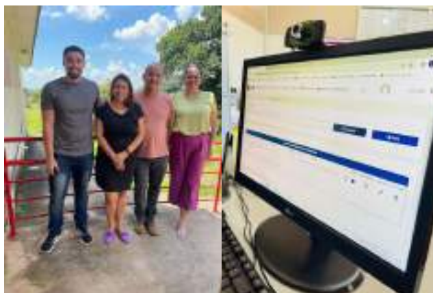
Aquisição e implantação do sistema de software – SOCIAGIL