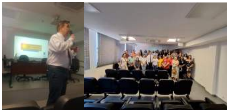
Participação na palestra da Secretaria da Fazenda sobre controle social, transparência e combate a corrupção - realizada em 13/12/2023