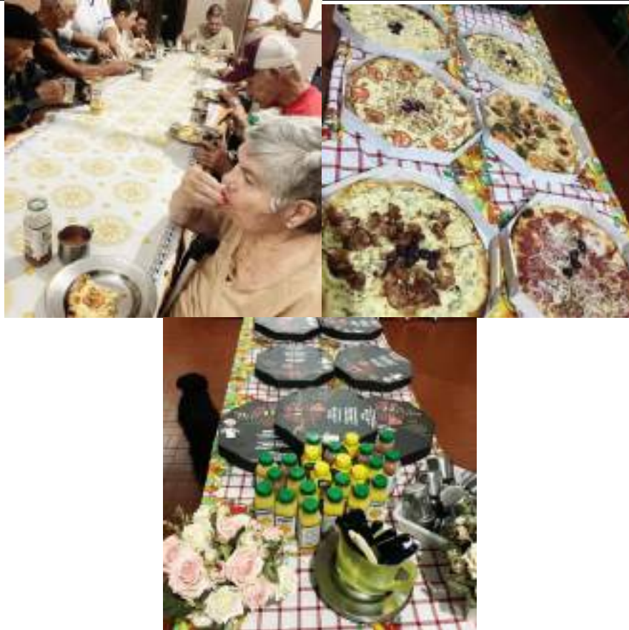
Noite da Pizza – Dom Marino – 10/07/2023