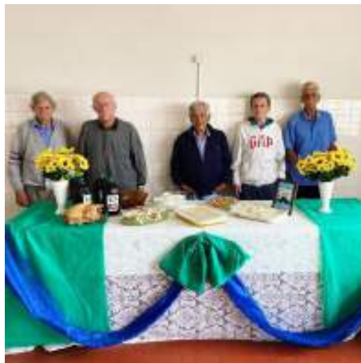
Almoço especial DIA DOS PAIS – agosto/2023