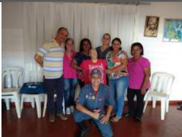
Capacitação/treinamento 1º Socorros – Turma I – fevereiro/2023