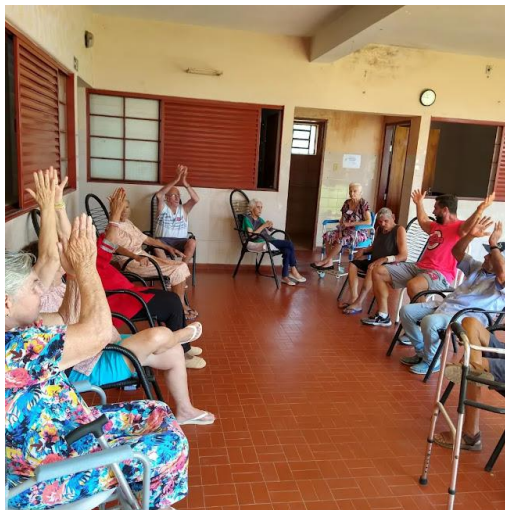
Realizada em 10/10/2023