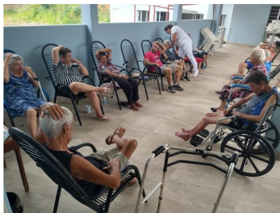
Realizada em 24/10/2023