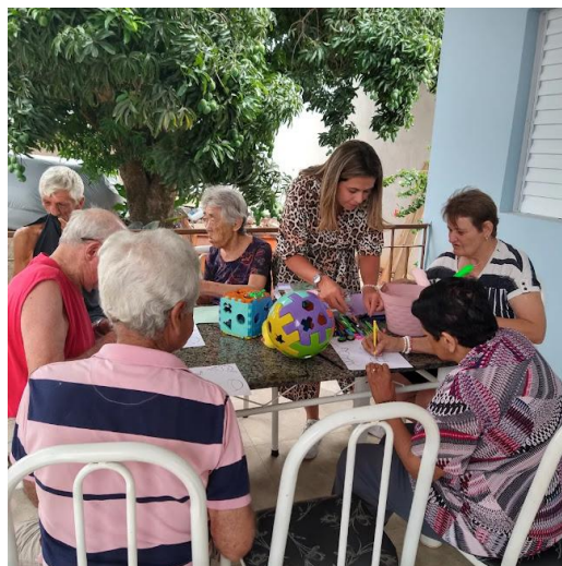
Realizada em 30/10/2023