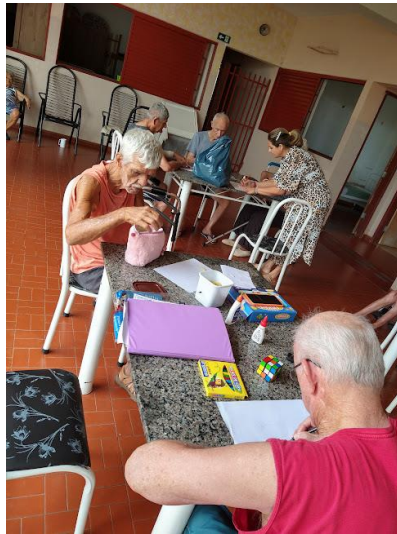
Realizada em 02/10/2023