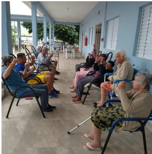
Realizada em 19/10/2023