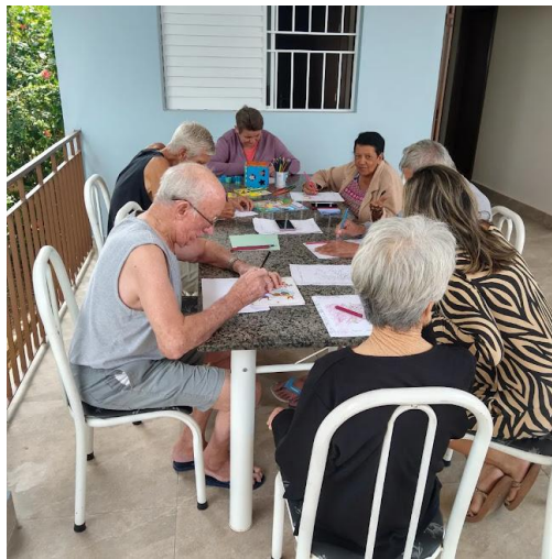
Realizada em 25/10/2023