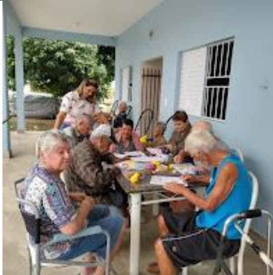
Realizada em 09/10/2023