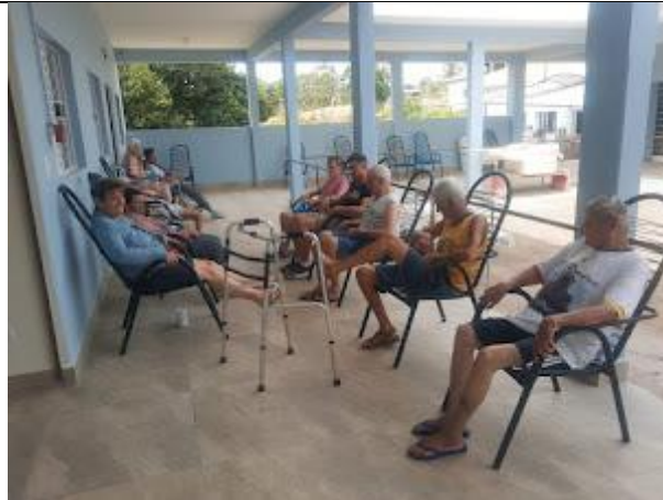
Realizada em 17/10/2023