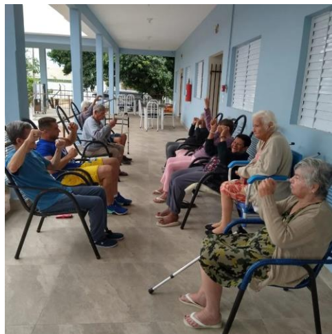
Realizada em 19/10/2023