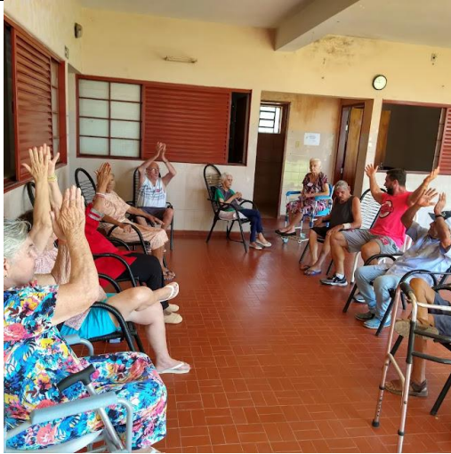
Realizada em 10/10/2023