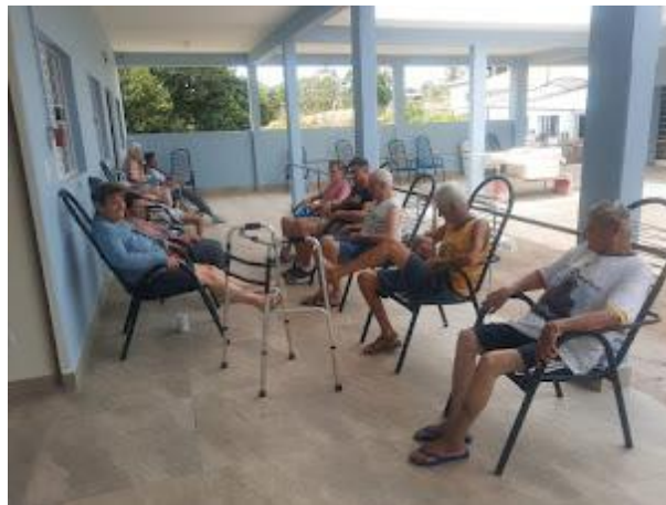
Realizada em 17/10/2023