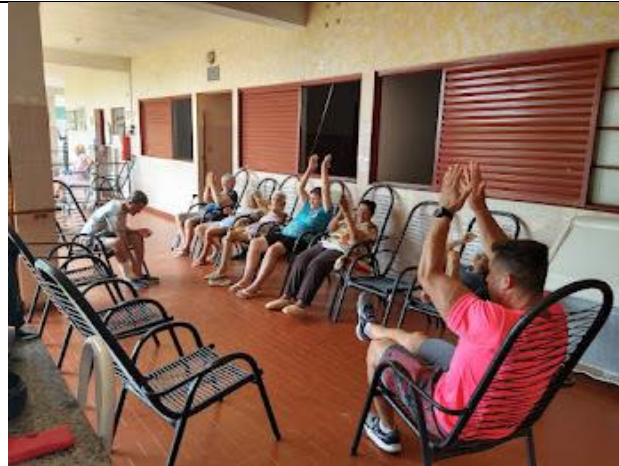
Realizada em 19/09/2023