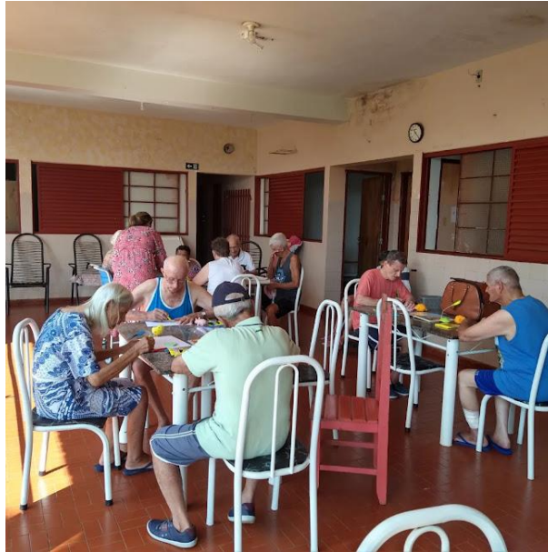
Realizada em 04/09/2023