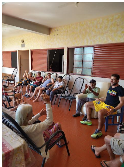
Realizada em 21/09/2023