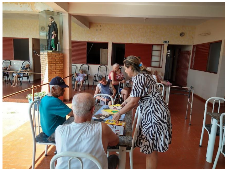
Realizado em 25/09/2023