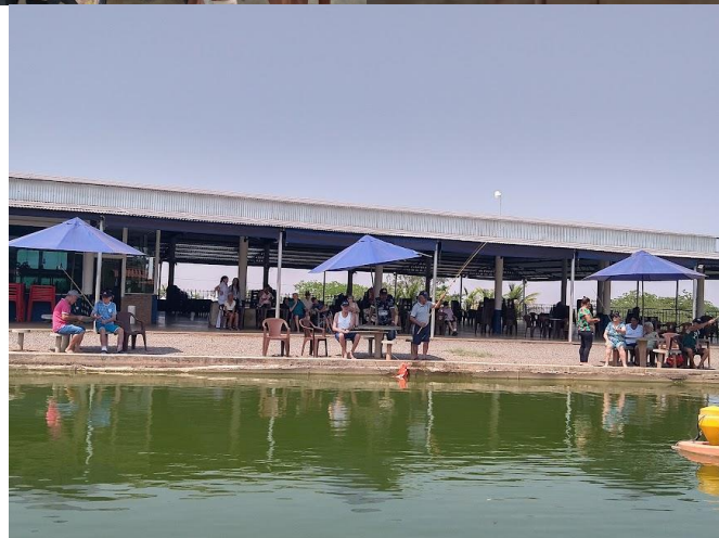
Realizado em 28/09/2023 – PESQUEIRO SUGUIMOTO