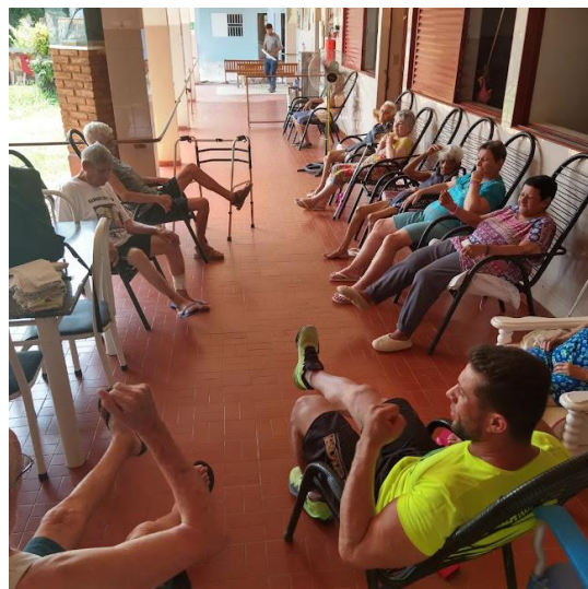
Realizada em 26/09/2023