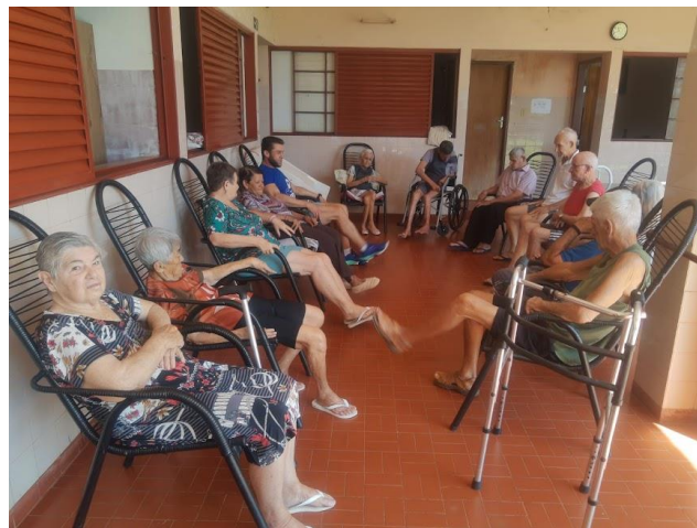
Realizada em 12/09/2023