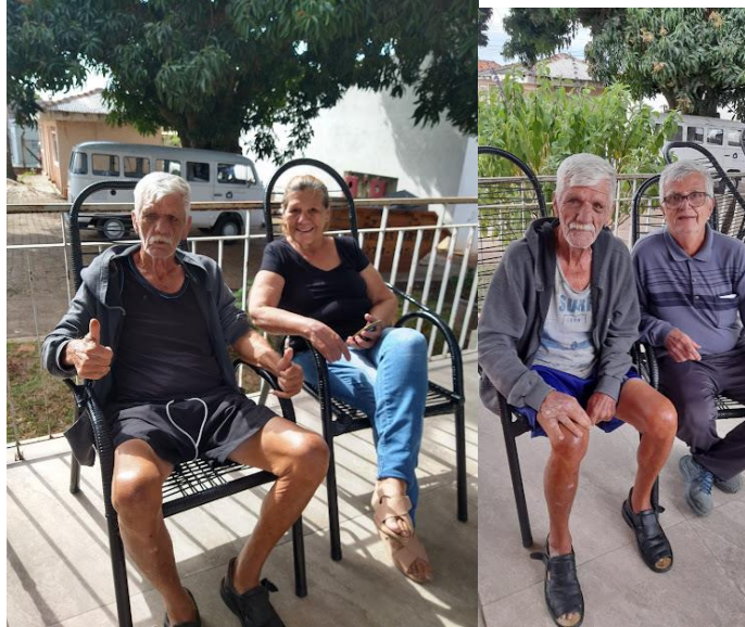
Família do AÉCIO