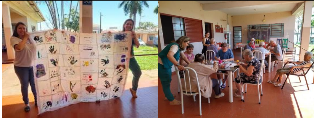
Realizada em 11/09/2023