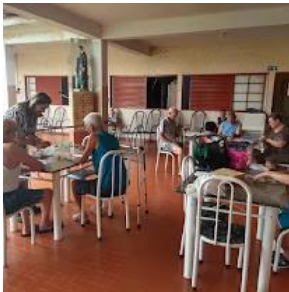
Realizado em 18/09/2023