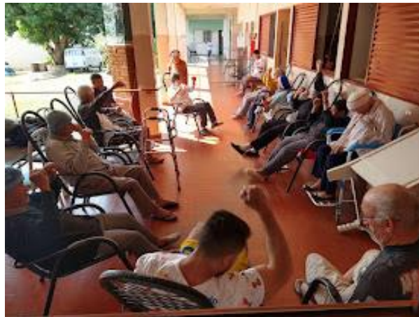
Realizada em 08/08/2023