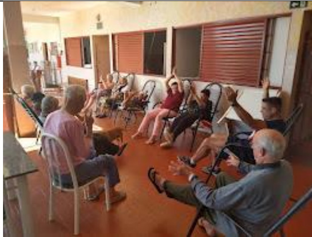
Realizada em 03/08/2023