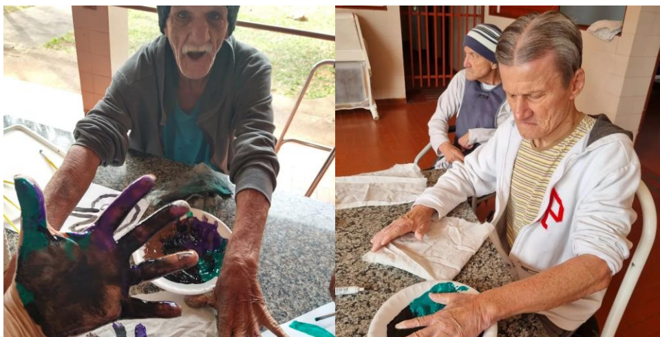
Realizada em 14/08/2023 – OFICINA Colcha de retalhos – Parte III – Registro Individual – Você é importante e faz parte da nossa história.