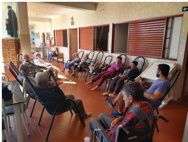
Realizado em 01/08/2023