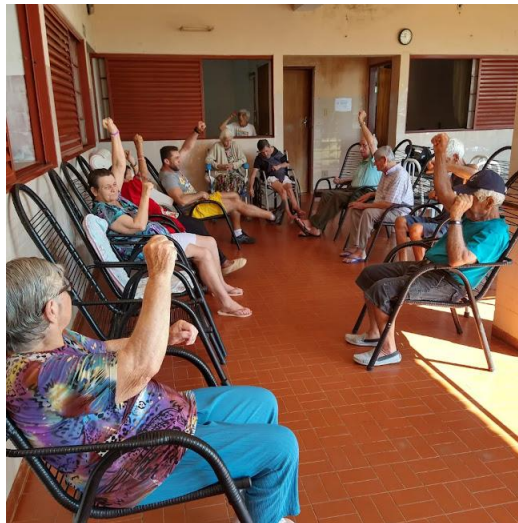
Realizada em 22/08/2023