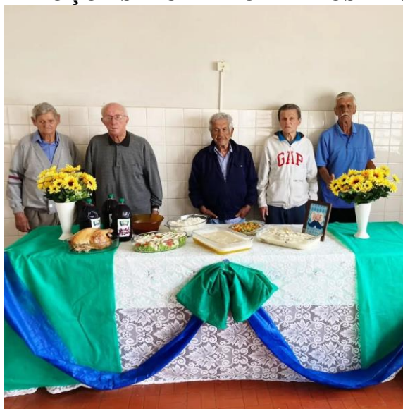
Realizado em 13/08/2023