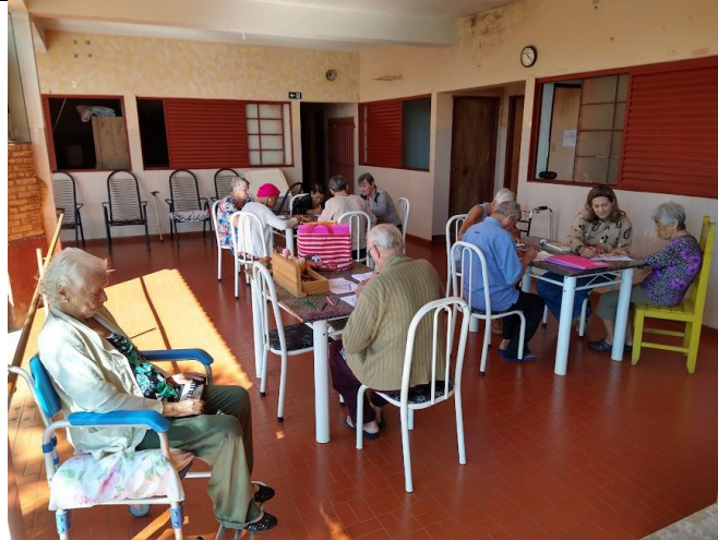
Realizada em 21/08/2023 - Atividade de pintura manual – trabalhando a coordenação motora fina.