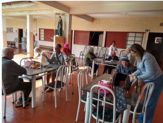
Realizado em 28/08/2023