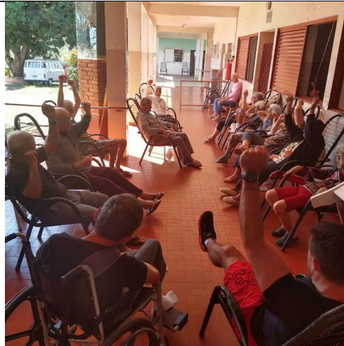
Realizada em 17/08/2023