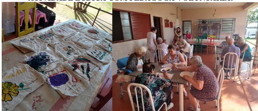
Realizada em 07/08/2023 – Oficina Colcha de retalhos – Parte II – Vivências da ilpi.