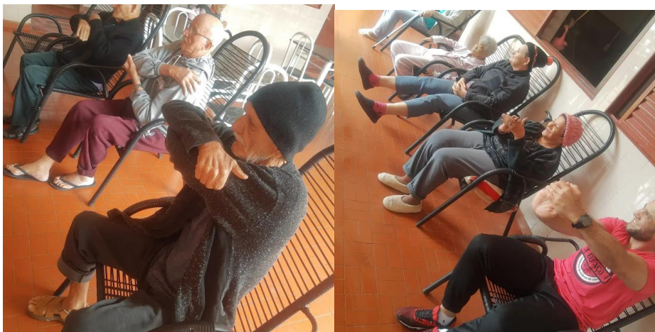
Realizada em 29/08/2023