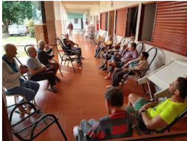
Realizada em 15/08/2023