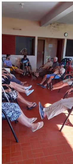
Realizado em 02/05/2023