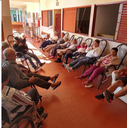
Realizada em 16/05/2023