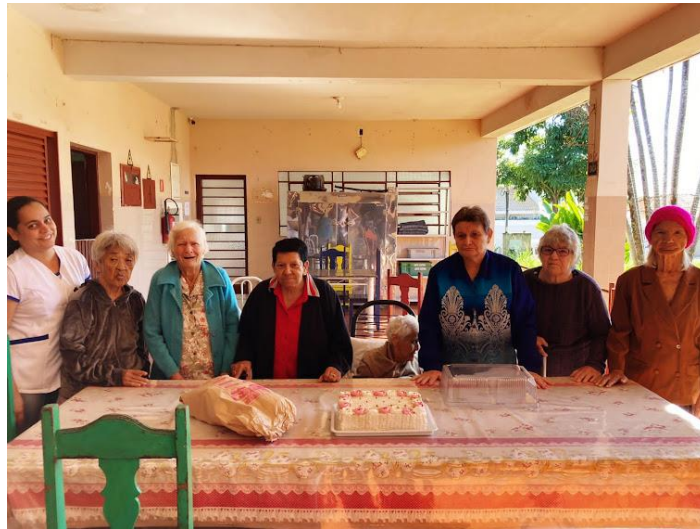
Café da tarde com doação de bolo especial – Supermercados Ulian – 14/05/2023.