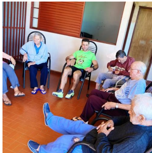
Realizada em 25/05/2023