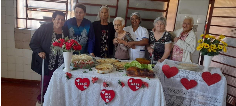
Almoço realizado em 14/05/2023