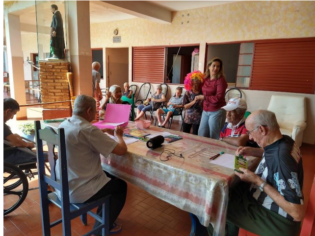
Realizada em 08/05/2023