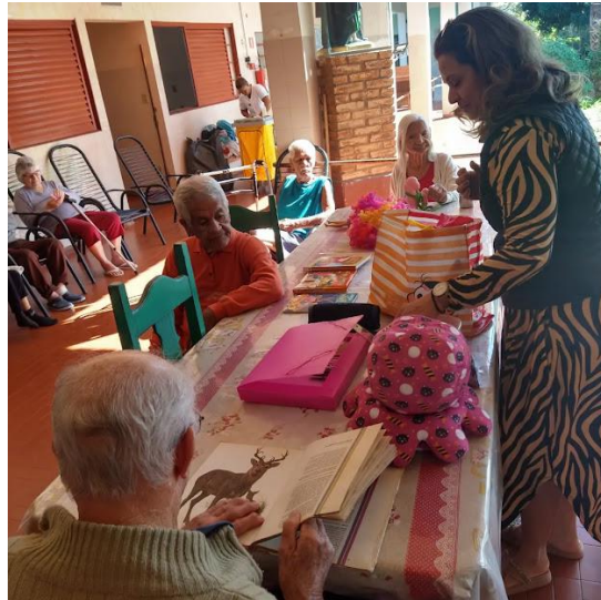
Realizada em 15/05/2023