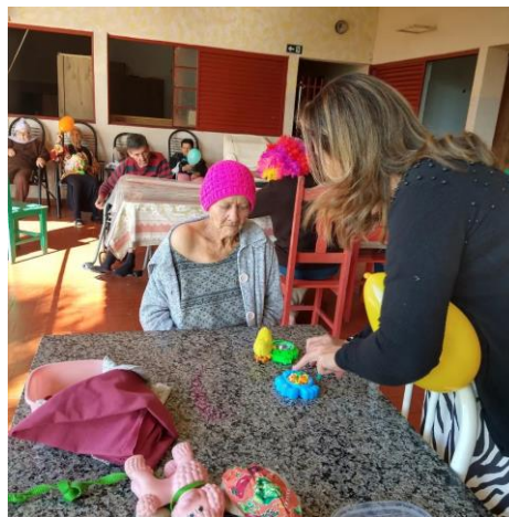
Realizada em 22/05/2023