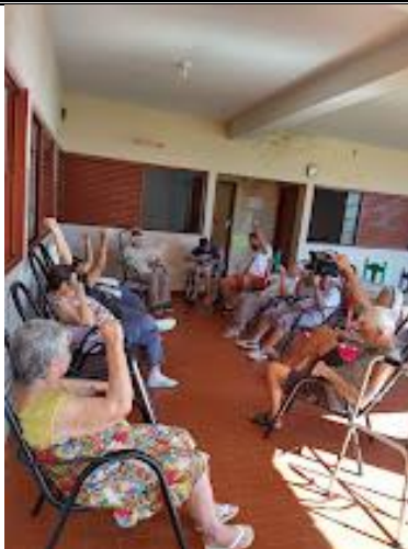
Realizada em 04/05/2023