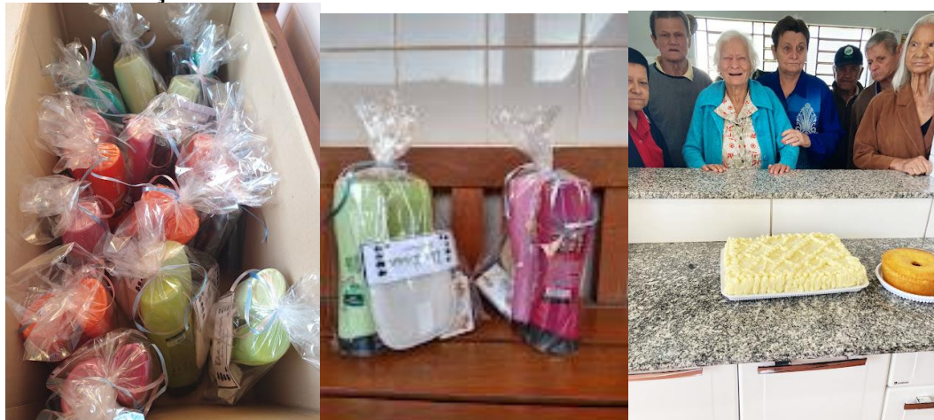
Realizada em 13/05/2023 – Entrega de café da tarde e mimos aos idosos (kit de higiene).