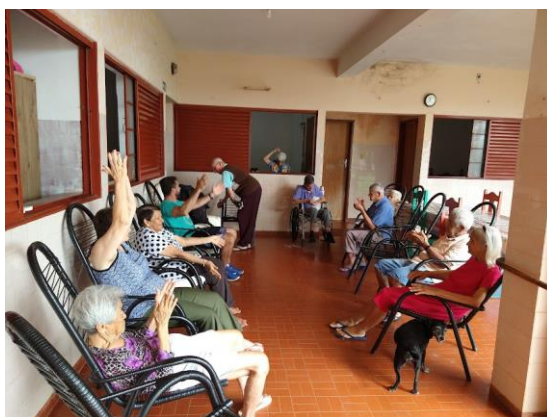
Realizado em 09/05/2023