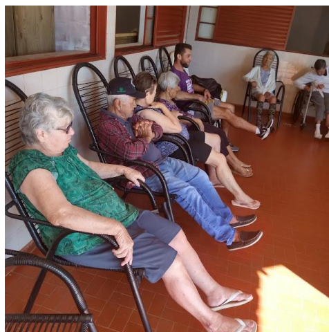
Realizado em 11/05/2023