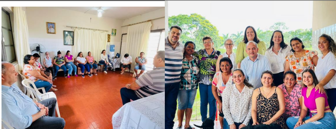
TRANSFORME – GESTÃO DE EQUIPE – Encerramento – 01/03/2023

ASSOCIAÇÃO LAR DOS IDOSOS DE ALVARES MACHADO Rua Campos Salles, nº 10 – CEP 19.160-000 - Fone (018) 3273 - 1542 Álvares Machado – SPCNPJ 51.400.000/0001-10 E-mail: lardosidososdam@yahoo.com.br