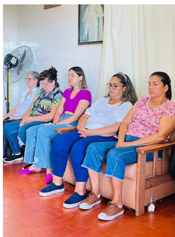
TRANSFORME – GESTÃO DE EQUIPE – Turma II – 01/03/2023