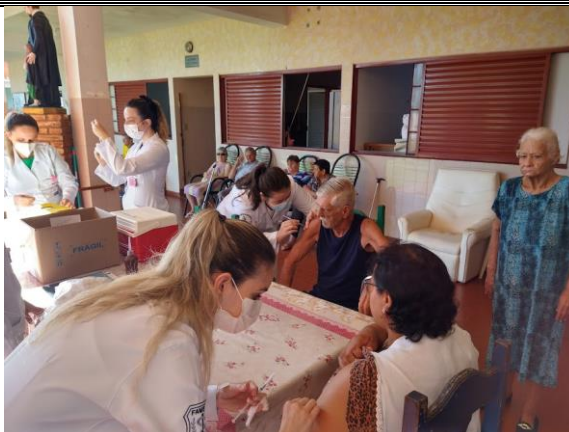
Realizada em 07/03/2023 - idosos