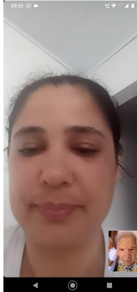
Realizada em 08/03/2023 – Maria Almeida