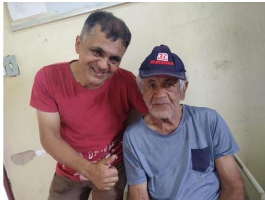
Família da Francisco – 03/03/2023