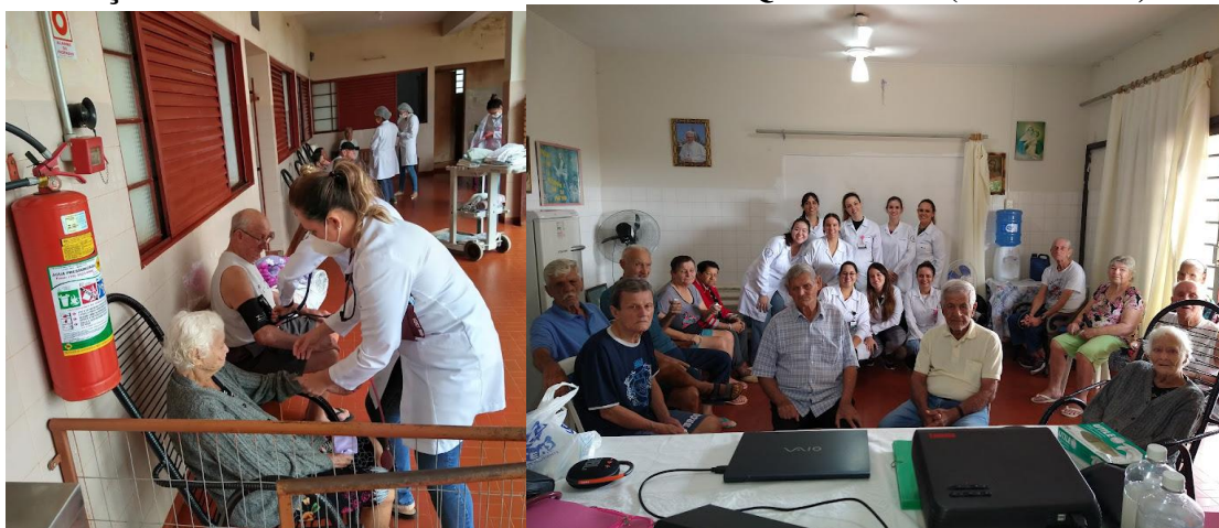
Realizada em 14/03/2023 – Palestra sobre cuidados corporais e higiene pessoal.