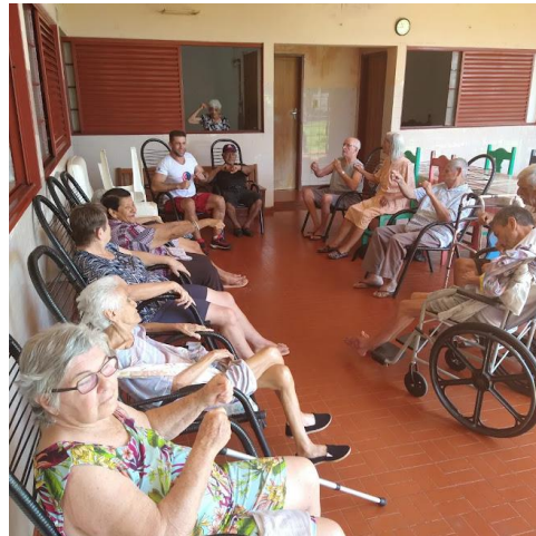
Realizada em 23/03/2023