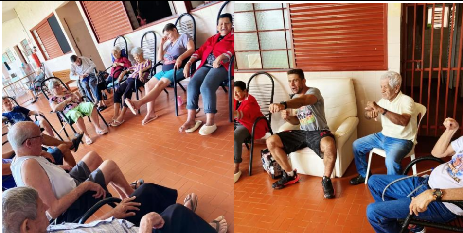
Realizada em 14/03/2023