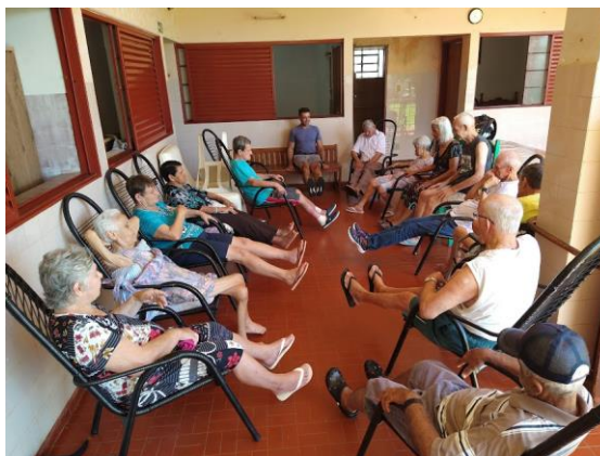
Realizada em 09/03/2023