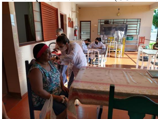
Realizada em 07/03/2023 - funcionários