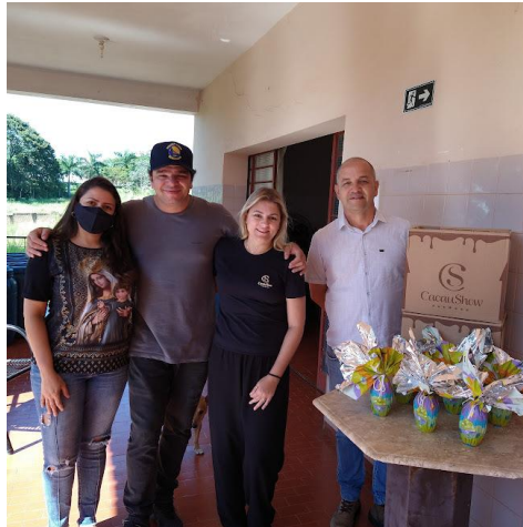
Doações da Cacau Show de Alv. Machado - 22/03/2023