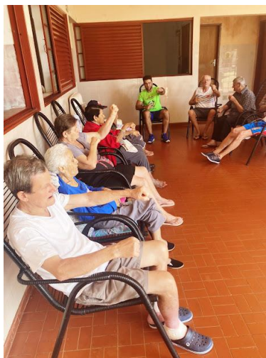
Realizada em 28/03/2023