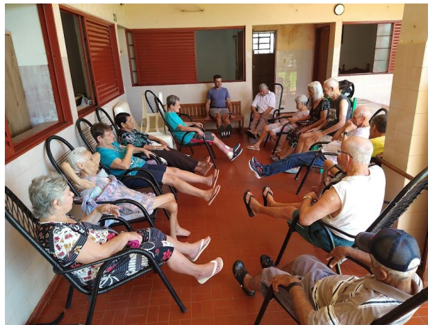
Realizada em 09/03/2023