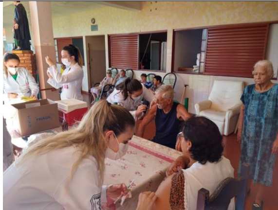
Realizada em 07/03/2023 - idosos