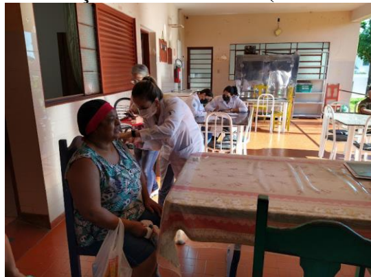
Realizada em 07/03/2023 - funcionários