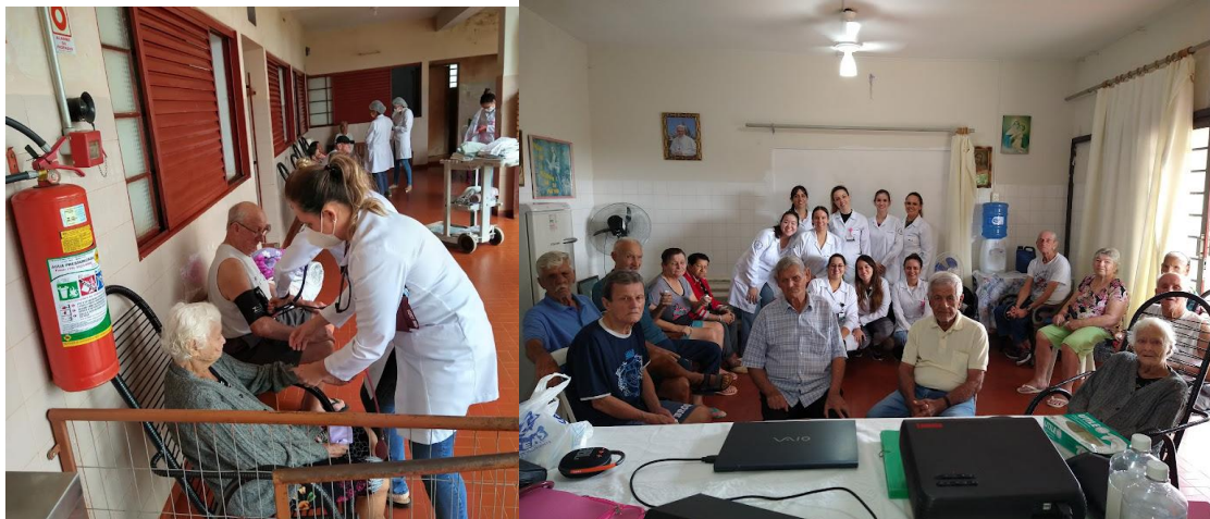
Realizada em 14/03/2023 – Palestra sobre cuidados corporais e higiene pessoal.