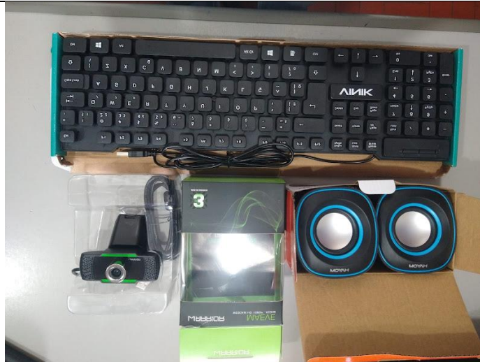
Computador – Serviço Social

ASSOCIAÇÃO LAR DOS IDOSOS DE ALVARES MACHADO Rua Campos Salles, nº 10 – CEP 19.160-000 - Fone (018) 3273 - 1542 Álvares Machado – SP CNPJ 51.400.000/0001-10 E-mail: lardosidososdam@yahoo.com.br