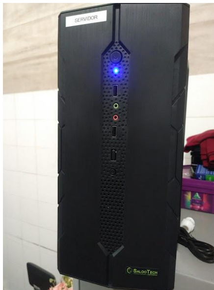
Computador – Servidor