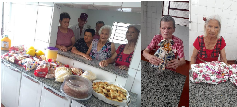
Esposas dos diretores – enviou café da tarde especial e presentes aos idosos – 11/12/2022