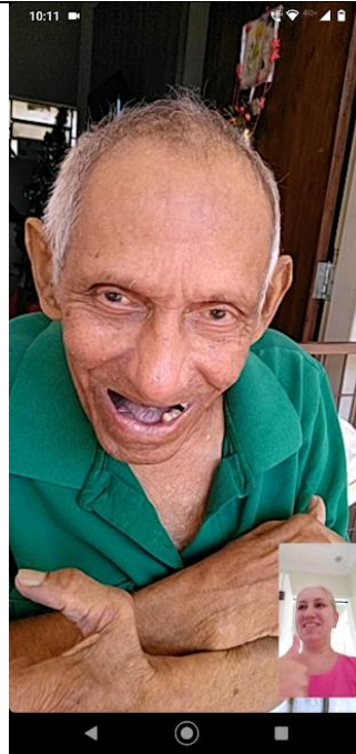
Realizada em 16/12/2022