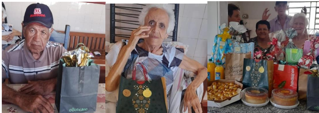
Ministério Mudança de Vida – enviou café da tarde especial e presentes aos idosos – 17/12/2022