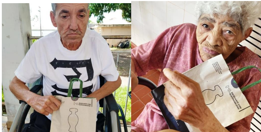
Presentes natalinos – enviados pelo pessoal da Loja maçônica: Liberdade, Justiça e Trabalho (175) – 25/12/2022