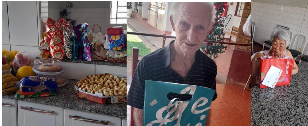
PASTORAL DA PESSOA IDOSA – enviou café da tarde especial e presentes aos idosos – 03/12/2022