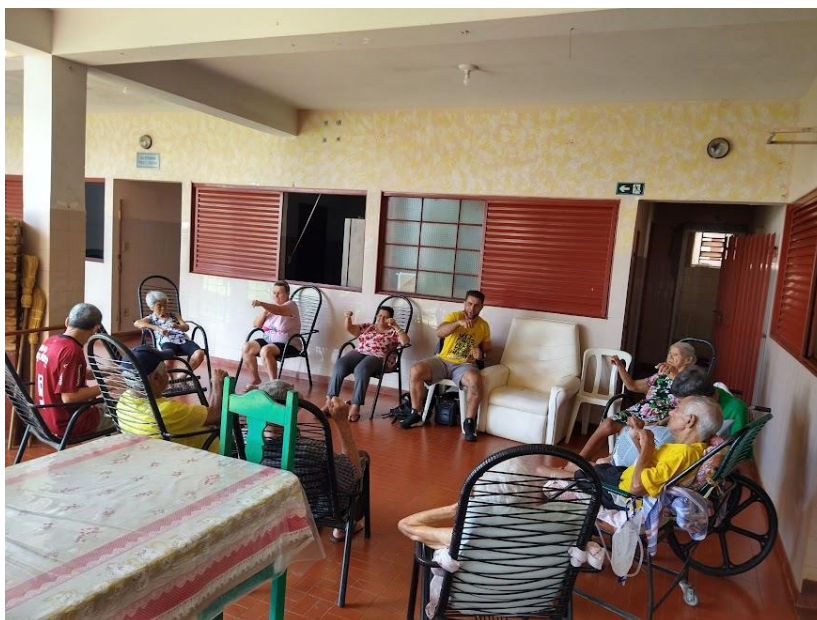
Realizada em 24/11/2022