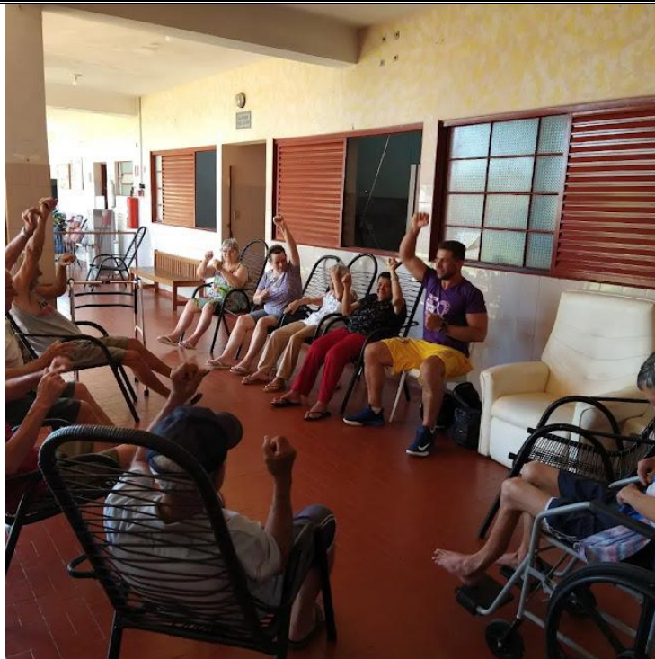
Realizado em 17/11/2022