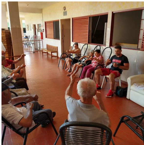
Realizado em 10/11/2022