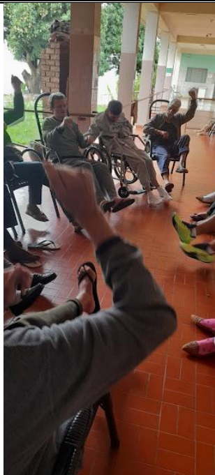
Realizado em 01/11/2022