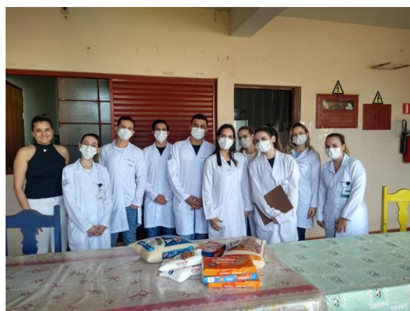
Realizada em 31/10/2022