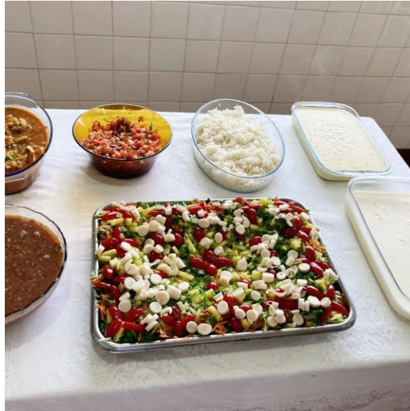
Almoço Especial – 01/10/2022