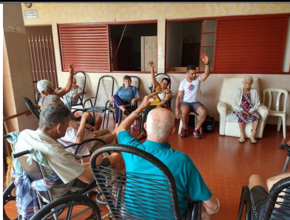
Realizado em 06/10/2022