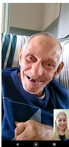
Realizada em 21/10/2022