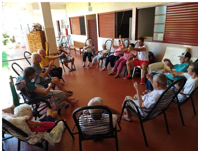
Realizado em 25/10/2022