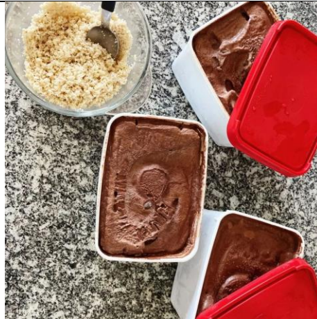
Café da tarde – 01/10/2022