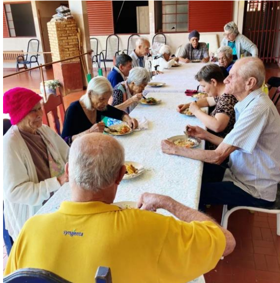
Almoço Especial – 01/10/2022