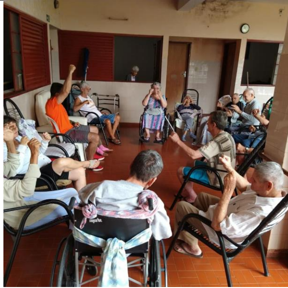
Realizada em 20/10/2022