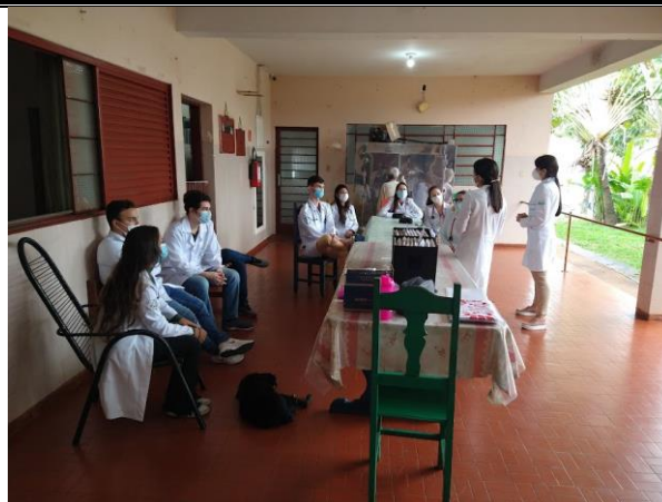
Realizada em 14/10/2022