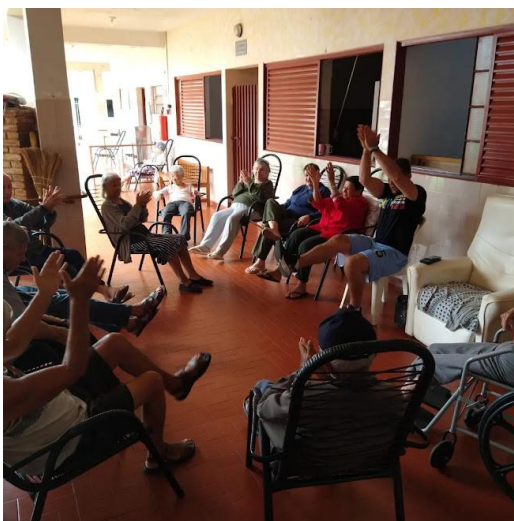
Realizado em 13/10/2022