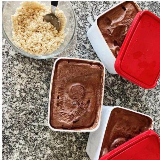
Café da tarde – 01/10/2022