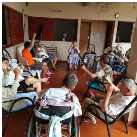
Realizada em 20/10/2022