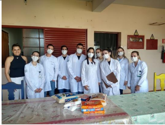
Realizada em 31/10/2022