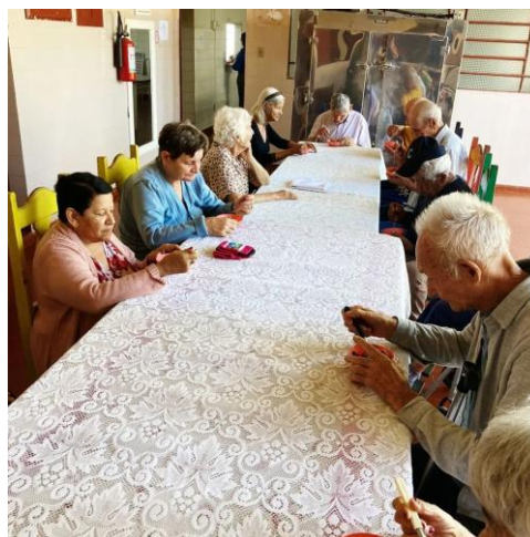
Café da tarde – 01/10/2022