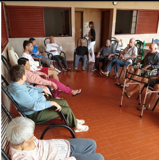
Realizado em 11/10/2022