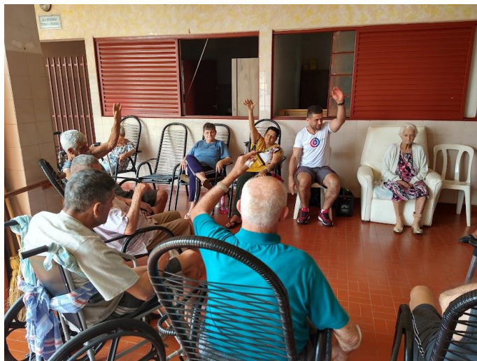
Realizado em 06/10/2022