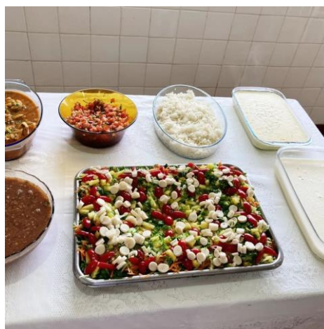
Almoço Especial – 01/10/2022