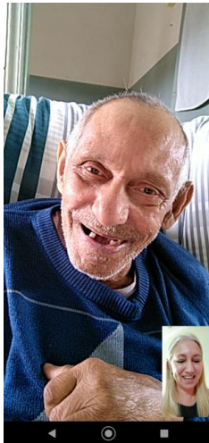
Realizada em 21/10/2022