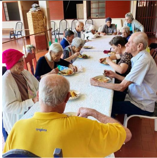
Almoço Especial – 01/10/2022