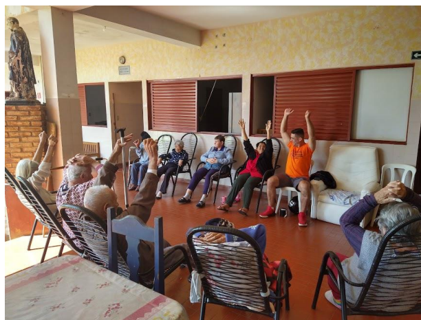
Realizado em 25/08/2022