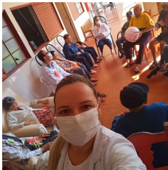
Atividade: dança sênior, realizada em 16/08/2022