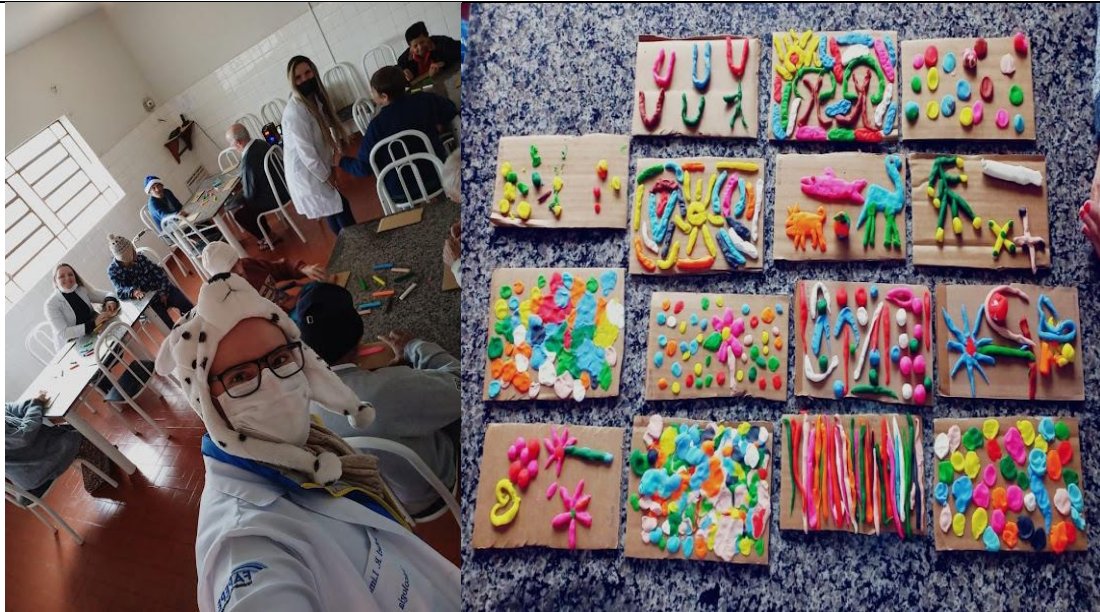
Atividade: massinha de modelar, realizada em 10/08/2022