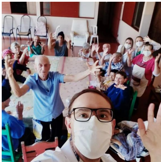
Encerramento das atividades: bingo adaptado, realizado em 24/08/2022 e confraternização.