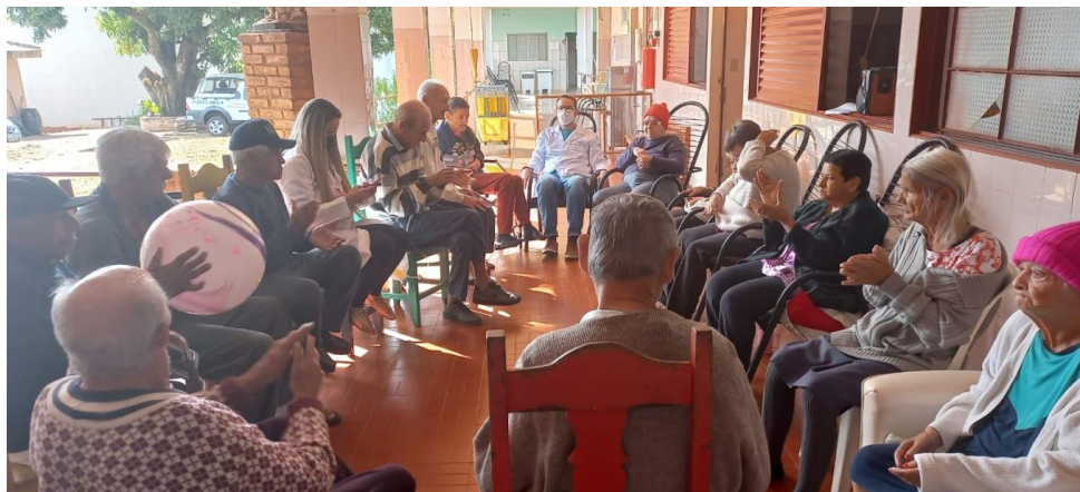
Realizado em 23/08/2022