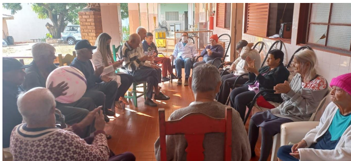
Atividade: batata-quente, realizada em 08/08/2022