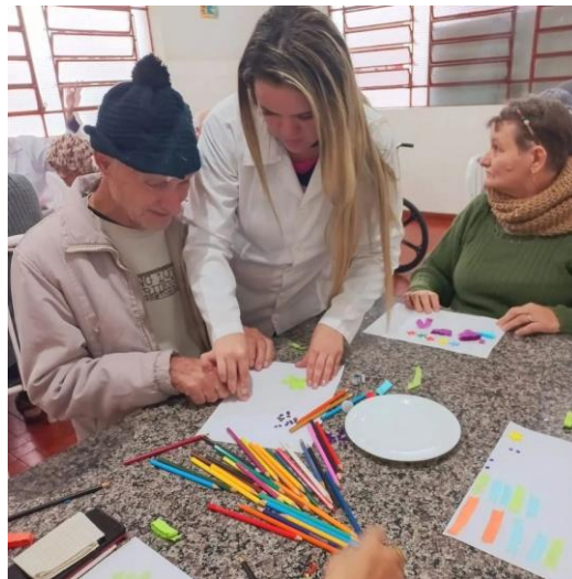
Atividade: produção artística - I, realizada em 18/08/2022