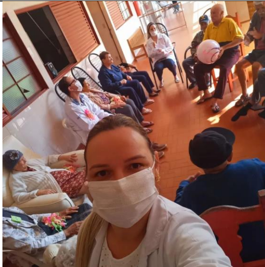
Atividade: dança sênior, realizada em 16/08/2022