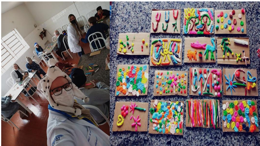
Atividade: massinha de modelar, realizada em 10/08/2022