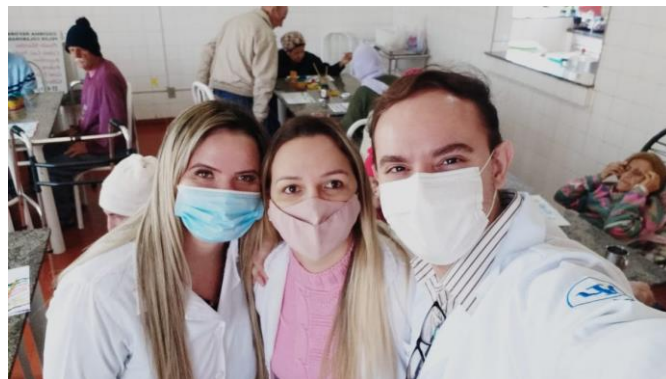
Atividade: produção artística - II, realizada em 22/08/2022