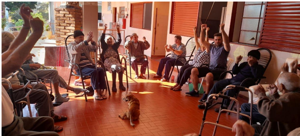
Realizado em 30/06/2022