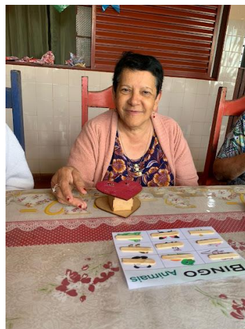
Realizada em 08/06/2022 – atividade Bingo adaptado