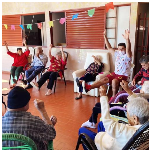
Realizado em 23/06/2022