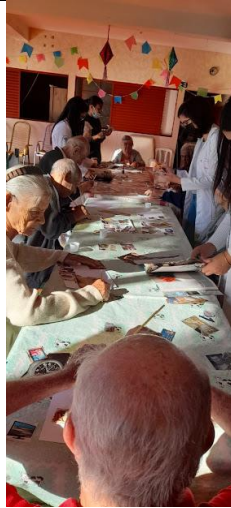
Realizada em 06/06/2022 – atividade de colagem