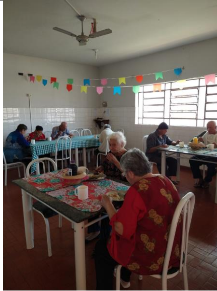
Realizado em 23/06/2022