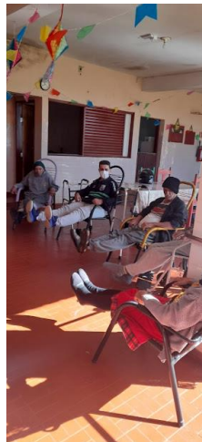
Realizado em 14/06/2022