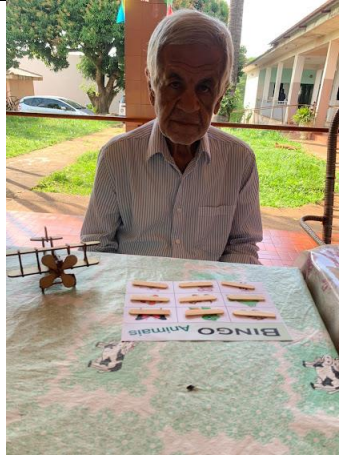
Realizada em 08/06/2022 – atividade Bingo adaptado