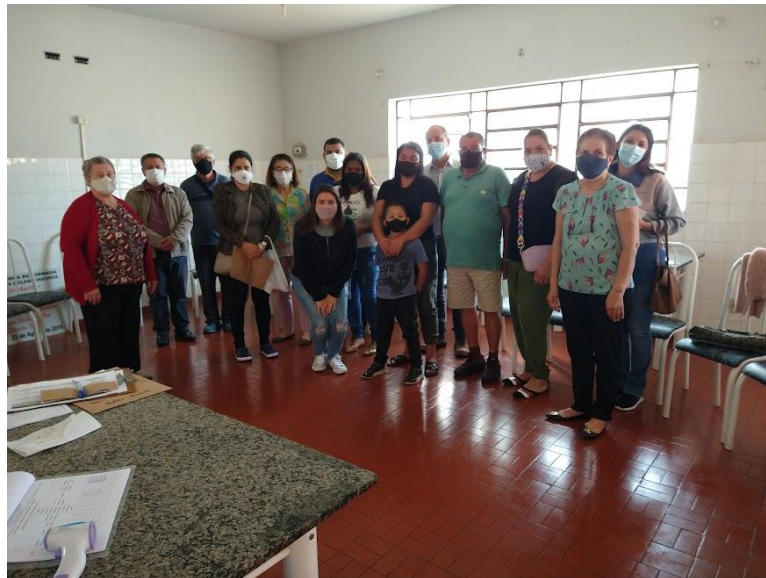
Realizada em 29/06/2022