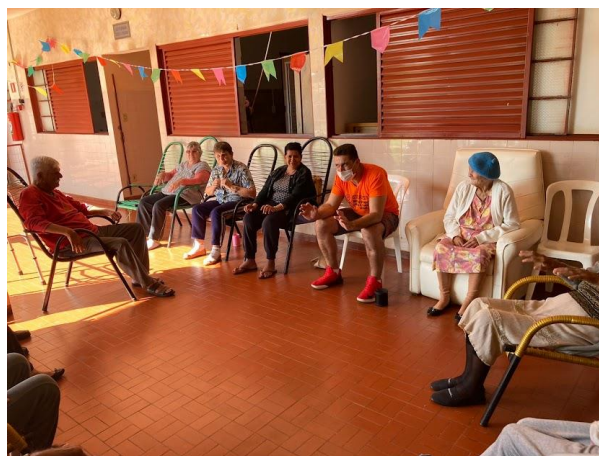
Realizado em 21/06/2022