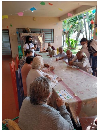
Encerramento das atividades dessa turma de estagiários, realizada em 08/06/2022 – atividade Bingo adaptado.