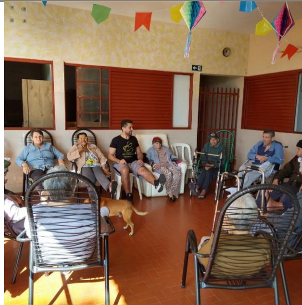
Realizado em 28/06/2022