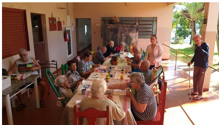
Atividade 12/04/2022: Pintura em tecido