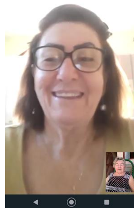
Realizada em 28/04/2022