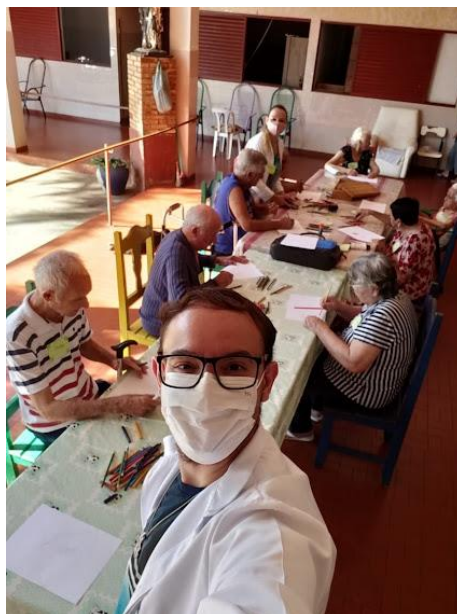
Atividade 04/04/2022: A vida em cores