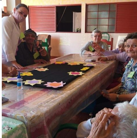
Atividade de 18/04/2022: Confeção de painel de fotos