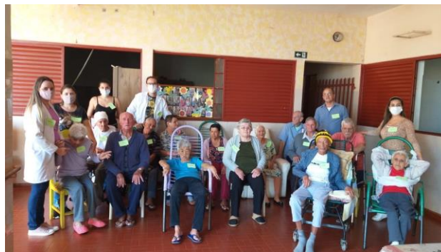
Encerramento da atividade dos estagiários – 18/04/2022