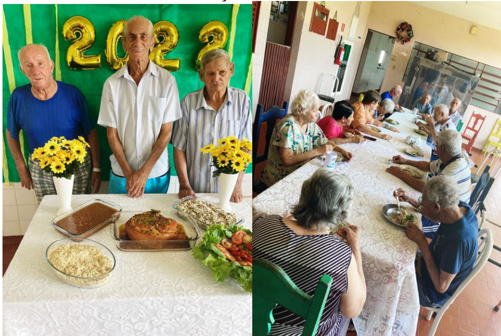
Realizado em 01/01/2022