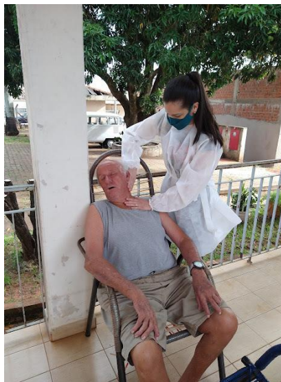
Realizado em 27/01/2022

*Em 27/01/2022 a fisioterapeuta fez o ultimo atendimento na entidade, pois informou que está se desligando da Prefeitura Municipal de Alvares Machado.