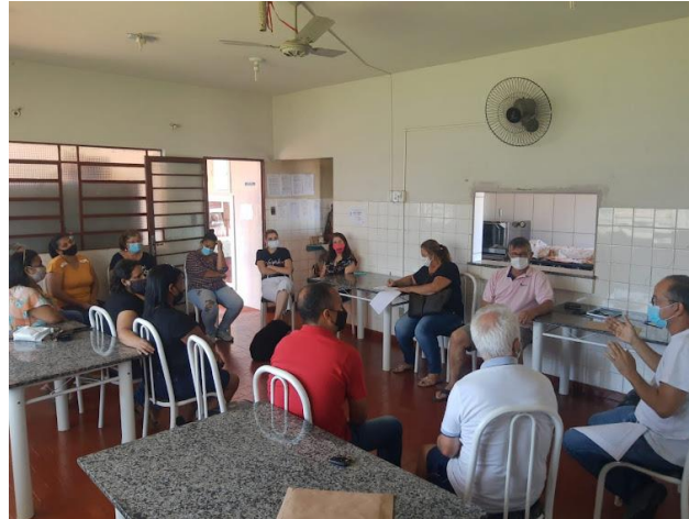
Realizada em 20/11/2021

Álvares Machado, 30 de Novembro de 2021.