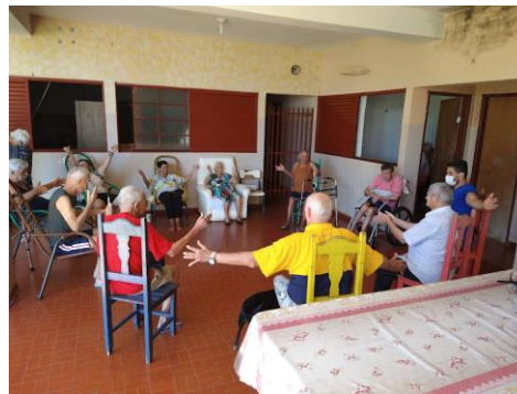
Retomada das atividades do Educador Físico – 22/11/2021