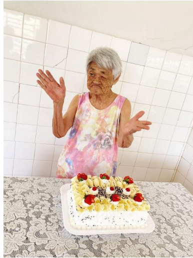
Realizada em 24/11/2021