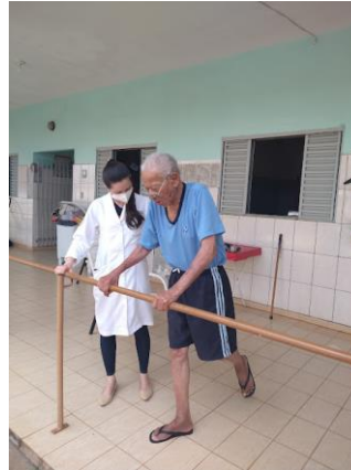
Retomada dos atendimentos da Fisioterapeuta - 25/11/2021