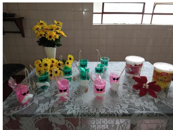
Lembrancinhas e sobremesa – 01/10/2021