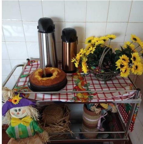
Café da manhã junino – 23/06/2021