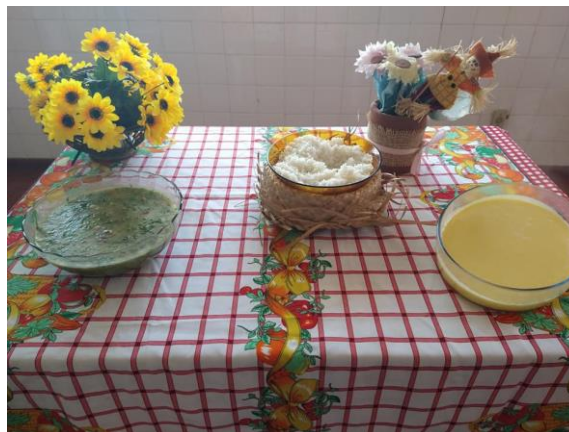
Almoço junino – 23/06/2021