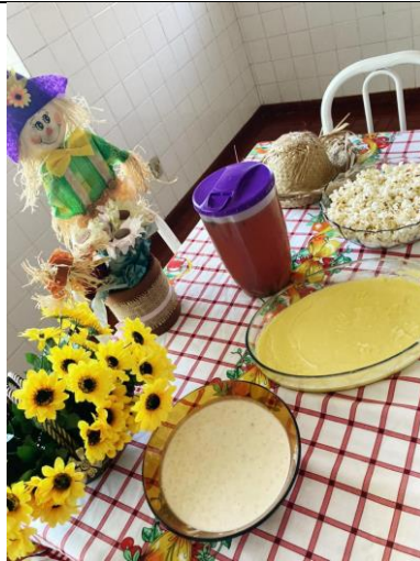
Café da tarde junino – 23/06/2021