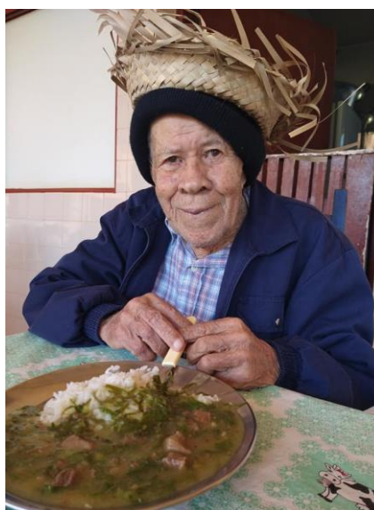
Idoso no momento do almoço junino – 23/06/2021