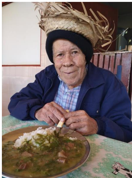
Ídoso no momento do almoço junino – 23/06/2021