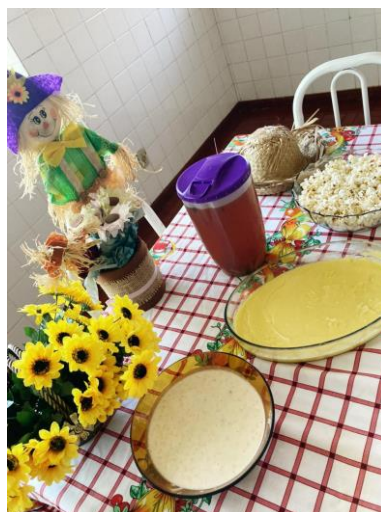
Café da tarde junino – 23/06/2021