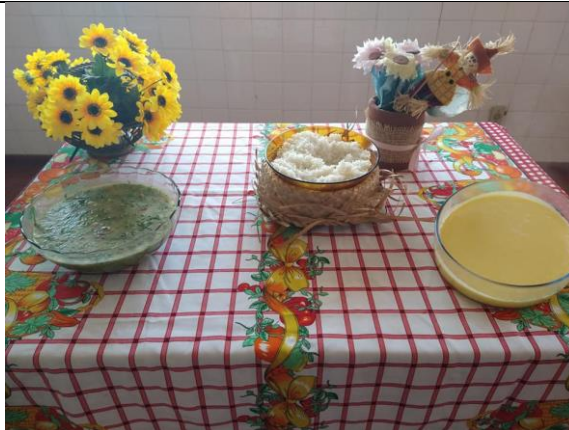
Almoço junino – 23/06/2021