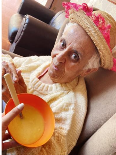
Idosa no momento do café da tarde junino – 23/06/2021

ASSOCIAÇÃO LAR DOS IDOSOS DE ALVARES MACHADO Rua Campos Salles, nº 10 – CEP 19.160-000 - Fone (018) 3273 - 1542 Álvares Machado – SPCNPJ 51.400.000/0001-10 E-mail: lardosidososdam@yahoo.com.br