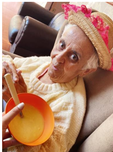
Idosa no momento do café da tarde junino – 23/06/2021