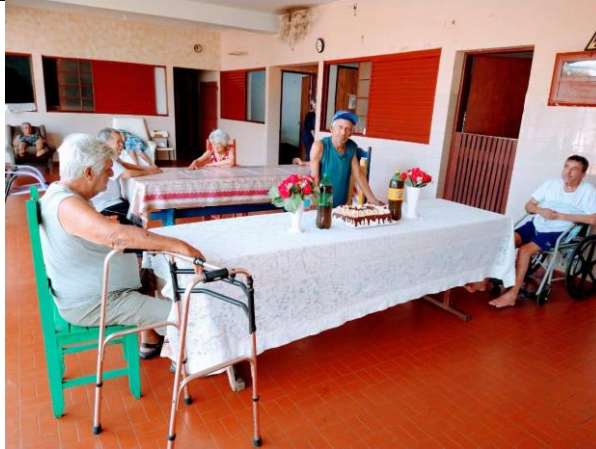
Café da tarde especial realizado em 01/10/2020