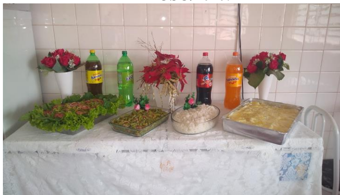
Almoço especial realizado em 01/10/2020