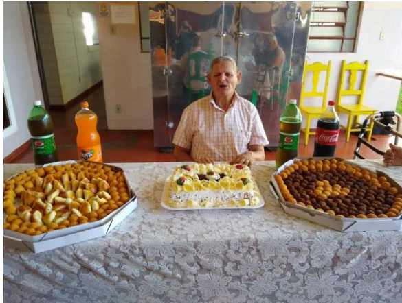
Realizada em 28/10/2020.