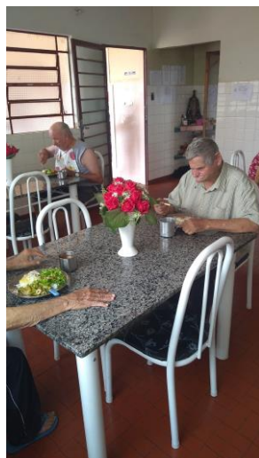
Almoço especial realizado em 01/10/2020