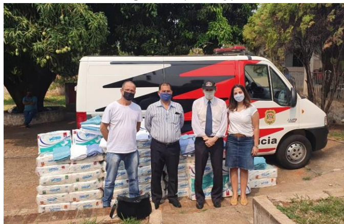
Realizada em 08/10/2020