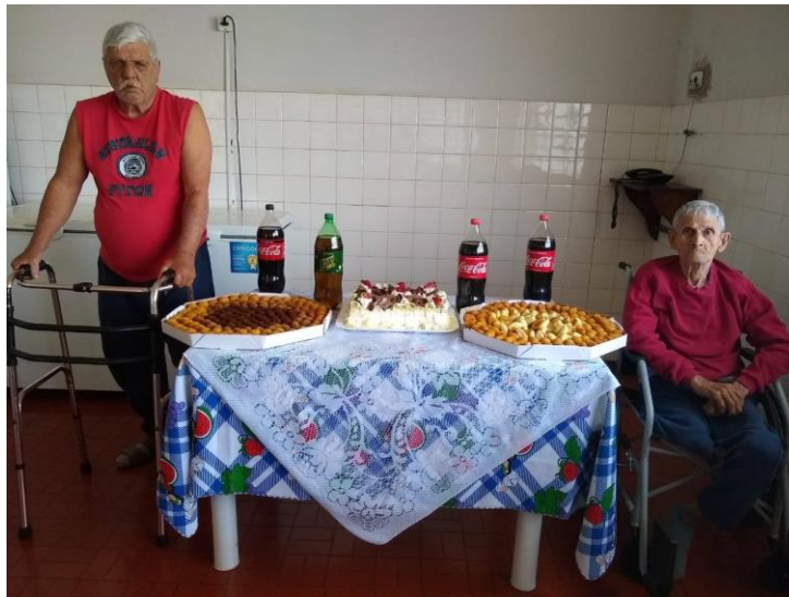
Realizada em 25/08/2020.