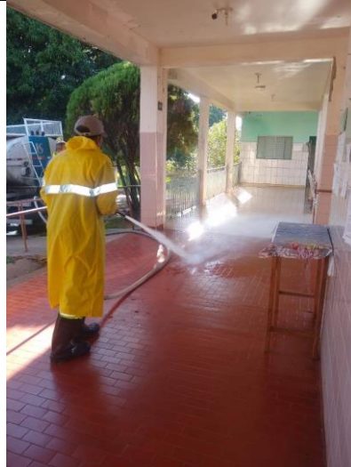
Realizada em 29/08/2020