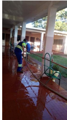
Realizada em 08/08/2020