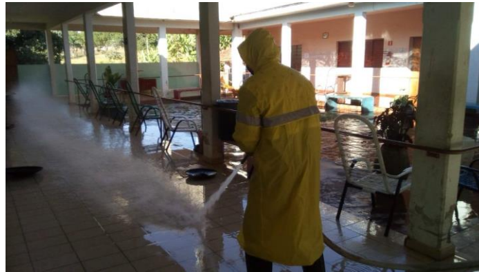
Realizada em 01/08/2020