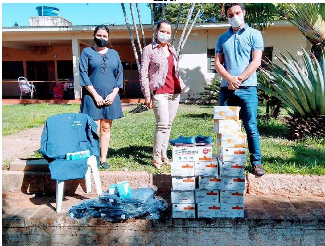
Realizada em 04/08/2020. Foram entregues roupas privativas e calçados para todos os funcionários, bem como barras de apoio (para instalação nos banheiros), termômetros digitais e oxímetros.