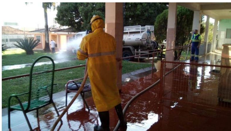
Realizada em 18/07/2020