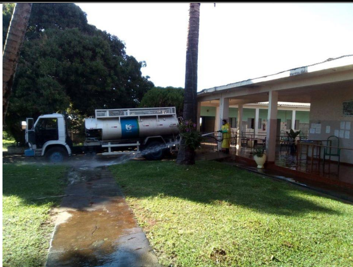
Realizada em 04/07/2020