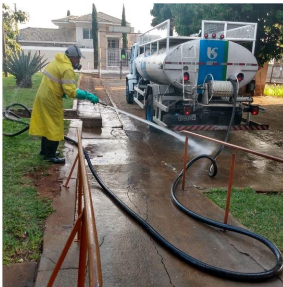
Realizada em 11/07/2020