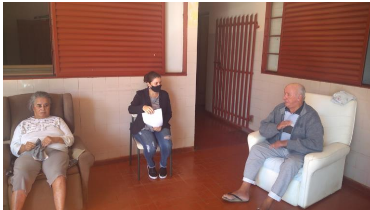
Realizada em 28/07/2020