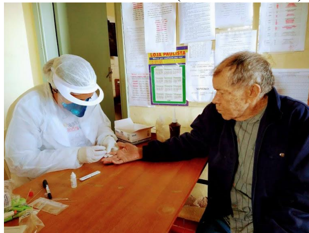
Testagem feita em todos os idosos da ilpi – em 15/07/2020