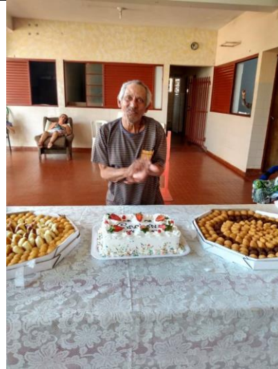
Realizada em 29/07/2020.