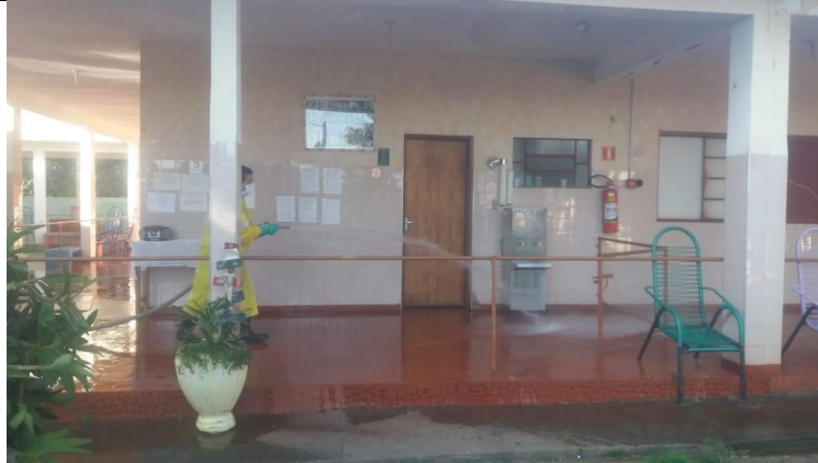
Realizada em 25/07/2020