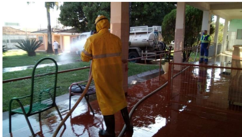
Realizada em 18/07/2020