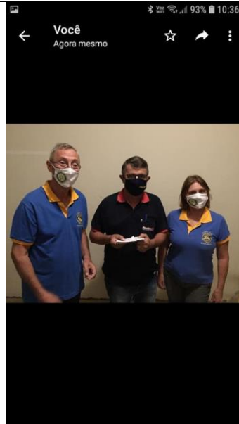
Realizado em 18/07/2020