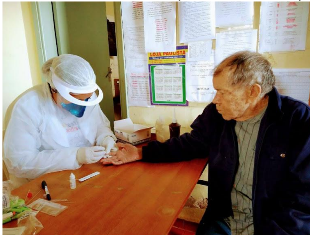
Testagem feita em todos os idosos da ilpi – em 15/07/2020