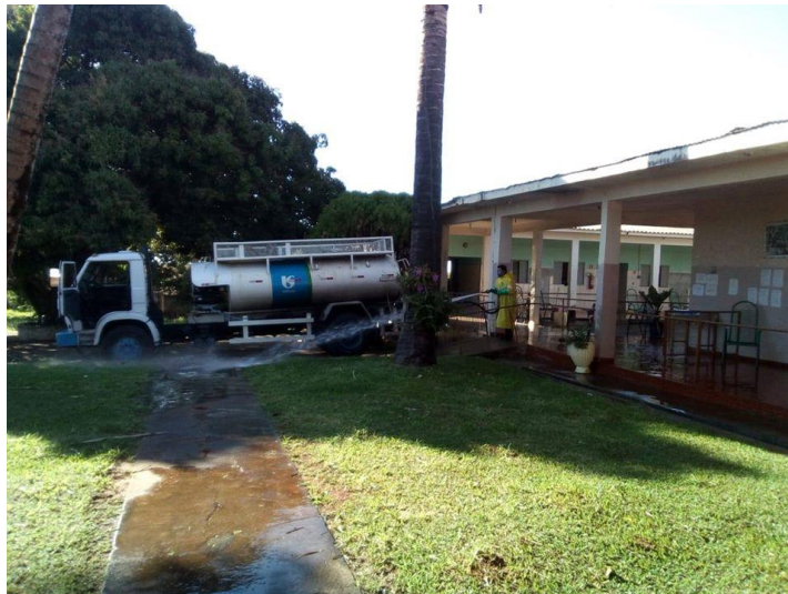
Realizada em 04/07/2020