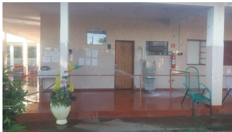
Realizada em 25/07/2020