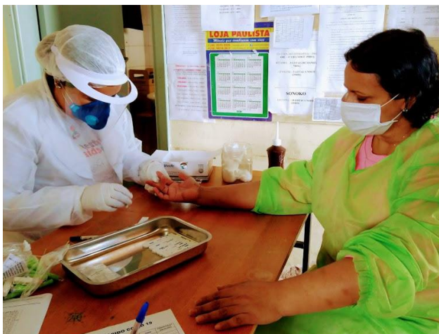
Testagem feita em todos os funcionários – em 15 e 16/07/2020