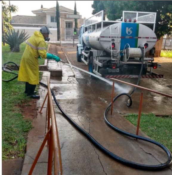
Realizada em 11/07/2020