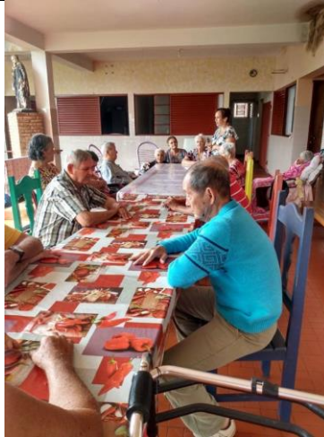
Atividade realizada em 31/01/2020 – CONTAÇÃO DE HISTÓRIA: A MENINA E O PÁSSARO ENCANTADO.