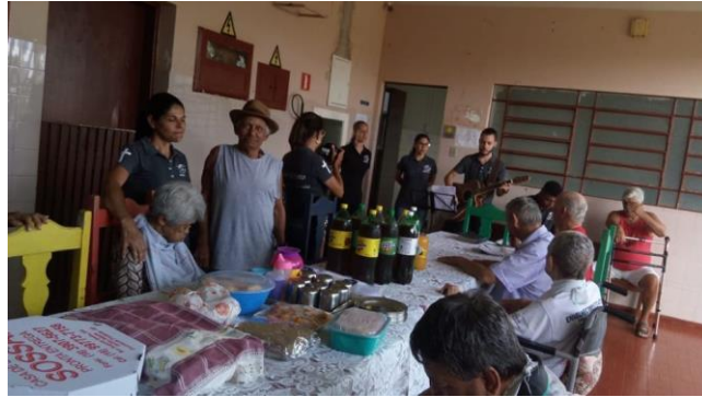
Visita dos membros da igreja Ministério Mudança de Vida – Pres. Prudente – 18/01/2020