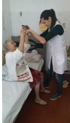
Realizado em 23/01/2020