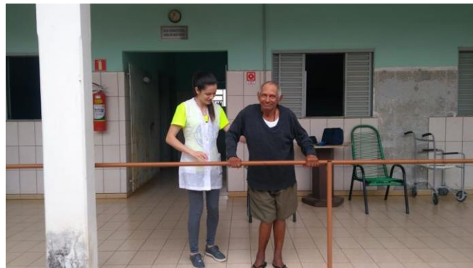
Realizado em 07/01/2020