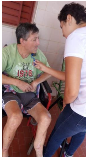
Realizado em 20/01/2020