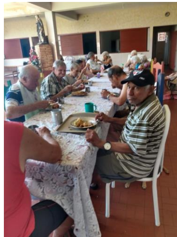
Realizado em 01/01/2020