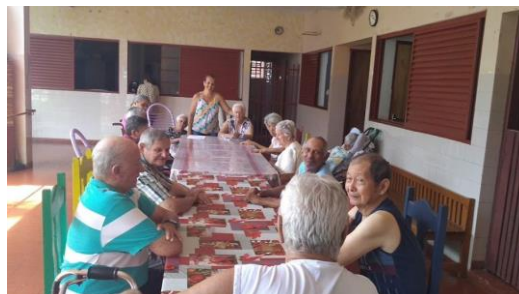
Atividade realizada em 17/01/2020 – CONTAÇÃO DE HISTÓRIA: A BORBOLETA DE UMA ASA SÓ.