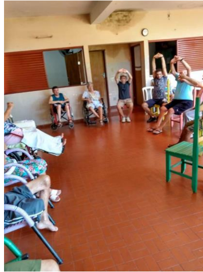
Realizado em 15/01/2020