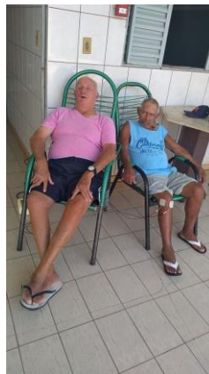
Realizado em 28/01/2020