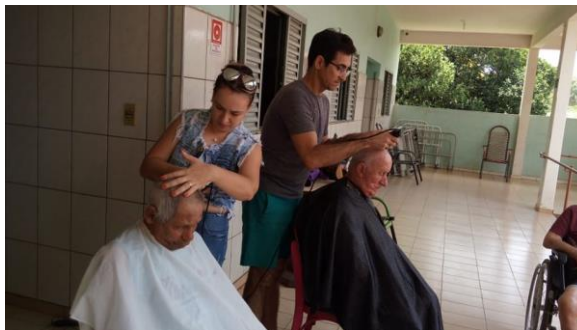
Realizado em 20/01/2020