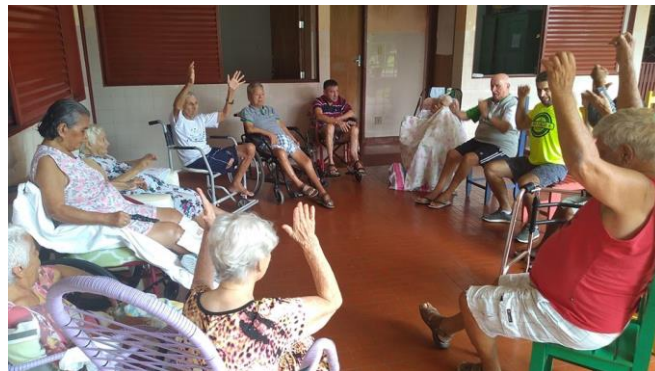
Realizado em 22/01/2020