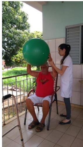
Realizado em 14/01/2020