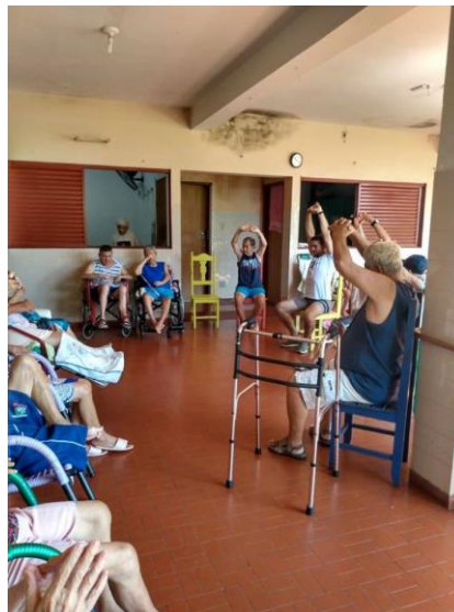
Realizado em 29/01/2020