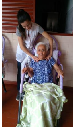
Realizado em 09/01/2020