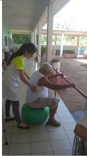
Realizado em 21/01/2020