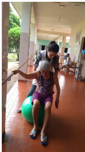
Realizado em 16/01/2020