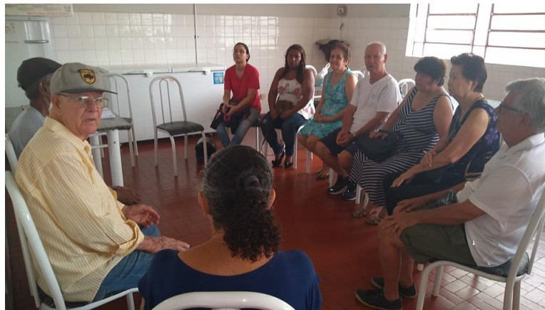
Realizada em 06/11/2019 – Encerramento das reuniões de famílias 2019 (Reunião Avaliativa).