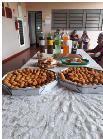
Visita do Setor São Pedro – 24/11/2019