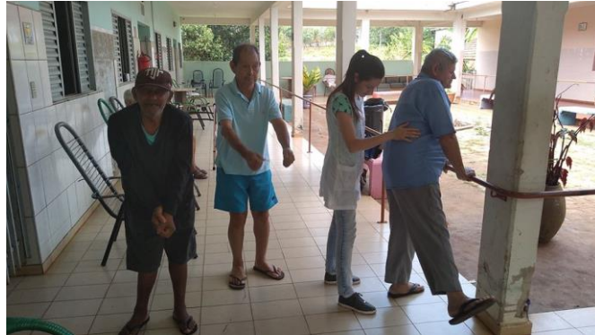
Realizado em 07/11/2019