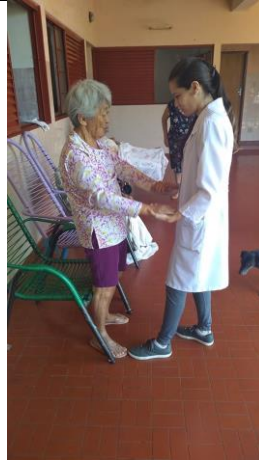
Realizado em 19/11/2019