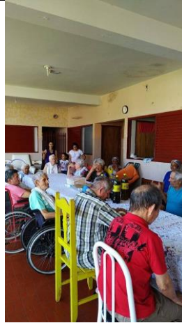
Visita dos membros da igreja Metodista – Alv. Machado –17/11/2019