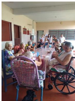
Realizado em 05/11/2019 – Atividade e encerramento do semestre: .