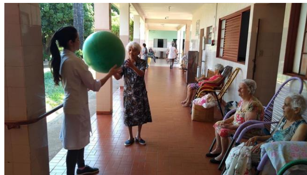
Realizado em 21/11/2019