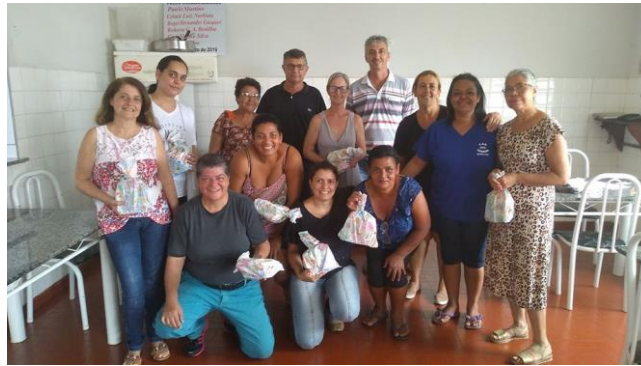
Realizada em 23/11/2019 – Encerramento das reuniões de funcionários 2019 (Reunião Avaliativa).