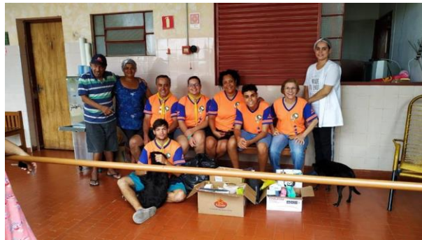
Visita do pessoal do Clube de Desbravadores e Aventureiros – Solares e Solares Kids – Igreja Adventista - Pres. Prudente – 23/11/2019