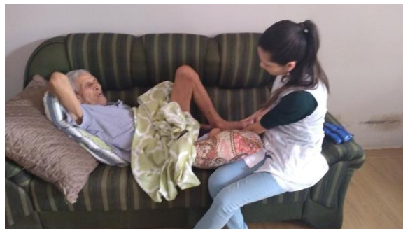
Realizado em 14/11/2019