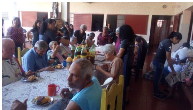
Visita dos membros da igreja Ministério Mudança de Vida – Pres. Prudente – 09/11/2019