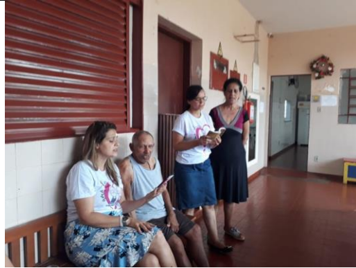
Visita dos membros da Igreja Assembléia de Deus – Pres. Prudente – 30/11/2019