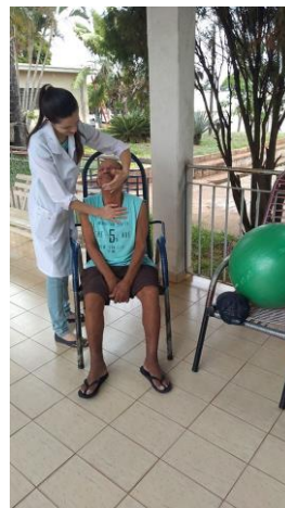
Realizado em 26/11/2019