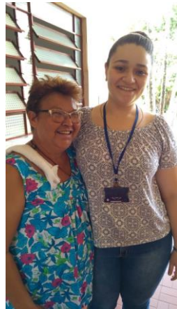
Realizado nos dias 05,12,19 e 26/11/2019.