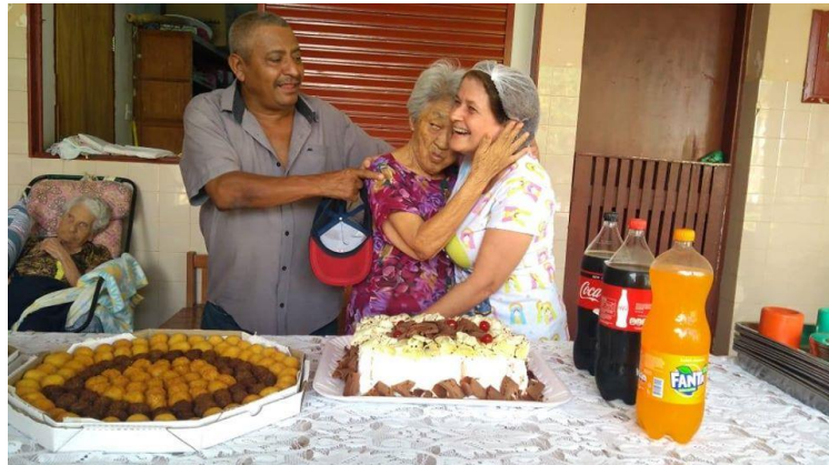
Realizada em 20/11/2019