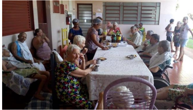
Visita do Setor São Francisco – 03/11/2019