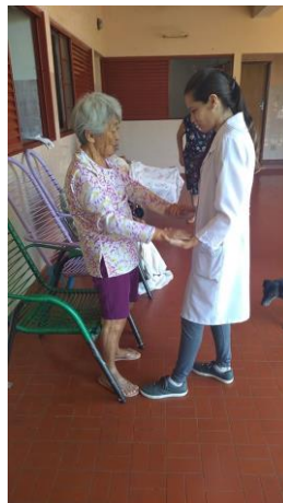
Realizado em 19/11/2019