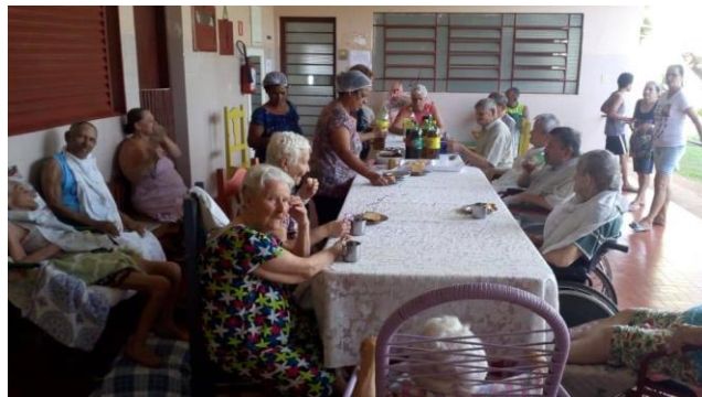
Visita do Setor São Francisco – 03/11/2019