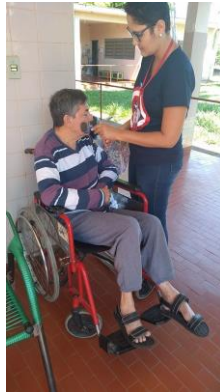
Realizado em 18/11/2019