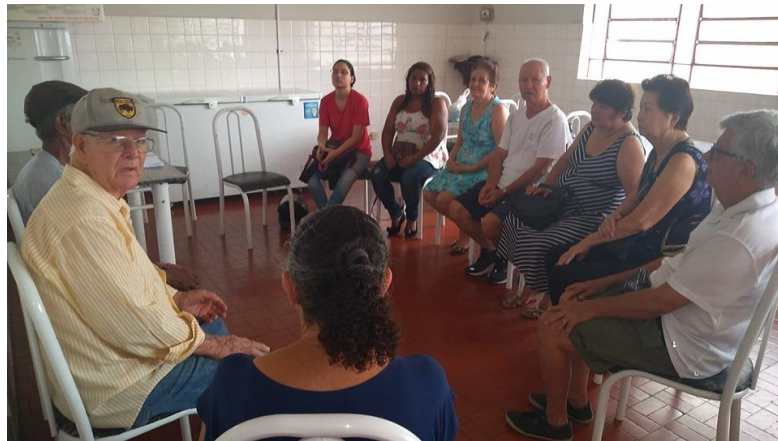
Realizada em 06/11/2019 – Encerramento das reuniões de famílias 2019 (Reunião Avaliativa).