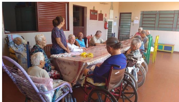
Atividade realizada em 29/11/2019 – CONTAÇÃO DE HISTORIA: PAZ INTERIOR.