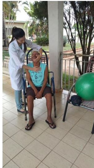
Realizado em 26/11/2019