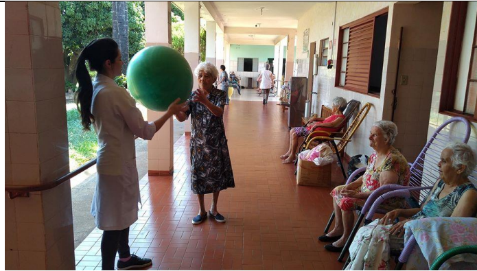
Realizado em 21/11/2019