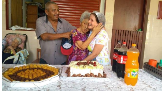
Realizada em 20/11/2019