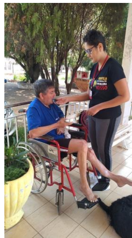
Realizado em 25/11/2019