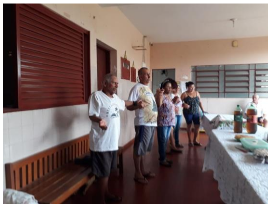
Visita do Setor Nossa Senhora de Lourdes – 10/11/2019