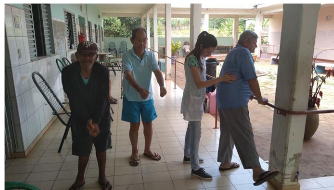
Realizado em 07/11/2019