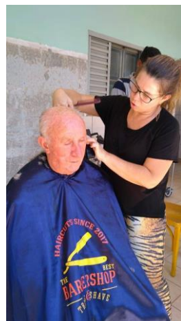
Realizado em 25/11/2019