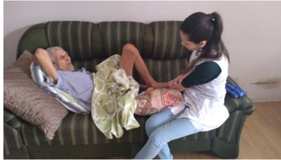
Realizado em 14/11/2019