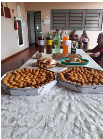
Visita do Setor São Pedro – 24/11/2019