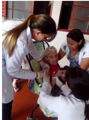
Realizado em 22/11/2019