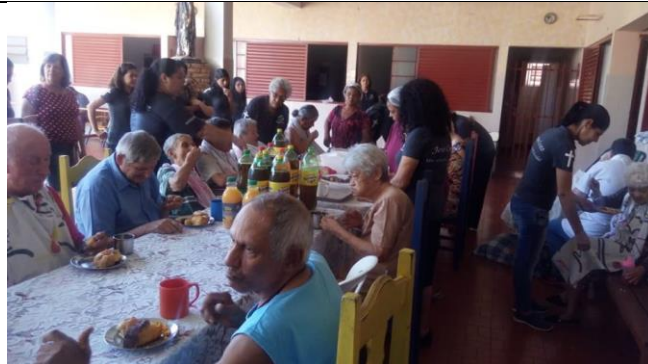
Visita dos membros da igreja Ministério Mudança de Vida – Pres. Prudente – 09/11/2019

ASSOCIAÇÃO LAR DOS IDOSOS DE ALVARES MACHADO Rua Campos Salles, nº 10 – CEP 19.160-000 - Fone (018) 3273 - 1542 Álvares Machado – SPCNPJ 51.400.000/0001-10 E-mail: lardosidososdam@yahoo.com.br