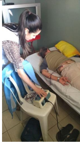
Realizado em 12/11/2019