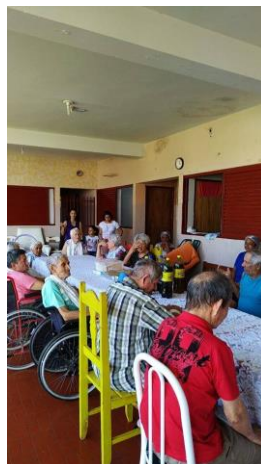
Visita dos membros da igreja Metodista – Alv. Machado – 17/11/2019