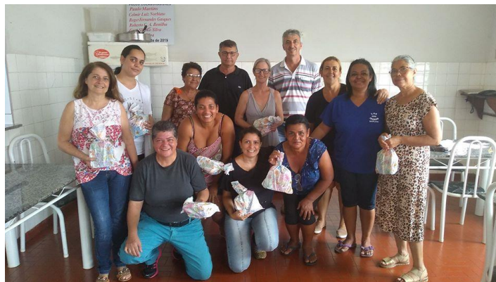
Realizada em 23/11/2019 – Encerramento das reuniões de funcionários 2019 (Reunião Avaliativa).