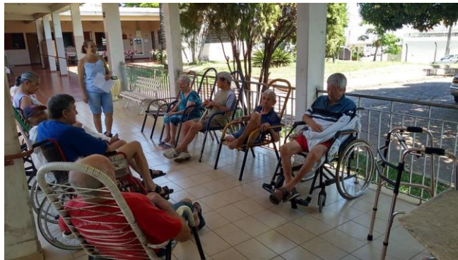
Atividade realizada em 22/11/2019 – CONTAÇÃO DE HISTORIA: A ÁRVORE GENEROSA.