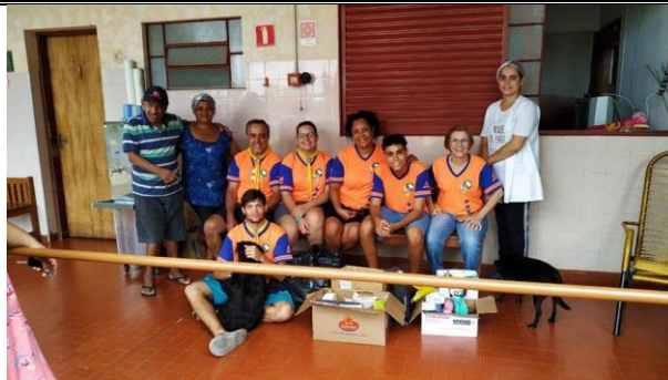
Visita do pessoal do Clube de Desbravadores e Aventureiros – Solares e Solares Kids – Igreja Adventista - Pres. Prudente – 23/11/2019

ASSOCIAÇÃO LAR DOS IDOSOS DE ALVARES MACHADO Rua Campos Salles, nº 10 – CEP 19.160-000 - Fone (018) 3273 - 1542 Álvares Machado – SPCNPJ 51.400.000/0001-10 E-mail: lardosidososdam@yahoo.com.br