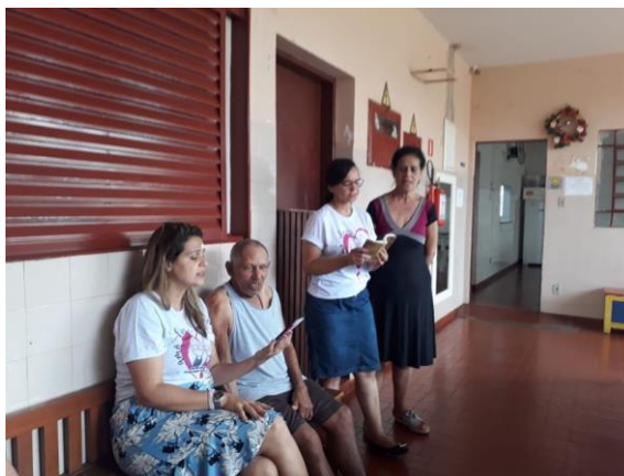
Visita dos membros da Igreja Assembléia de Deus – Pres. Prudente – 30/11/2019