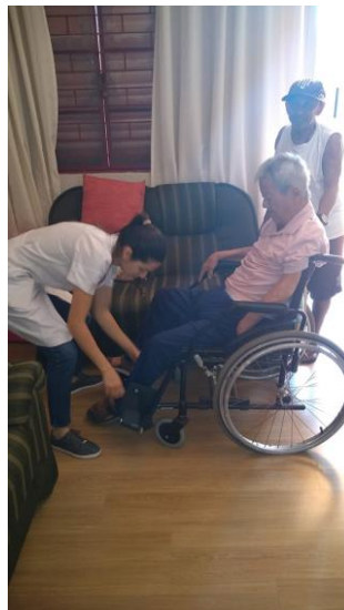
Realizado em 24/10/2019