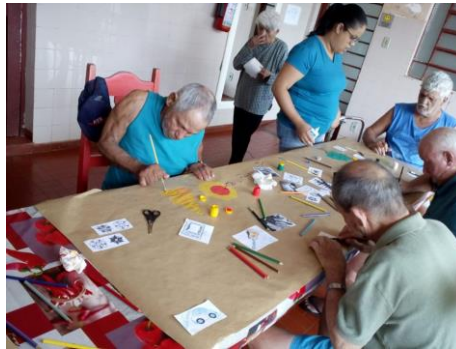
Realizado em 08/10/2019 – Atividade: Colagem em mural.