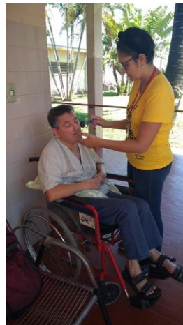
Realizado em 24/10/2019