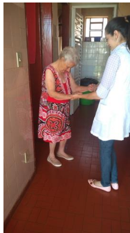
Realizado em 29/10/2019