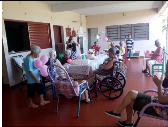
Visita dos membros da Igreja Assembléia de Deus – Pres. Prudente – 26/10/2019