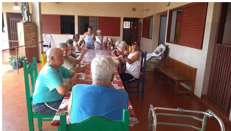
Atividade realizada em 18/10/2019 – CONTAÇÃO DE HISTORIA: A PARÁBOLA CHINESA DA SOGRA RUIM.