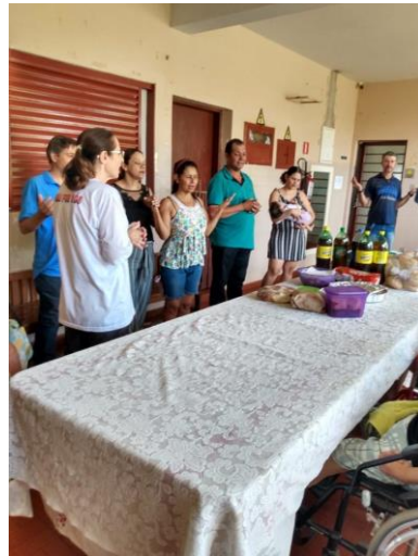
Visita do Setor Santo Expedito – 27/10/2019