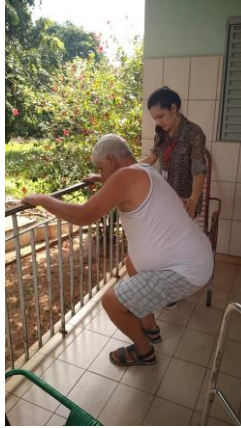
Realizado em 03/10/2019