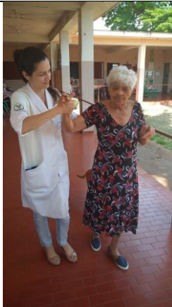
Realizado em 15/10/2019