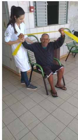
Realizado em 10/10/2019