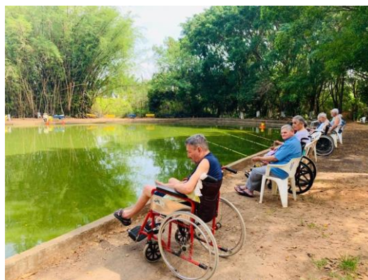
Realizado em 02/10/2019