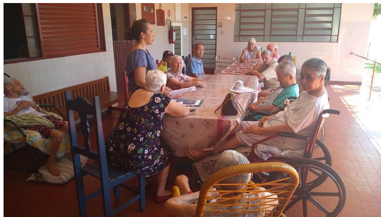
Atividade realizada em 11/10/2019 – CONTAÇÃO DE HISTORIA: A árvore.