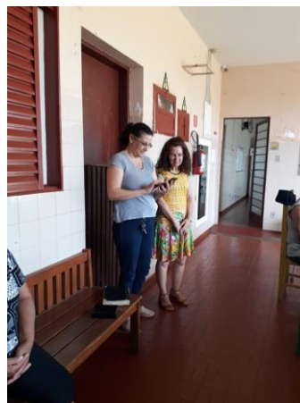
Visita dos membros da igreja Metodista – Alv. Machado –20/10/2019