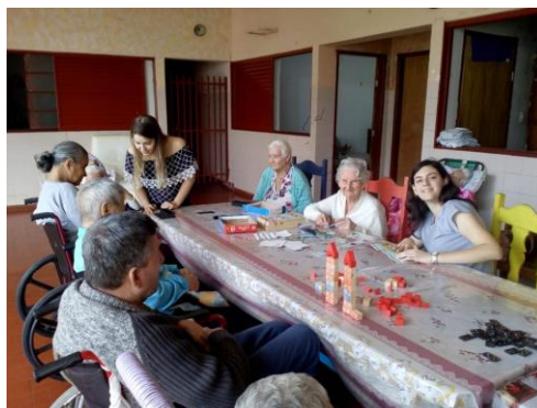
Realizado em 22/10/2019 – Atividade: JOGOS RECREATIVOS.