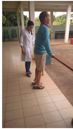
Realizado em 07/10/2019