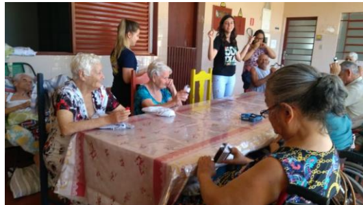
Realizado em 15/10/2019 – Atividade: Instrumentos musicais.