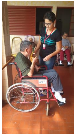
Realizado em 07/10/2019