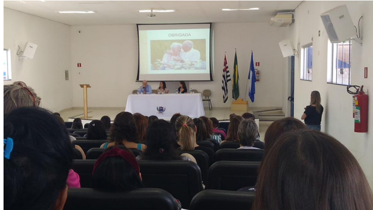
Realizado em 04/10/2019