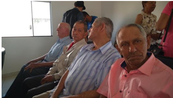
Realizado em 01/09/2019 – EVENTO NO AUDITÓRIO DA CÂMARA MUNICIPAL.