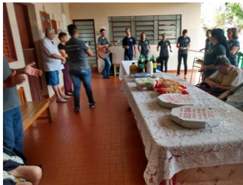
Visita dos membros da igreja Ministério Mudança de Vida – Pres. Prudente – 19/10/2019