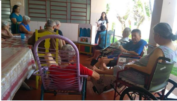
Realizado em 29/10/2019 – Atividade: CONTAÇÃO DE HISTÓRIA COM FANTOCHES.