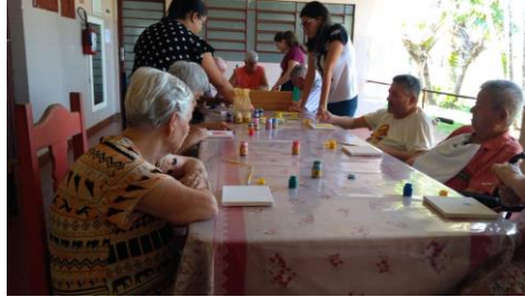
Realizado em 01/10/2019 – Atividade: Pintura em tela.