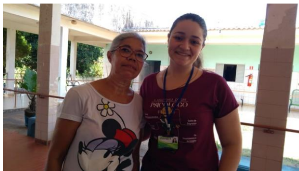
Realizado nos dias 01, 08, 15, 22 E 29/10/2019.