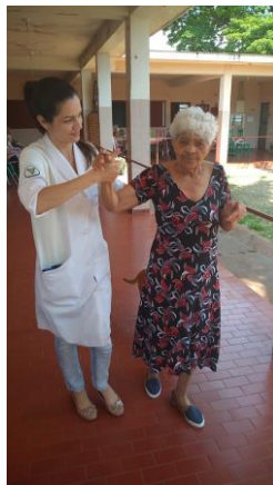
Realizado em 15/10/2019