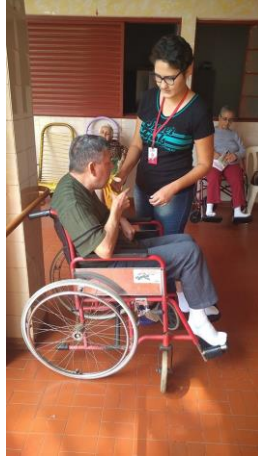
Realizado em 07/10/2019