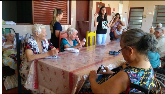
Realizado em 15/10/2019 – Atividade: Instrumentos musicais.