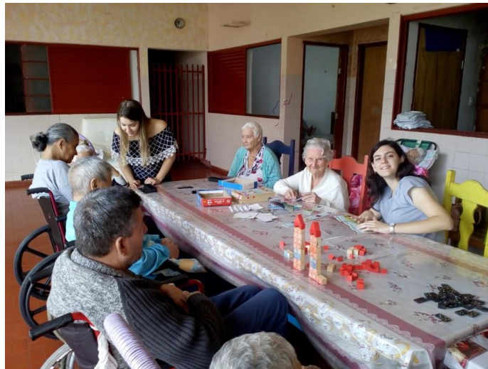
Realizado em 22/10/2019 – Atividade: JOGOS RECREATIVOS.