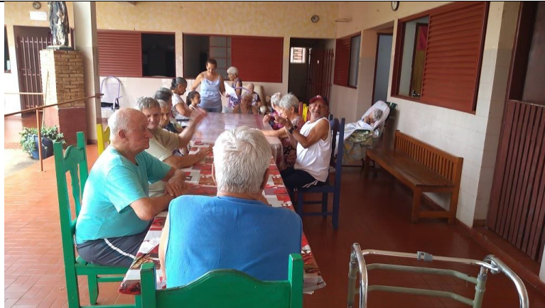
Atividade realizada em 18/10/2019 – CONTAÇÃO DE HISTORIA: A PARÁBOLA CHINESA DA SOGRA RUIM.