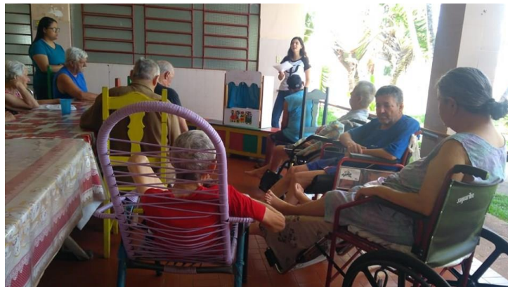
Realizado em 29/10/2019 – Atividade: CONTAÇÃO DE HISTÓRIA COM FANTOCHES.