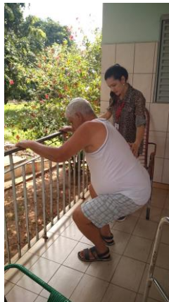
Realizado em 03/10/2019