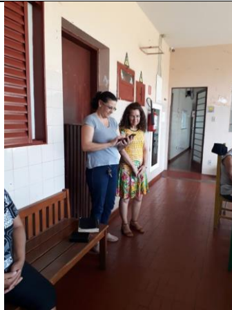
Visita dos membros da igreja Metodista – Alv. Machado –20/10/2019