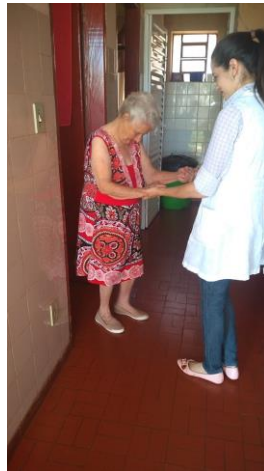
Realizado em 29/10/2019