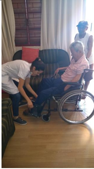
Realizado em 24/10/2019