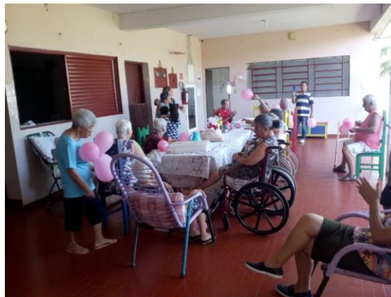
Visita dos membros da Igreja Assembléia de Deus – Pres. Prudente – 26/10/2019