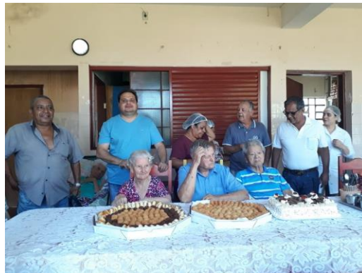
Realizada em 30/10/2019