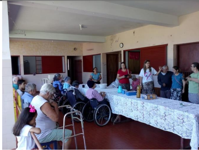
Visita dos membros da Igreja Assembléia de Deus – Pres. Prudente – 28/09/2019