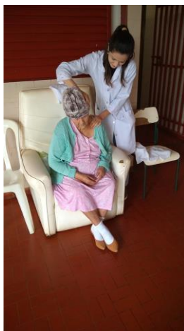
Realizado em 26/09/2019