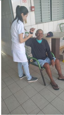
Realizado em 30/09/2019