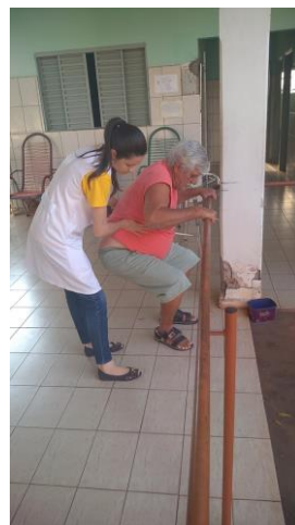
Realizado em 16/09/2019