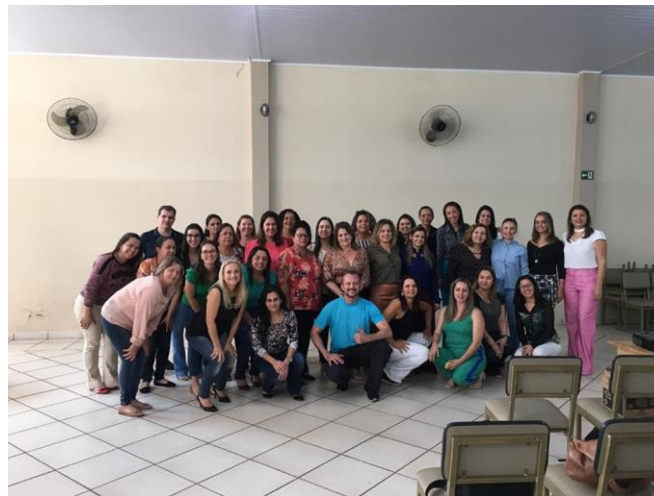
Realizado em 24/09/2019