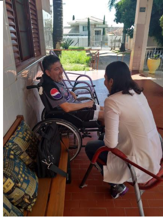
Realizado em 09/09/2019