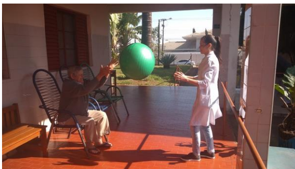
Realizado em 23/09/2019