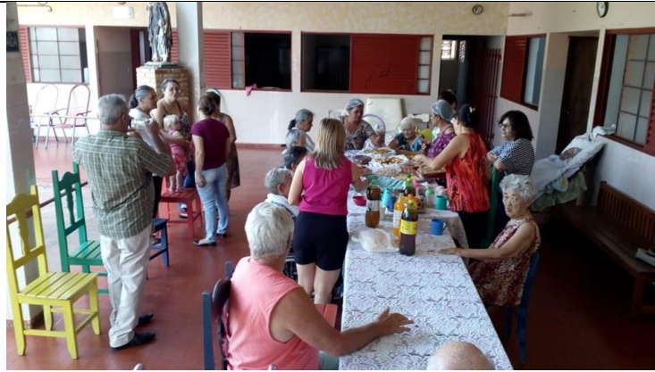
Visita do Setor São Matias – 08/09/2019