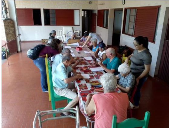
Realizado em 10/09/2019 – Atividade de apresentação e desenho.