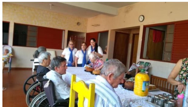
Visita, doação e café da tarde Fraternidade Feminina – 13/09/2019