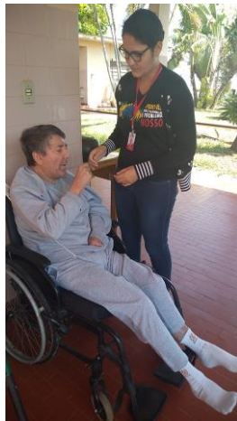
Realizado em 23/09/2019