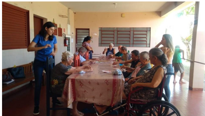
Realizado em 17/09/2019 – Atividade: Quebra-cabeça.