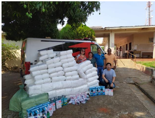
Visita e doação do Deinter 8 – 13/09/2019