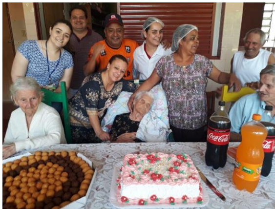
Realizada em 24/09/2019