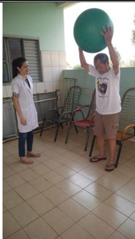
Realizado em 19/09/2019