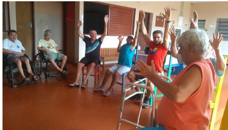
Realizado em 18/09/2019