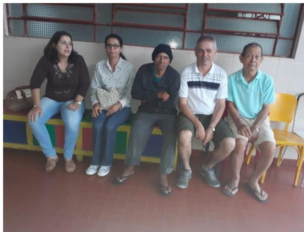
Visita do Setor São João Evangelista – 01/09/2019