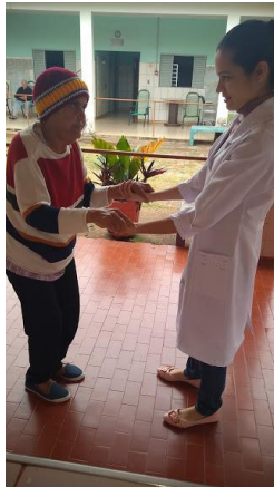
Realizado em 02/09/2019