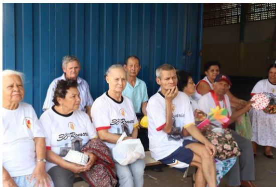
Realizado em 08/09/2019