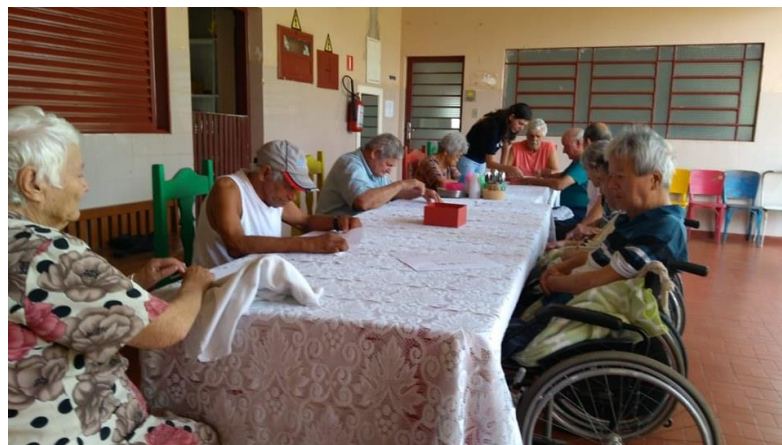
Realizado em 24/09/2019 – Atividade: adivinhações e palavras cruzadas.