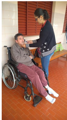
Realizado em 02/09/2019