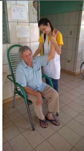
Realizado em 10/09/2019