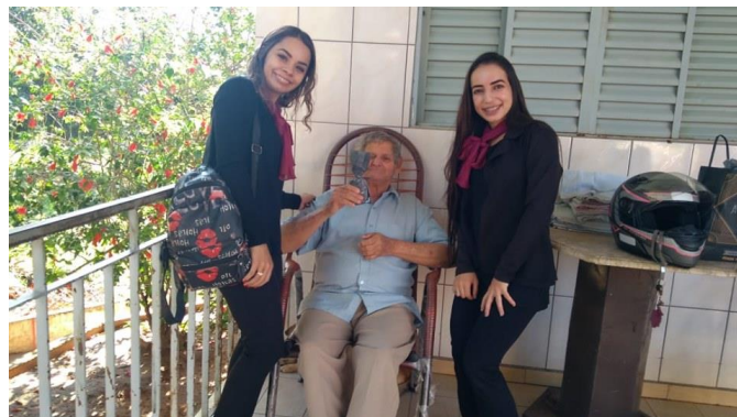
Realizado em 27/09/2019