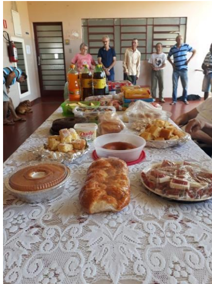
Visita do Setor Santa Bárbara – 29/09/2019