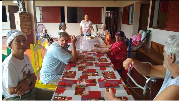
27/09/2019 – Confeção das cartas resposta dos idosos para os alunos e leitura.