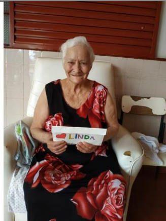
20/09/2019 – Feito entrega e leitura das cartas recebidas junto aos idosos.