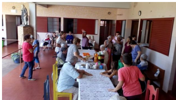
Visita do Setor São Mateus – 22/09/2019