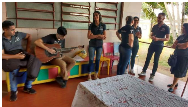
Visita dos membros da igreja Ministério Mudança de Vida – Pres. Prudente – 21/09/2019