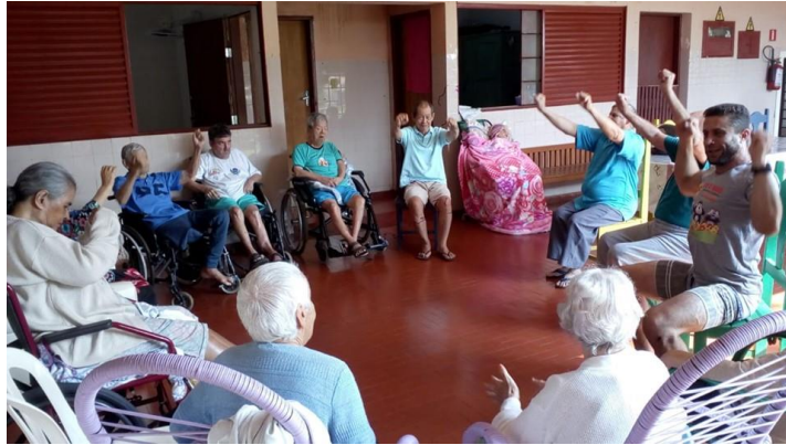
Realizado em 04/09/2019