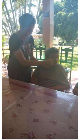
Realizado em 30/09/2019