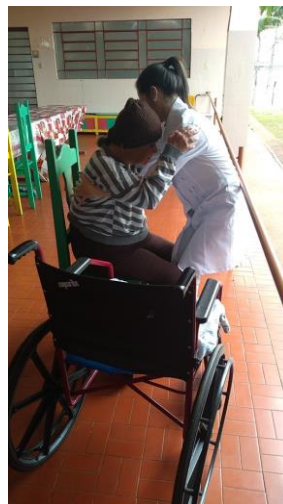
Realizado em 05/09/2019