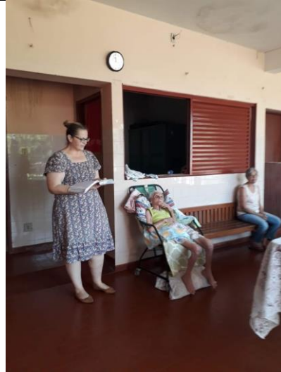
Visita dos membros da igreja Metodista – Alv. Machado – 15/092019