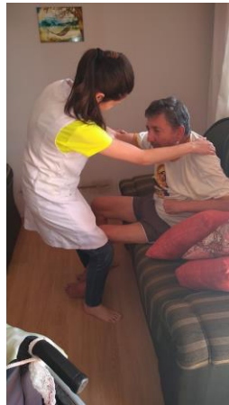
Realizado em 12/09/2019